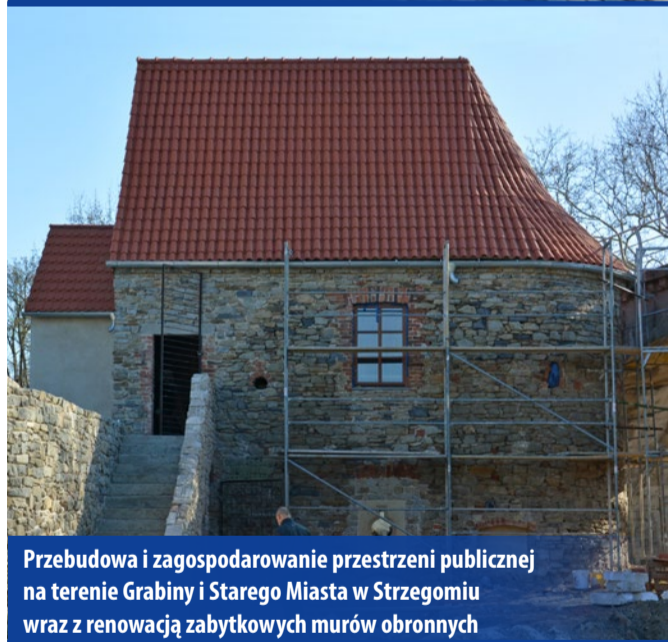
Przebudowa i zagospodarowanie przestrzeni publicznej na terenie Grabiny i Starego Miasta w Strzegomiu wraz z renowacją zabytkowych murów obronnych