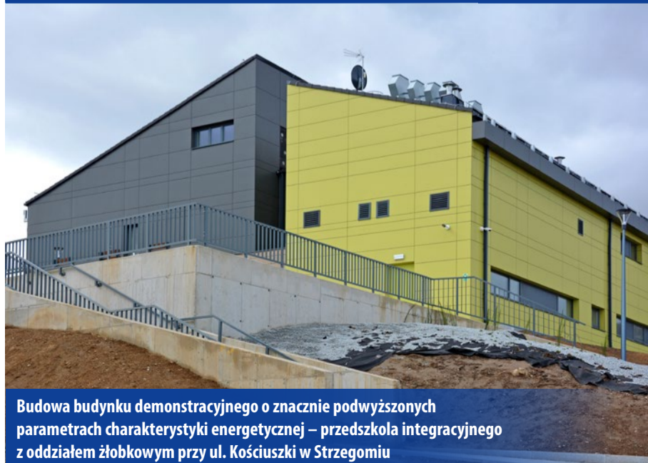
Budowa budynku demonstracyjnego o znacznie podwyższonych parametrach charakterystyki energetycznej – przedszkola integracyjnego z oddziałem żłobkowym przy ul. Kościuszki w Strzegomiu