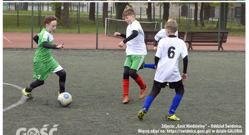
Więcej zdjęć na: https://swidnica.gosc.pl/ w dziale GALERIA