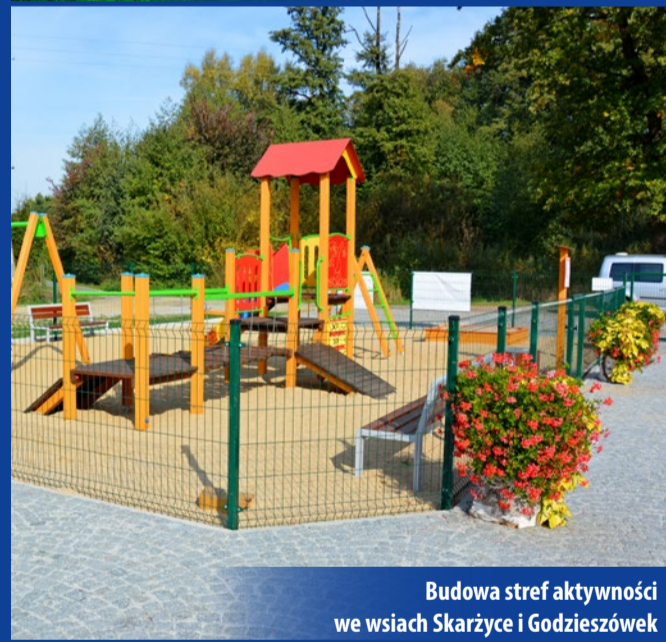
Budowa stref aktywności we wsiach Skarżyce i Godzieszówek