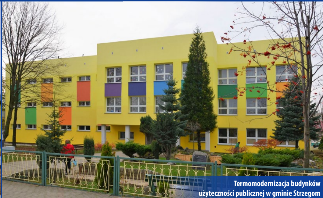
Termomodernizacja budynków użyteczności publicznej w gminie Strzegom