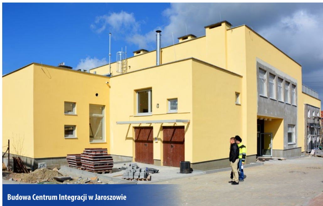
Budowa Centrum Integracji w Jarosławie