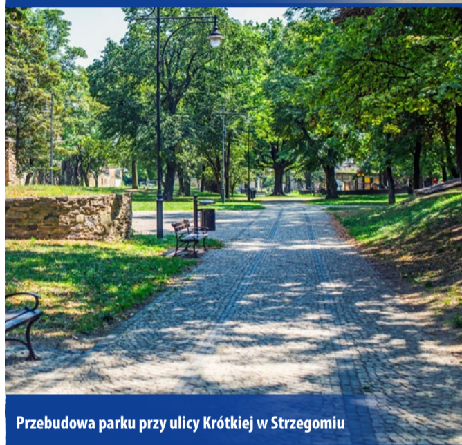
Przebudowa parku przy ulicy Krótkiej w Strzegomiu