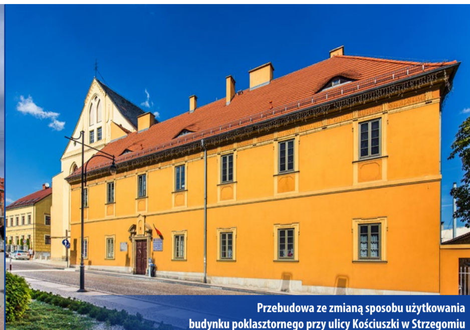
Przebudowa ze zmianą sposobu użytkowania budynku poklasztornego przy ulicy Kościuszki w Strzegomiu