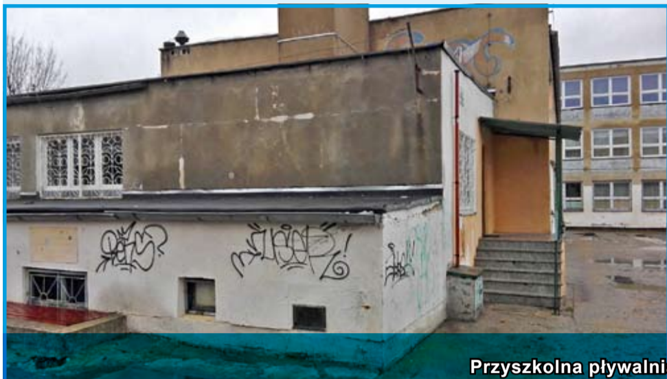
Przyszkoła pływalnia Delfinek w Strzegomiu

„10 years challenge” to niezwykle popularna ostatnio akcja w mediach społecznościowych. My postanowiliśmy trochę zmodyfikować tę zabawę – na wzór innych miast np. Wrocławia – i pokazać kilka miejsc w naszej gminie, które uległy dużej metamorfozie. Zapraszamy do obejrzenia fotografii.