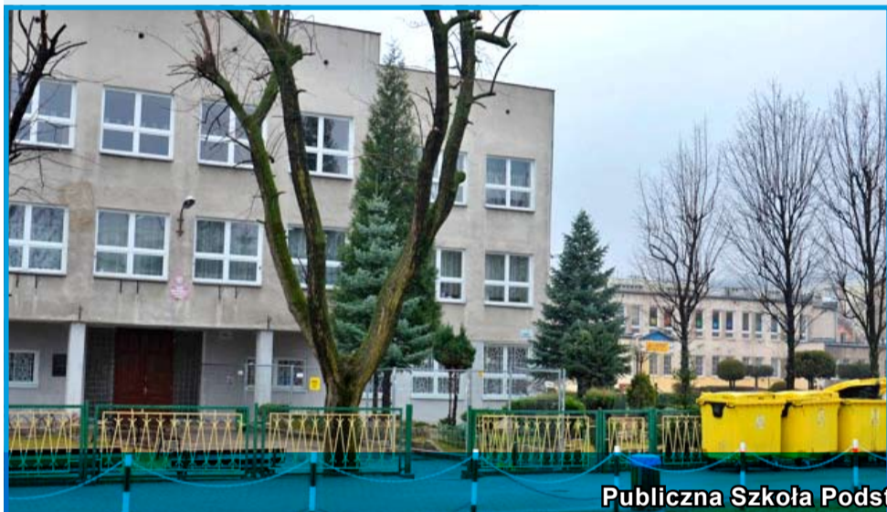
Publiczna Szkoła Podstawowa nr 2 w Strzegomiu