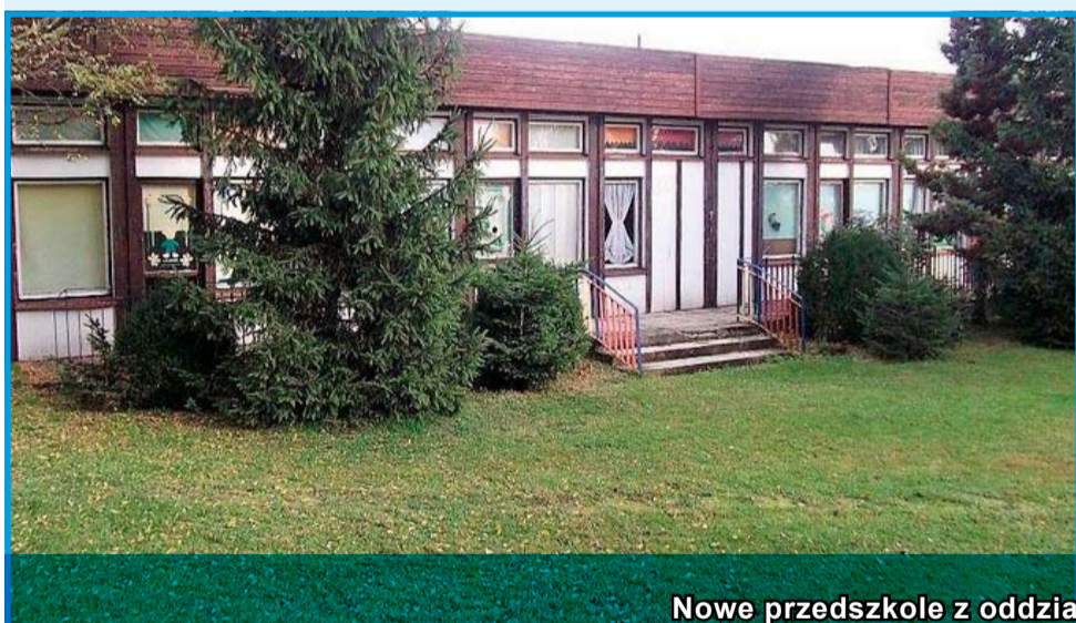
Nowe przedszkole z oddziałem żłobkowym w Strzegomiu