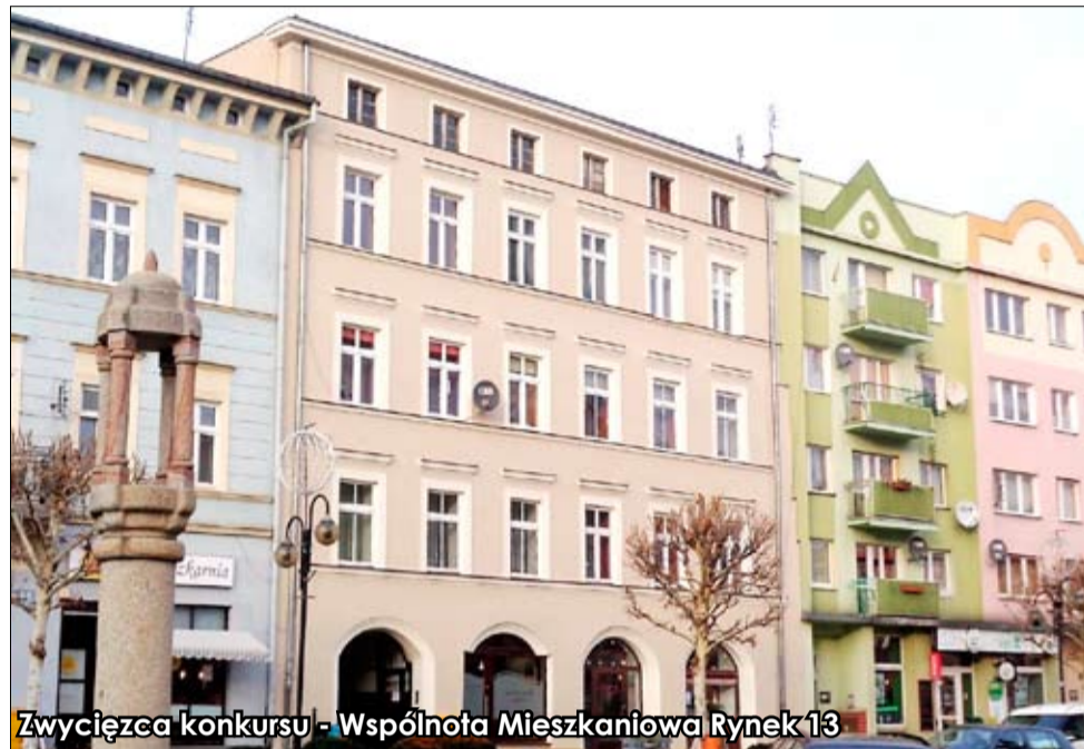
Zwycięzca konkursu - Wspólnota Mieszkaniowa Rynek 13

Zgłoszenia do konkursu „Odnów i wygraj” należy dokonywać do 6 grudnia danego roku kalendarzowego. Rozstrzygnięcie konkursu następuje do połowy lutego następnego roku. Środki na nagrody pieniężne pochodzą z budżetu gminy Strzegom.