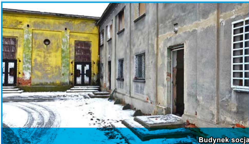
Budynek socjalny w Jaroszowie