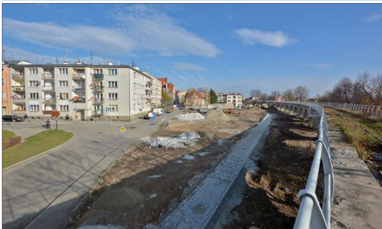
Widok z zabytkowej estakady na rewitalizowany teren w Strzegomiu. Z krajobrazu zniknęły szpecące komórki, na miejscu których niedawno pojawiła się efektowna granitowa ścieżka