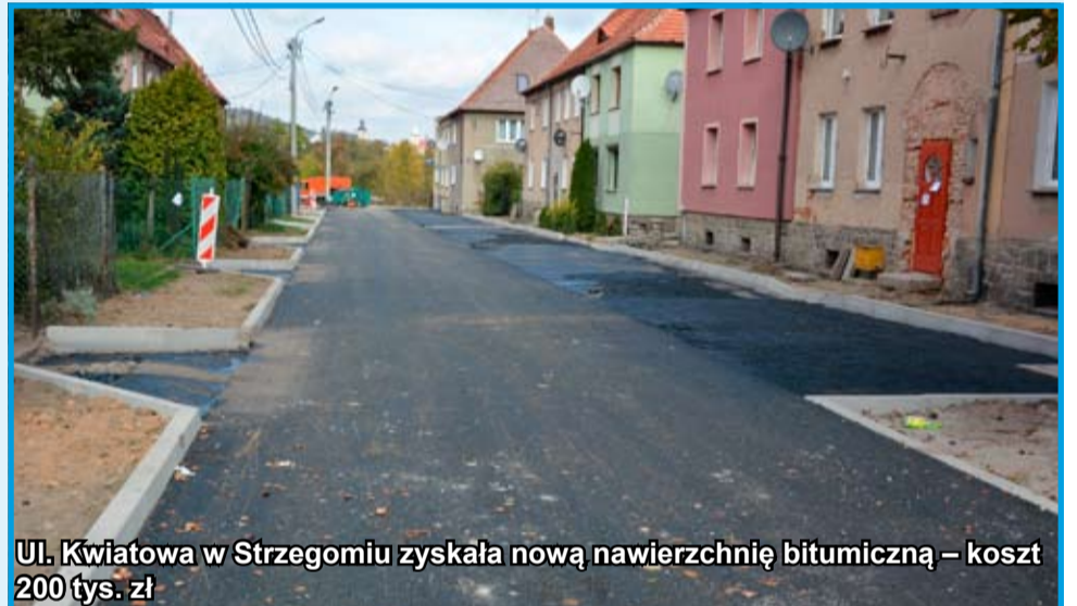
Ul. Kwiatowa w Strzegomiu zyskała nową nawierzchnię bitumiczną – koszt 200 tys. zł