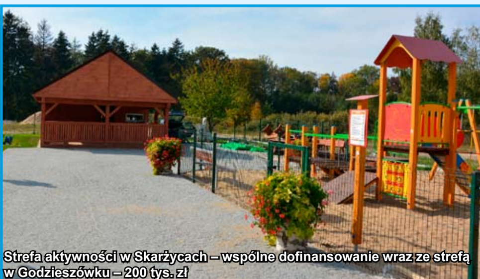
Strefa aktywności w Skarżycach – wspólne dofinansowanie wraz ze strefą w Godzieszówku – 200 tys. zł