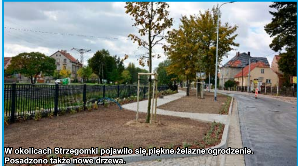
W okolicach Strzegomki pojawiło się piękne żelazne ogrodzenie. Posadzono także nowe drzewa.