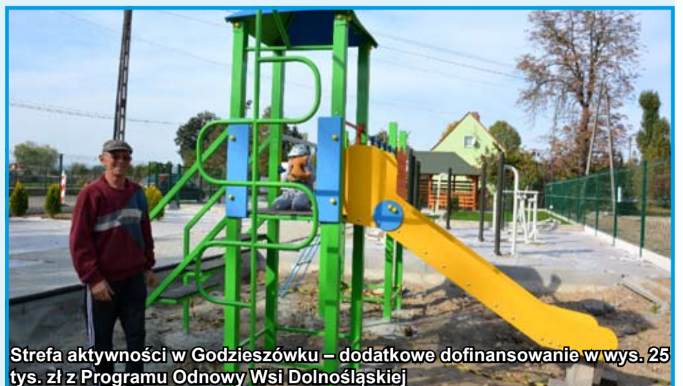
Strefa aktywności w Godzieszówku – dodatkowe dofinansowanie w wys. 25 tys. zł z Programu Odnowy Wsi Dolnośląskiej