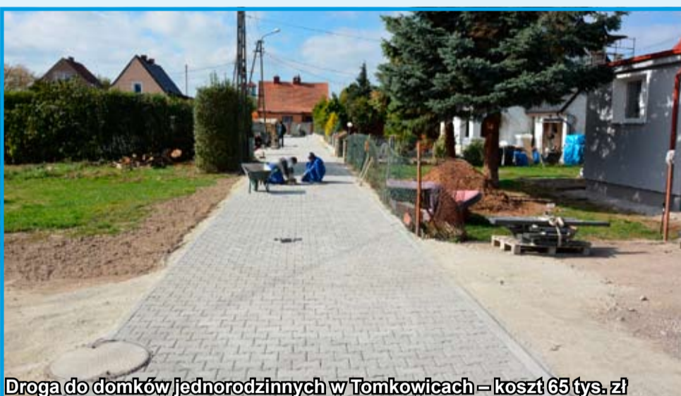
Droga do domków jednorodzinnych w Tomkowicach – koszt 65 tys. zł