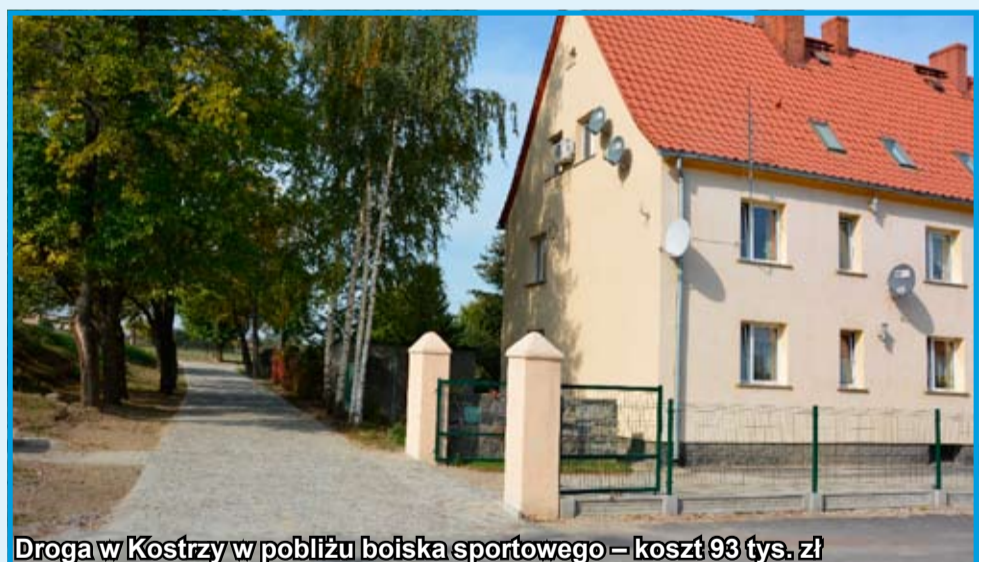
Droga w Kostrzy w pobliżu boiska sportowego – koszt 93 tys. zł