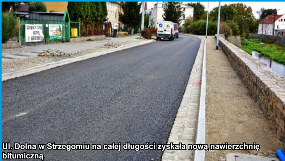
Ul. Dolna w Strzegomiu na całej długości zyskała nową nawierzchnię bitumiczną

W ostatnich miesiącach wykonano wiele inwestycji i remontów na terenie całej gminy Strzegom. Część z nich jest jeszcze w trakcie realizacji. O ich końcowym efekcie przekonamy się w ciągu kilku następnych tygodni. Nie zmienia to faktu, że już dzisiaj zarówno miasto, jak i nasze wsie zyskują na atrakcyjności. Zapraszamy do zapoznania się z krótkim raportem inwestycyjnym.