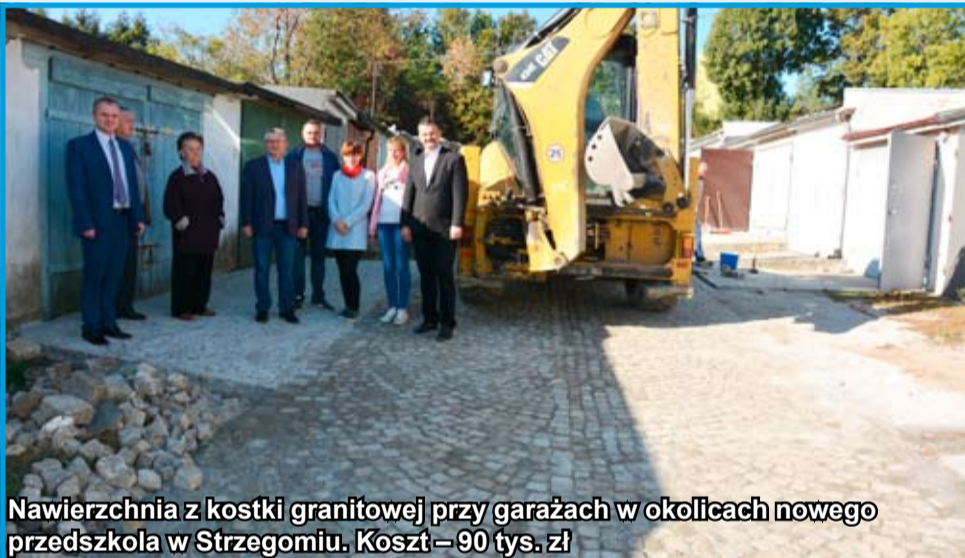
Nawierzchnia z kostki granitowej przy garażach w okolicach nowego przedszkola w Strzegomiu. Koszt – 90 tys. zł