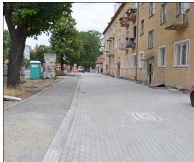
Ograniczenie indywidualnego ruchu zmotoryzowanego w centrum miasta poprzez budowę ścieżki rowerowej oraz przebudowę ciągów pieszych wzdłuż Alei Wojska Polskiego w Strzegomiu

Wartość projektu wynosi ok. 2,14 mln zł. Gmina Strzegom otrzymała dofinansowanie w wysokości ok. 1,27 mln zł. Wykonawcą przedsięwzięcia jest Świdnickie Przedsiębiorstwo Budowy Dróg i Mostów.