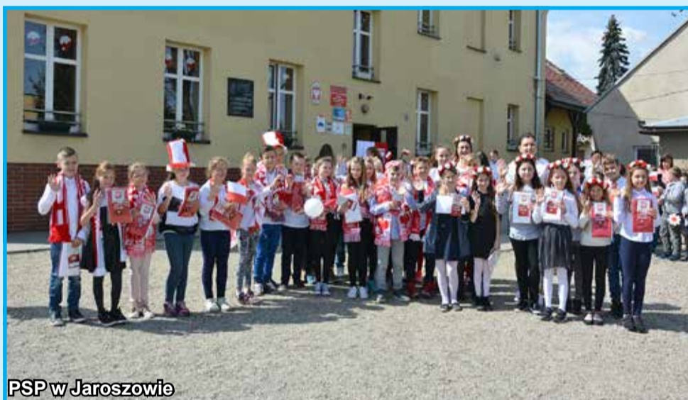
PSP w Jaroszowie