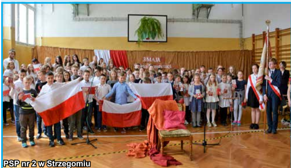
PSP nr 2 w Strzegomiu

Podczas spotkań z młodzieżą w szkołach podstawowych naszej gminy uczniowie klas IV i V otrzymali flagi narodowe od władz samorządowych Strzegomia. Wszystko po to, aby promować postawę patriotyczną oraz godnie uczcić uroczystości majowe – m. in. poprzez wywieszenie biało-czerwonej flagi na swoich domach. Poniżej pamiątkowe fotografie młodych patriotów.