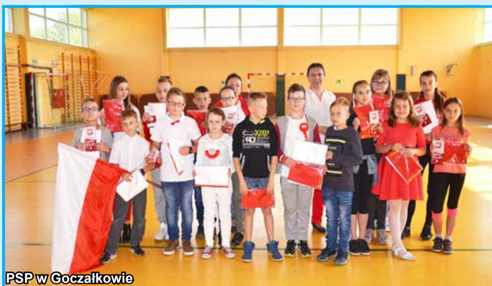
PSP w Goczałkowie