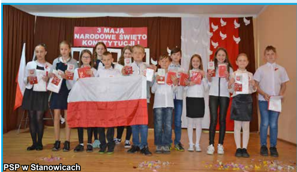
PSP w Stanowicach