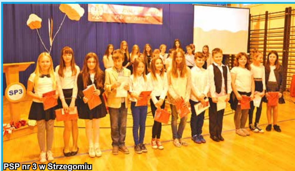
PSP nr 3 w Strzegomiu