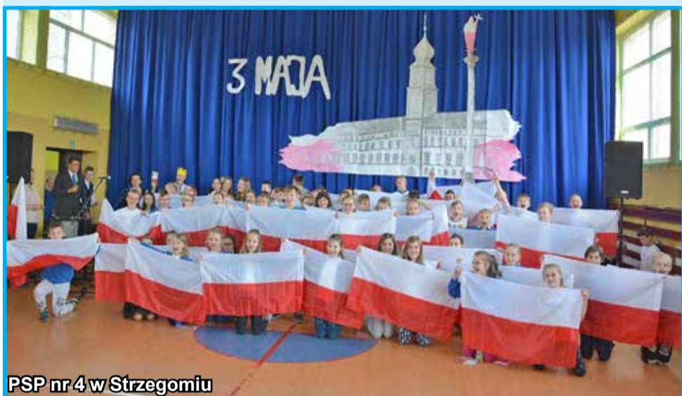
PSP nr 4 w Strzegomiu