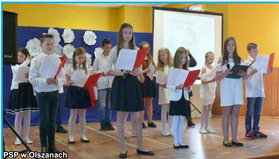
PSP w Olszanach