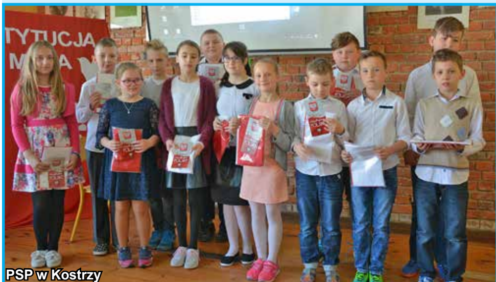
PSP w Kostrzy