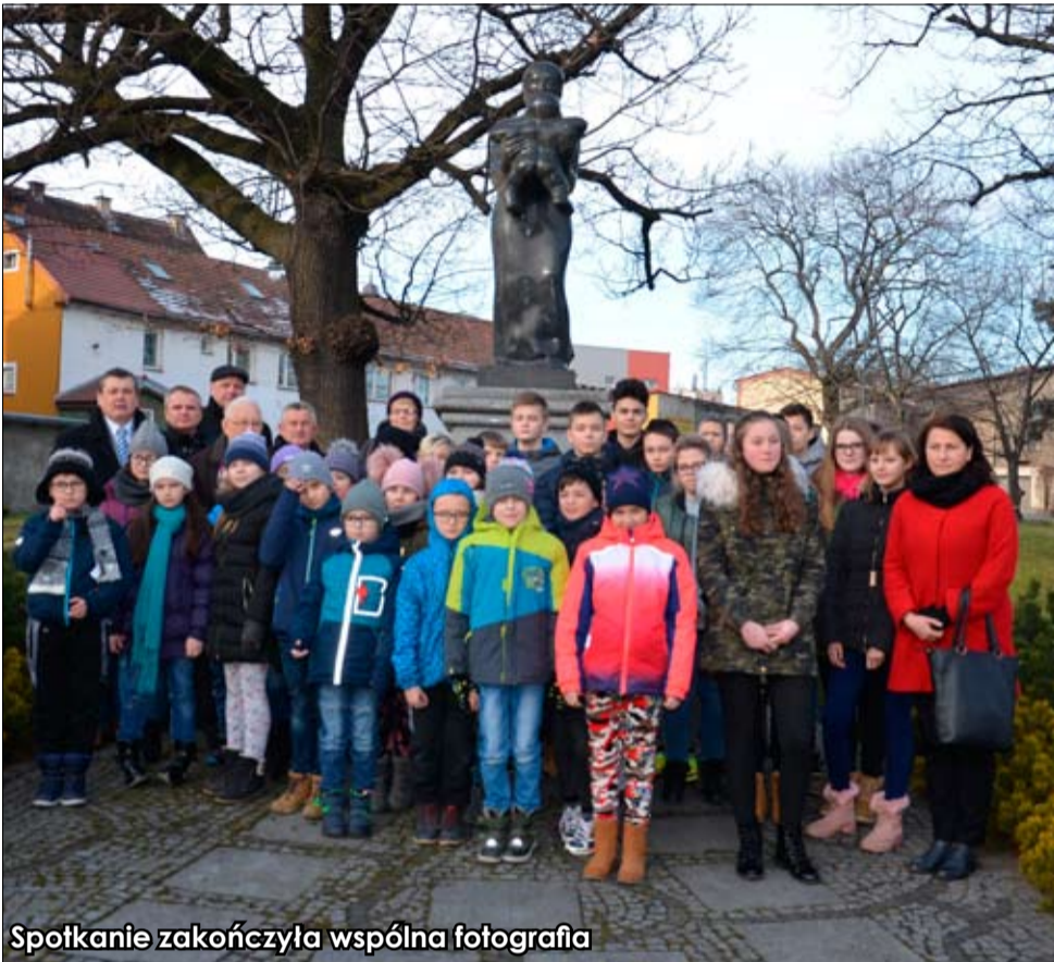
Spotkanie zakończyła wspólna fotografia

Minęło 78 lat od pierwszej masowej deportacji obywateli polskich w głąb ZSRR. Strzegomianie pamiętali o tym wydarzeniu i złożyli hołd Sybirakom 12 lutego br. przed pomnikiem Bezimiennej Matki Sybiraczki.