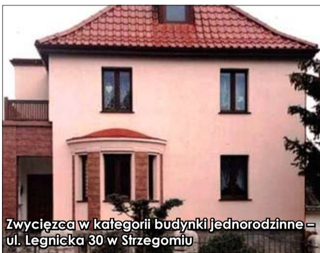
Zwycięzca w kategorii budynki jednorodzinne - ul. Legnicka 30 w Strzegomiu