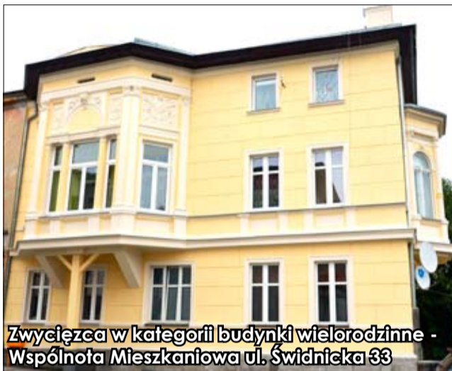
Zwycięzca w kategorii budynki wielorodzinne - Wspólnota Mieszkaniowa ul. Świdnicka 33