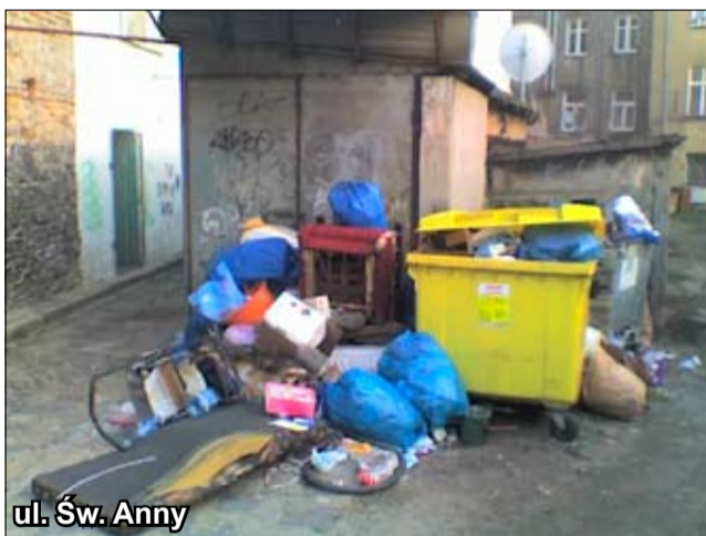
ul. Św. Anny