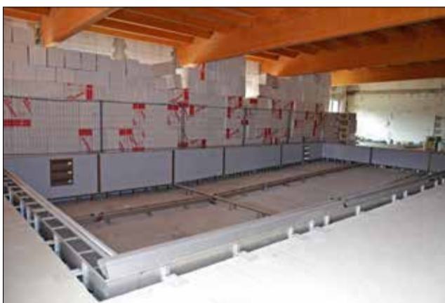
Roboty budowlane wykonuje Przedsiębiorstwo Budowlano-Konserwatorskie Castellum Sp. z o.o. z Wrocławia.

Planowany koszt wykonania całej inwestycji wynosi ok. 8 mln zł. Gmina pozyskała na ten cel dotację z budżetu województwa dolnośląskiego w wysokości 1,25 mln zł w ramach pilotażowego programu budowy małych przyszkolnych krytych pływalni pn. „Dolnośląski Delfinek” oraz dotację z Ministerstwa Sportu i Turystyki w wysokości 1,3 mln zł w ramach Programu Rozwoju Bazy Sportowej Województwa Dolnośląskiego.