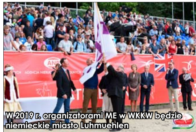
W 2019 r. organizatorami ME w WKKW będzie niemieckie miasto Luhmuehlen

Organizacja takiego przedsięwzięcia to nie tylko splendor i znakomita okazja do promocji, ale też duża odpowiedzialność. By jak najlepiej przygotować się do tego wydarzenia, organizatorzy już od kilkunastu miesięcy planowali w szczegółach przebieg sierpniowego święta w Morawie. Obiektywnie trzeba przyznać, że wszyscy wywiązali się ze swojego zadania w sposób celujący. - To były wspaniałe dni dla Morawy i całej gminy Strzegom. Mistrzostwa