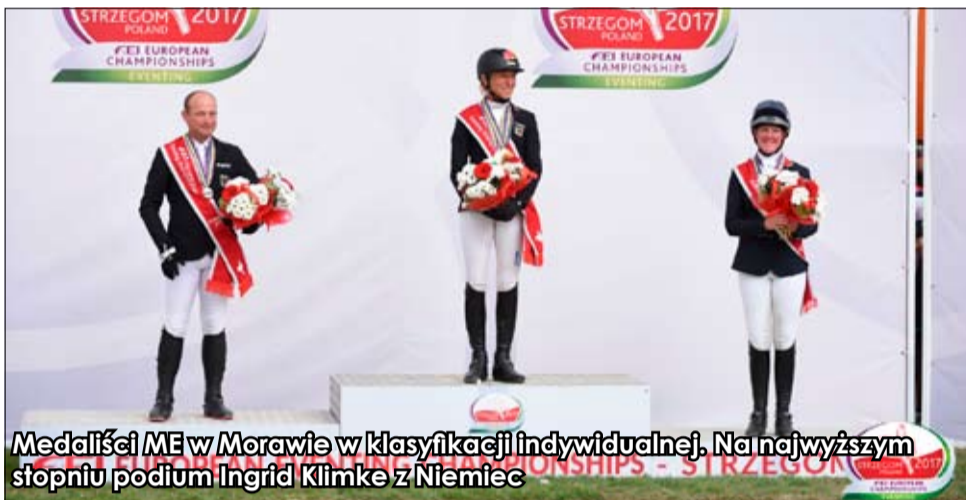
Medaliści ME w Morawie w klasyfikacji indywidualnej. Na najwyższym stopniu podium Ingrid Klimke z Niemiec

Hipodrom w Morawie odwiedziło mnóstwo kibiców i turystów, nierzadko zagranicznych. Szacuje się, że sobotni cross w kulminacyjnym momencie oglądało nawet 18 tys. osób. Do tego trzeba doliczyć telewizorów, którzy za pośrednictwem m.in. TVP 1, TVP Sport i innych telewizji