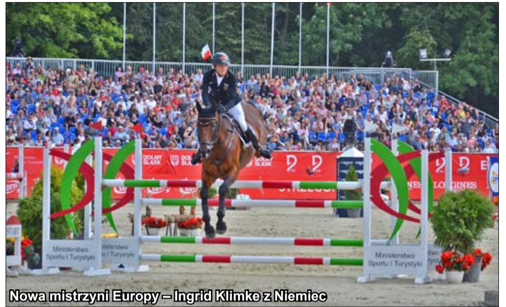
Nowa mistrzyni Europy – Ingrid Klimke z Niemiec

Pierwszy tegoroczny start będzie miał miejsce w dniach 9-10 września w Warszawie podczas międzynarodowych targów z branży fitness (FIWE)