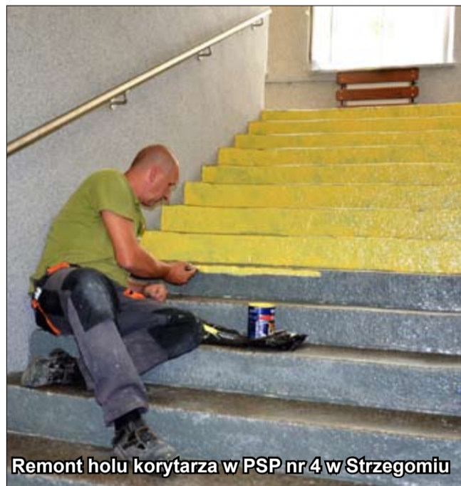
Remont holu korytarza w PSP nr 4 w Strzegomiu

W szkołach gminy Strzegom, jak co roku podczas wakacji, przeprowadzono remonty. Wszystko to po to, aby uczniowie powitali nowy rok szkolny w odświeżonych pomieszczeniach.