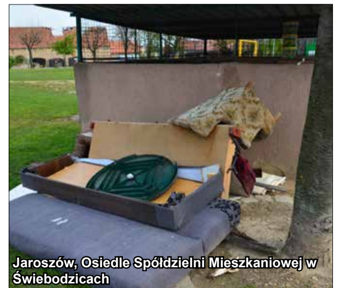
Jarosów, Osiedle Spółdzielni Mieszkaniowej w Świebodzicach