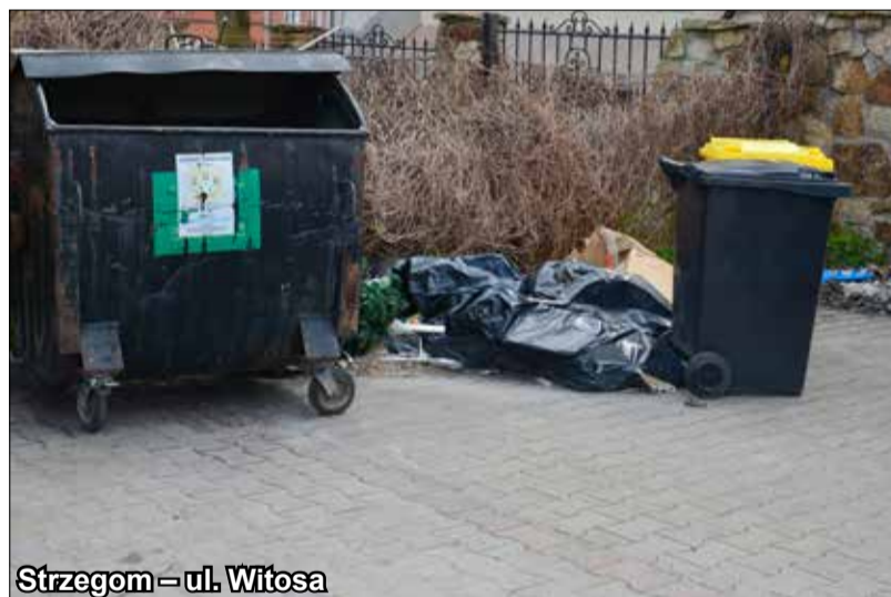
Strzegom – ul. Witosa

Przedstawiamy przypadki, gdzie do takich wykroczeń doszło.