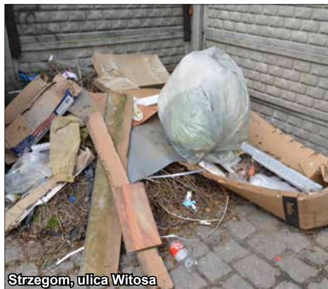
Strzegom, ulica Witosa