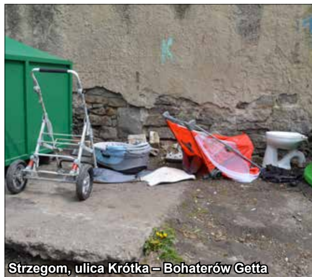
Strzegom, ulica Krótka – Bohaterów Getta