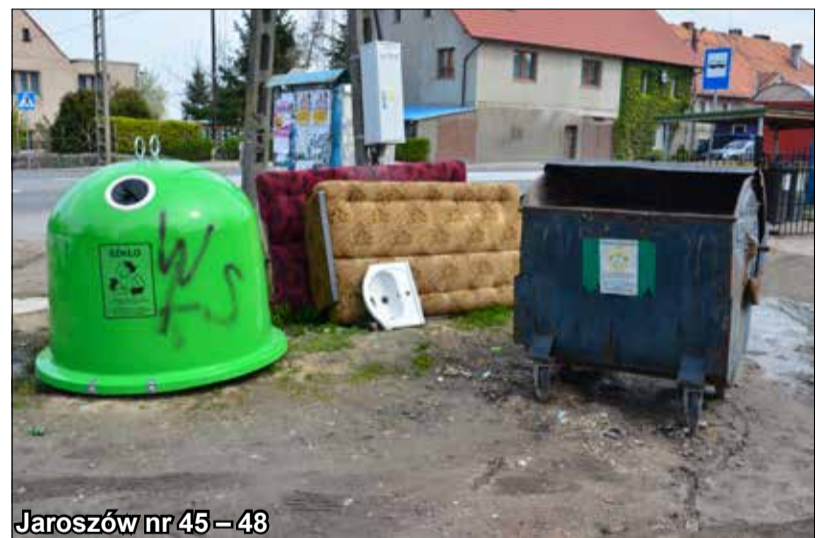
Jarosów nr 45 – 48