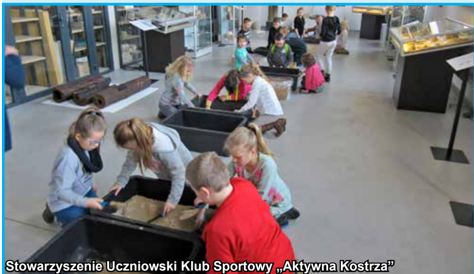
Stowarzyszenie Uczniowski Klub Sportowy „Aktywna Kostrza”