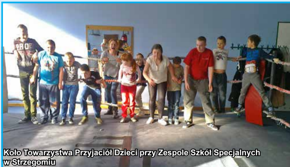
Koło Towarzystwa Przyjaciół Dzieci przy Zespole Szkół Specjalnych w Strzegomiu