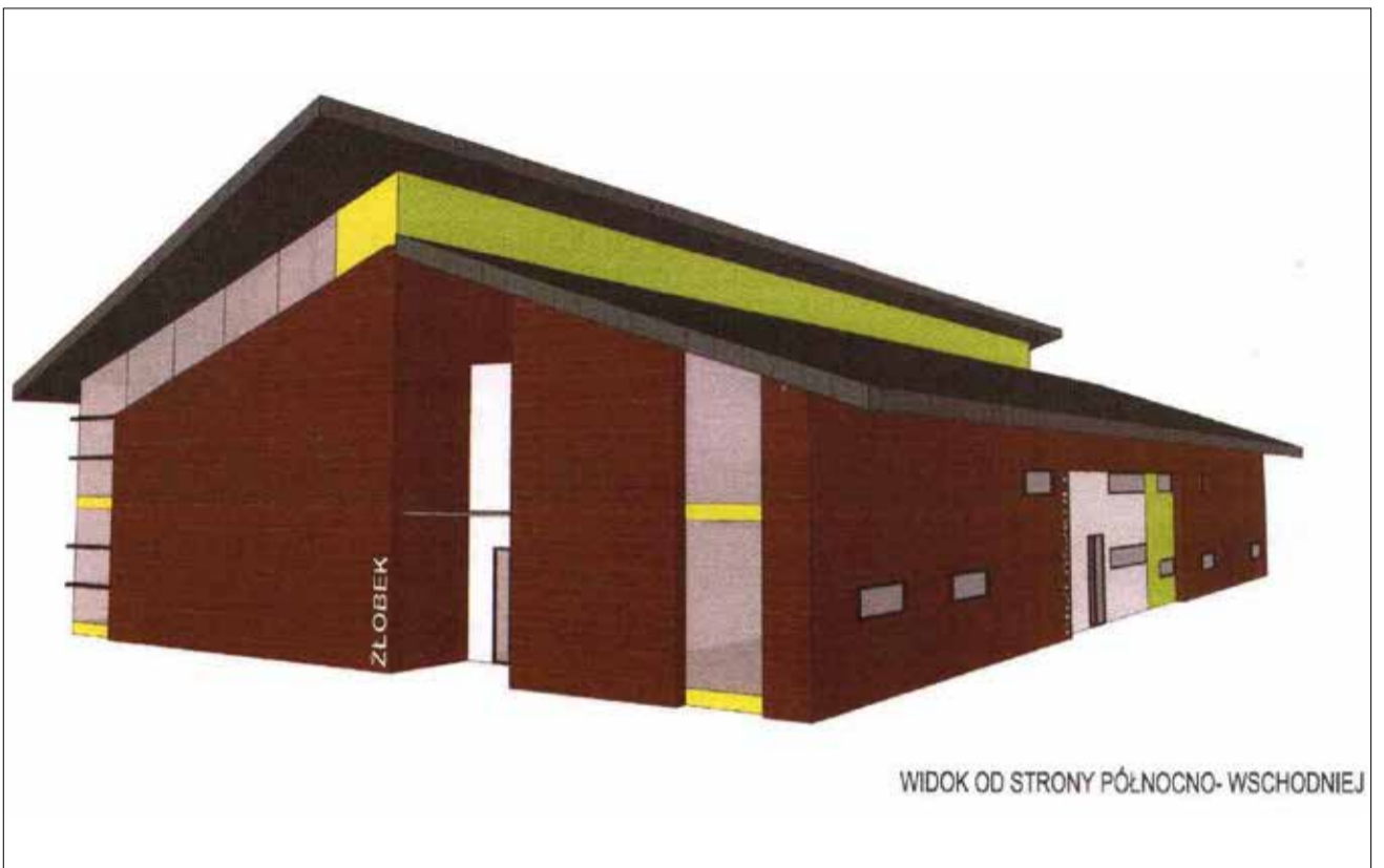
WIDOK OD STRONY PÓŁNOCNO-WSCHODNIEJ

Powierzchnia użytkowa przedszkola – ponad 1900m 2 w tym m.in.: 6 sal przedszkolnych i żłobkowych, sala wielofunkcyjna, sale zabaw, antresole, szatnie, zaplecze kuchenne, gabinet pielęgniarki i logopedy, pomieszczenia biurowe i techniczne. Na terenie przy przedszkolu powstaną m.in. 3 place zabaw dostosowane do różnych grup wiekowych, zjeżdżalnie terenowe i amfiteatr terenowy -wykorzystujące ukształtowanie terenu, sad owocowy oraz ogrody „ptasi” i „motyli”. Planowane rozpoczęcie inwestycji to lipiec 2017, natomiast zakończenie listopad 2018.