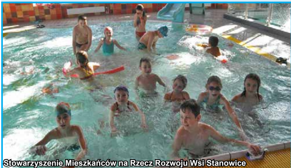
Stowarzyszenie Mieszkańców na Rzecz Rozwoju Wsi Stanowice