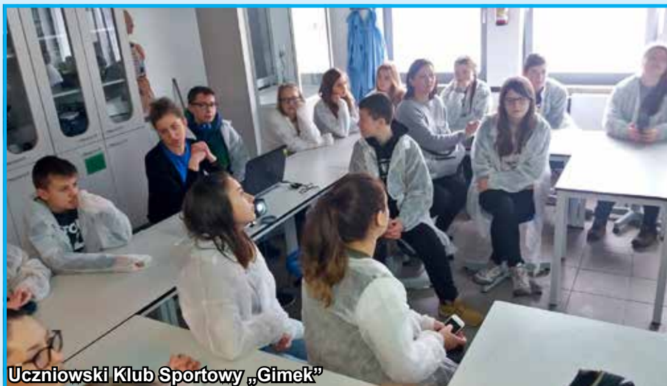
Uczniowski Klub Sportowy „Gimek”