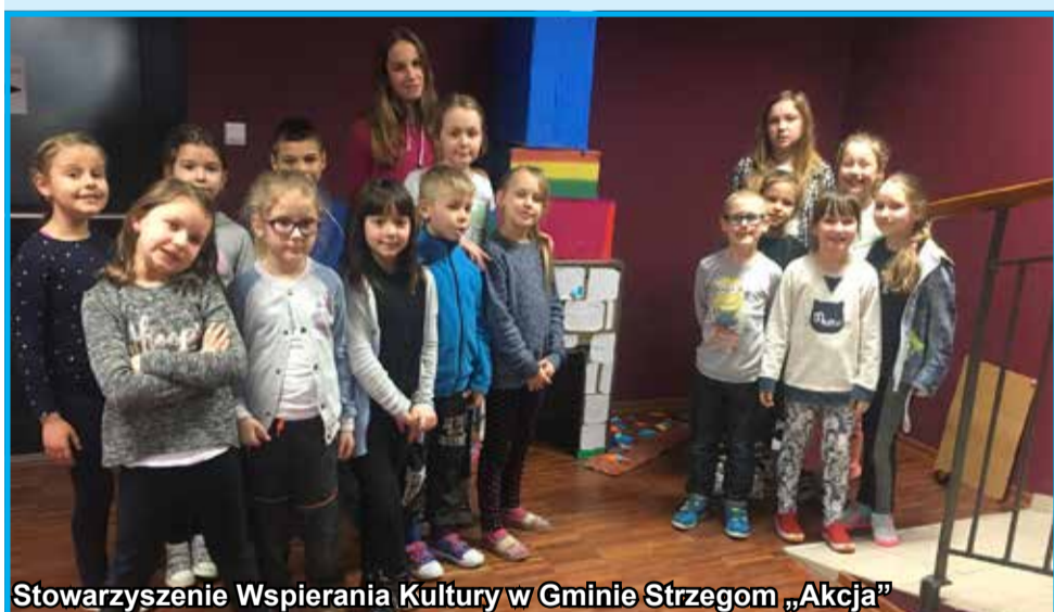
Stowarzyszenie Wspierania Kultury w Gminie Strzegom „Akcja”