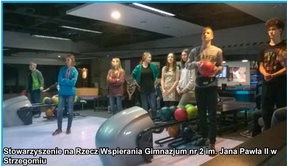
Stowarzyszenie na Rzecz Wspierania Gimnazjum nr 2 im. Jana Pawła II w Strzegomiu

Na organizację ferii zimowych dla stowarzyszeń gmina Strzegom przeznaczyła w tym roku z budżetu kwotę ok. 48 tys. złotych. Środki na organizację wypoczynku dla dzieci otrzymało dziewięć organizacji. Najmłodsi spędzali aktywnie czas na zajęciach sportowych, wycieczkach, czy rozmaitych konkursach i zabawach. Zapraszamy do obejrzenia fotoreportażu z ferii w gminie Strzegom.