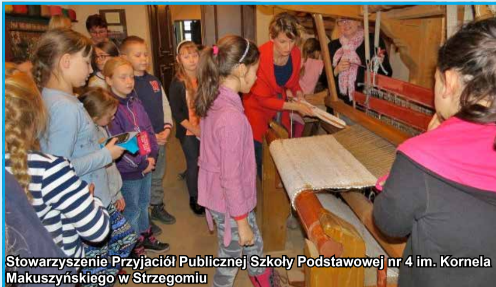
Stowarzyszenie Przyjaciół Publicznej Szkoły Podstawowej nr 4 im. Kornela Makuszyńskiego w Strzegomiu