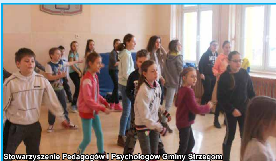
Stowarzyszenie Pedagogów i Psychologów Gminy Strzegom