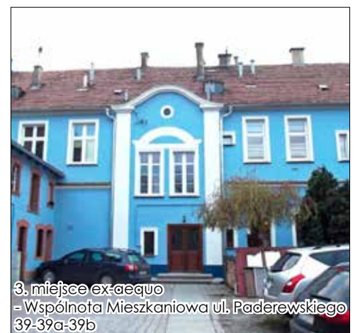
3. miejsce ex-aequo - Wspólnota Mieszkaniowa ul. Paderewskiego 39-39a-39b