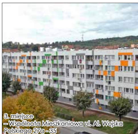
3. miejsce - Wspólnota Mieszkaniowa ul. Al. Wojska Polskiego 27a-35