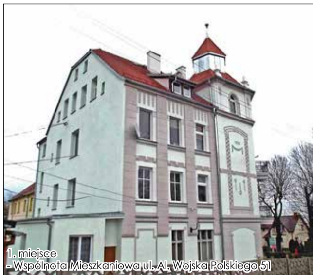
1. miejsce - Wspólnota Mieszkaniowa ul. Al. Wojska Polskiego 51

Przedstawiamy zdjęcia 7 odnowionych kamienic w Strzegomiu, które zyskały największe uznanie komisji konkursowej w ramach konkursu „Odnów i wygraj” za rok 2016. Tym razem najlepsza okazał się Wspólnota Mieszkaniowa ul. Wojska Polskiego 51, ale pozostałe budynki również zmieniły się nie do poznania i zachwycają naszych mieszkańców.