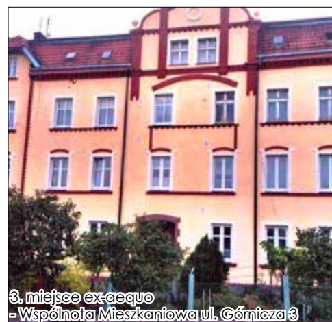
3. miejsce ex-aequo - Wspólnota Mieszkaniowa ul. Górnicza 3