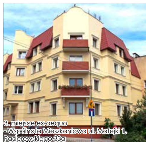
3. miejsce ex-aequo - Wspólnota Mieszkaniowa ul. Matejki 1, Paderewskiego 33a