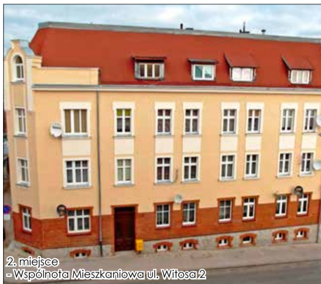
2. miejsce - Wspólnota Mieszkaniowa ul. Witosa 2