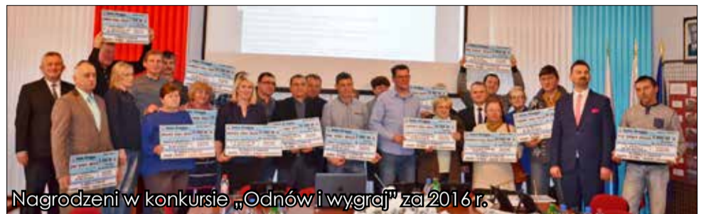
Nagrodzeni w konkursie „Odnów i wygraj” za 2016 r.

W ramach dostosowania sieci szkół do nowego ustroju szkolnego radni podjęli decyzję o przeniesieniu PSP Nr 3 w Strzegomiu do budynku po wygaszonym Gimnazjum Nr 1. Jednocześnie siedziba Publicznego Przedszkola Nr 4 w Strzegomiu zostanie przeniesiona na dwa lata do obecnego budynku PSP nr 3. Ma to związek z planowaną budową nowego budynku Przedszkola Nr 4 w systemie pasywnym. Radni podjęli również uchwałę w sprawie projektu dostosowania sieci szkół podstawowych i gimnazjów do nowego ustroju szkolnego, wprowadzonego ustawą - Prawo oświatowe. Jak