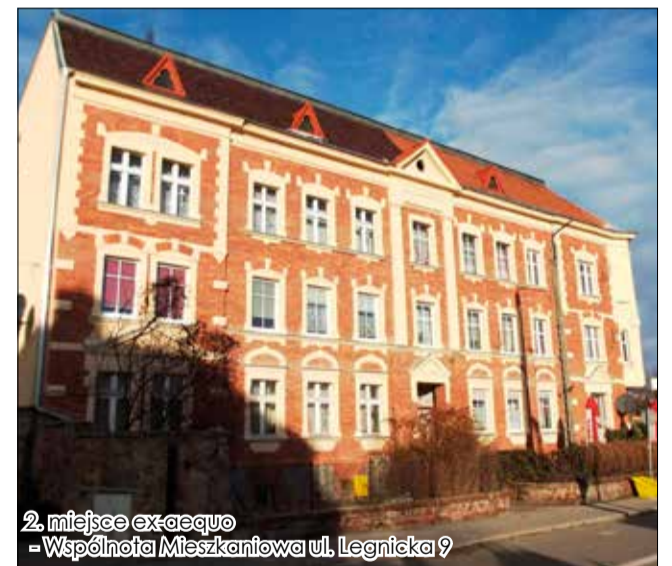
2. miejsce ex-aequo - Wspólnota Mieszkaniowa ul. Legnicka 9