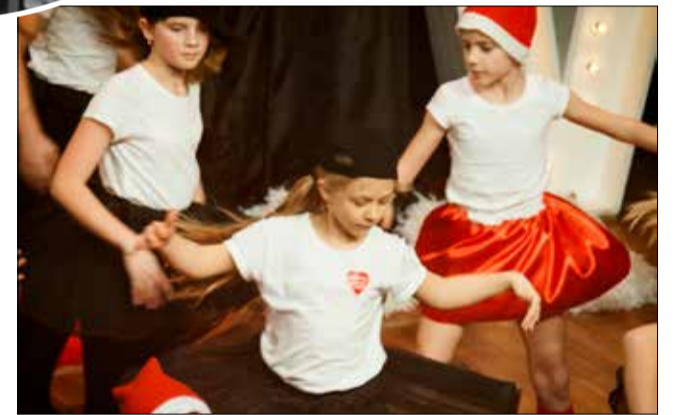
Strzegomskie Centrum Kultury składa serdeczne podziękowanie wspaniałej strzegomskiej młodzieży - wolontariuszom, licytującym, ale też i darczyńcom.

Napisana z niezwykłą prostotą, intensywna i wciągająca historia przykuwa uwagę już od pierwszych stron