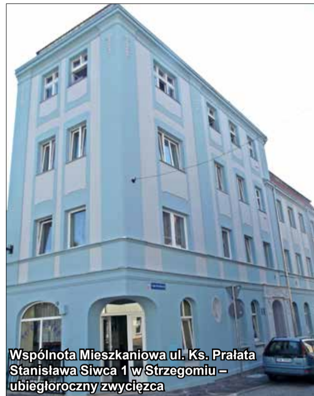
Wspólnota Mieszkaniowa ul. Ks. Prałata Stanisława Siwca 1 w Strzegomiu – ubiegłoroczny zwycięzca

Zgłoszenia do udziału w konkursie mogą składać: właściciele, współwłaściciele, zarządy lub zarządcy budynków posiadający budynki nie wpisane do rejestru zabytków, które ze względu na swoje położenie, architekturę albo historię, stanowią cenne obiekty kultury materialnej gminy Strzegom, warte wyróżnienia, upowszechnienia i ochrony.