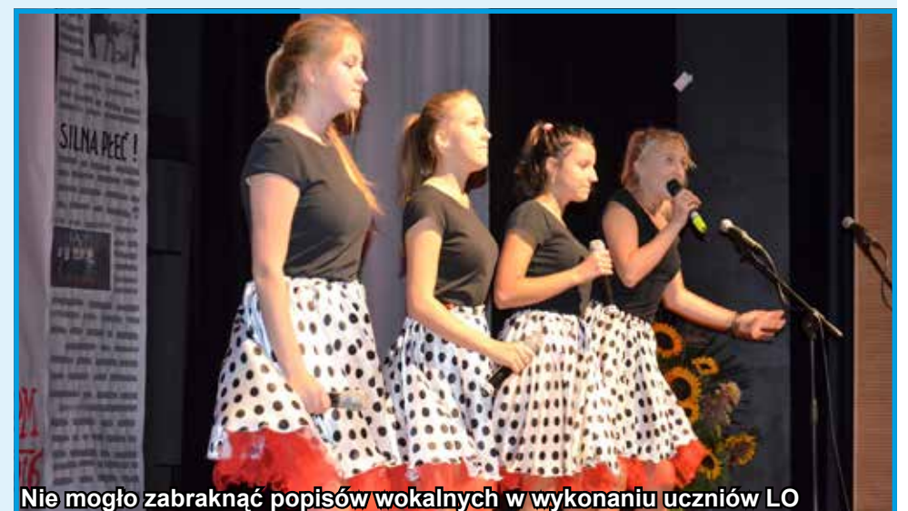
Nie mogło zabraknąć popisów wokalnych w wykonaniu uczniów LO