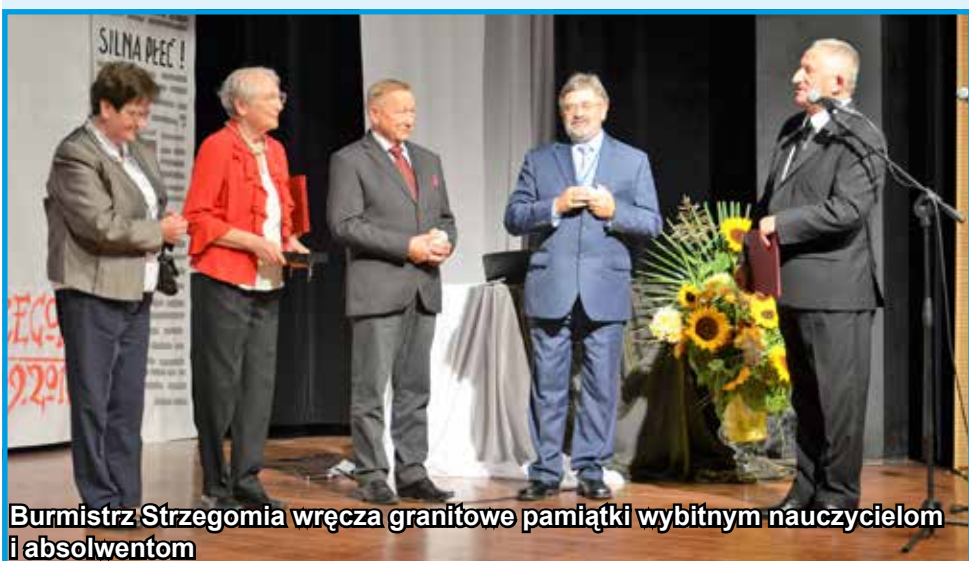
Burmistrz Strzegomia wręcza granitowe pamiątki wybitnym nauczycielom i absolwentom