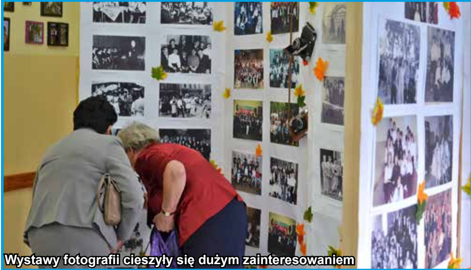
Wystawy fotografii cieszyły się dużym zainteresowaniem

Po długich i intensywnych przygotowaniach, grono pedagogiczne i uczniowie Liceum Ogólnokształcącego w Strzegomiu zorganizowali w ostatnią sobotę (tj. 24 września br.) VI Zjazd Absolwentów. Uroczystości miały podwyższoną rangę, bowiem szkoła obchodziła jednocześnie jubileusz 55-lecia swojego istnienia. W zjeździe udział wzięło ponad 200 absolwentów. Organizatorzy przygotowali dla absolwentów niezwykle przeżycia w gronie swoich koleżanek, kolegów i nauczycieli. Zapraszamy do obejrzenia fotogalerii z tego wspaniałego spotkania. Więcej zdjęć na stronie www.strzegom.pl i na witrynie szkoły.