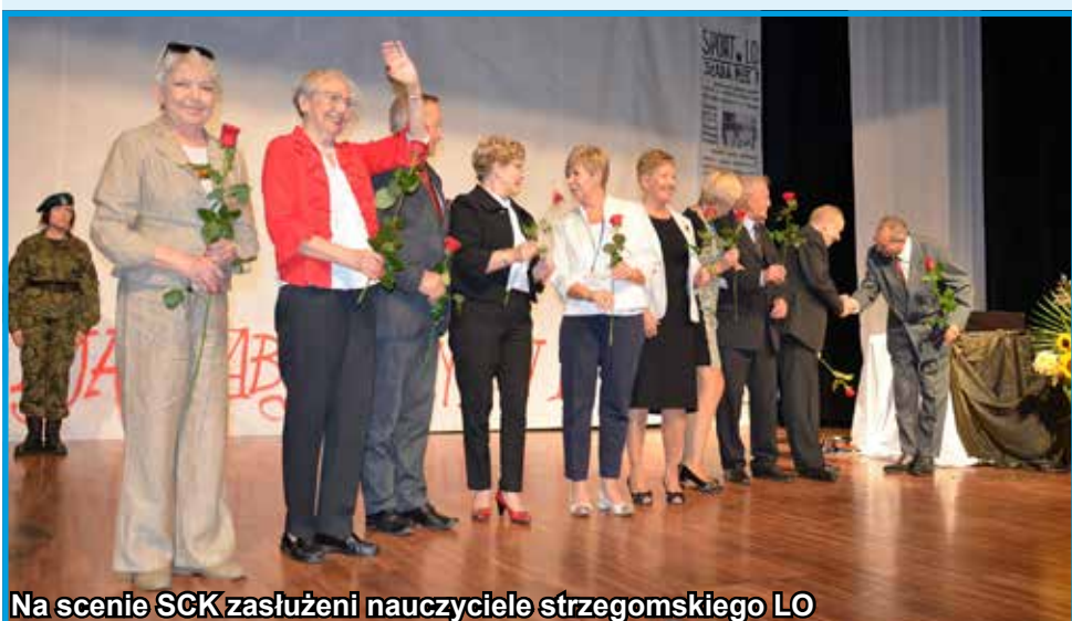
Na scenie SCK zasłużeni nauczyciele strzegomskiego LO