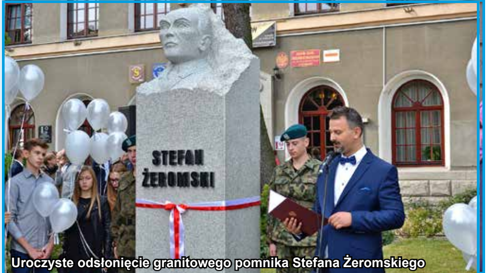
Uroczyste odsłonięcie granitowego pomnika Stefana Żeromskiego