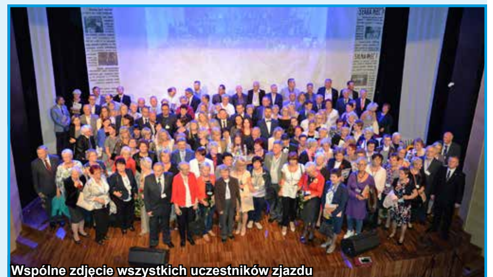
Wspólne zdjęcie wszystkich uczestników zjazdu