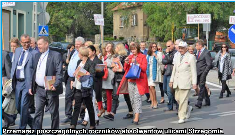
Przemarsz poszczególnych roczników absolwentów ulicami Strzegomia