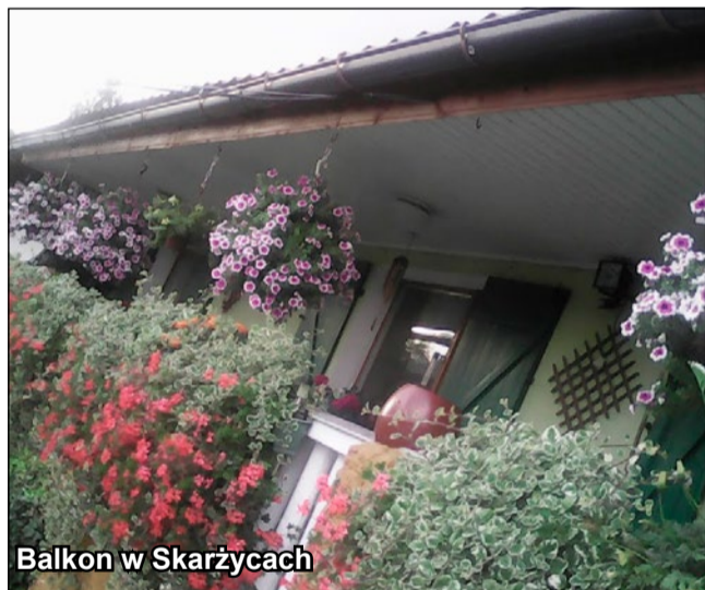
Balkon w Skarżycach

zamieszkałego przy ulicy Szarych Szeregów w Strzegomiu oraz zdjęcie tarasu, nadesłane przez mieszkańca Skarżyc.