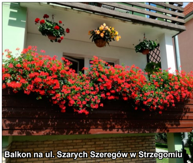
Balkon na ul. Szarych Szeregów w Strzegomiu