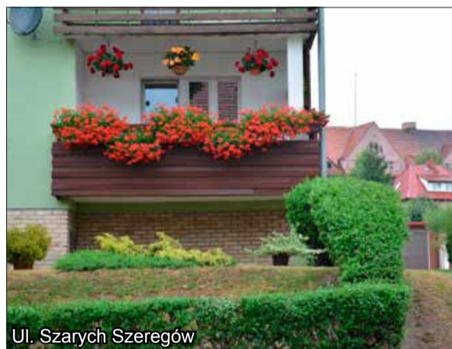
Ul. Szarych Szeregów

adres biuletyn@strzegom.pl . Opublikujemy je w „Gminnych Wiadomościach Strzegom”. Dziś prezentujemy pierwszy balkon z urokliwymi kwiatami dostrzeżony na ulicy Szarych Szeregów w Strzegomiu.