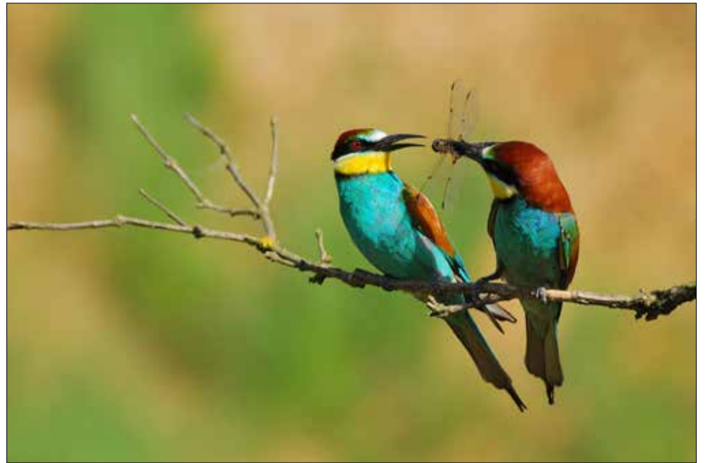
ZPFPP, który powstał w 1995 roku, skupia amatorów i zawodowców, ale przede wszystkim pasjonatów. Związek należy do Międzynarodowej Federacji Fotografii Przyrodniczej (IFWP).

Po wakacjach zespół znów odwiedzi podopiecznych strzegomskiego domu seniora. Będzie się działo!