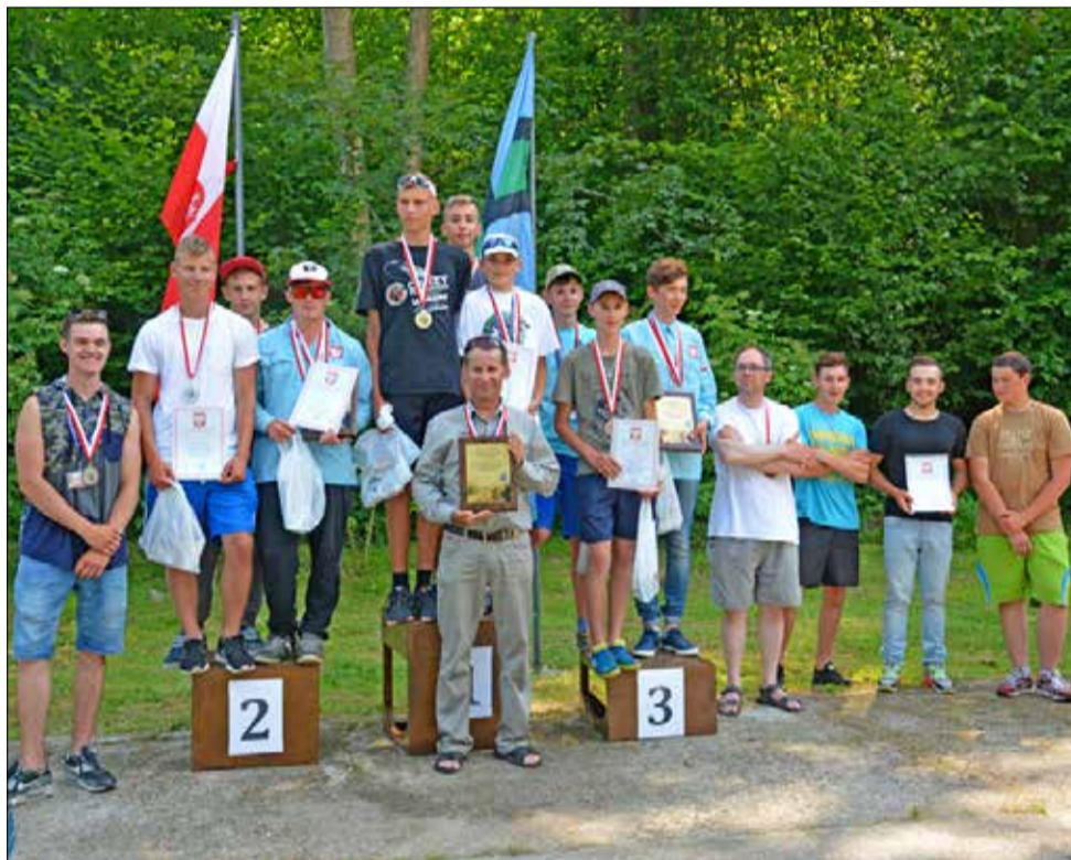
Nasz zespół wcześniej wywalczył mistrzostwo okręgu Wałbrzych, co dało możliwość startu w Mistrzostwach Polski Juniorów.