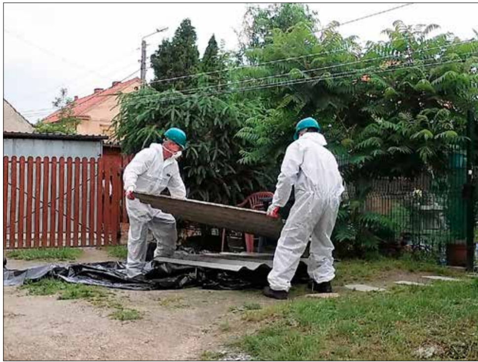
Usunięcie wyrobów azbestowych nastąpi z Żelazowa, Żółkiewki, Wieśnicy, Strzegomia, Olszan, Modłęcina, Międzyrzecza, Kostrzy, Jaroszowa, Goczalkowa i Bartosówka.