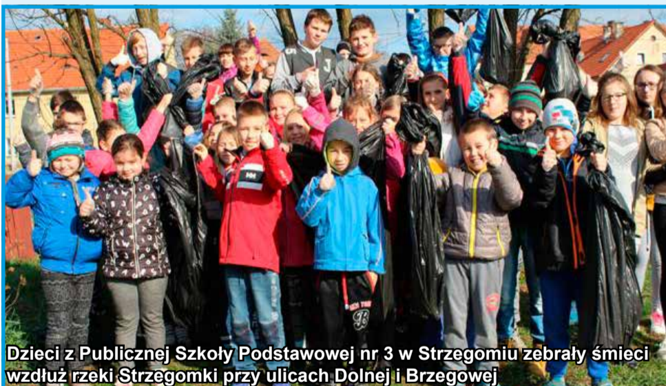
Dzieci z Publicznej Szkoły Podstawowej nr 3 w Strzegomiu zebrały śmieci wzdłuż rzeki Strzegomki przy ulicach Dolnej i Brzegowej