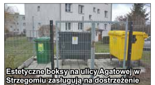
Estetyczne boksy na ulicy Agatowej w Strzegomiu zasługują na dostrzeżenie