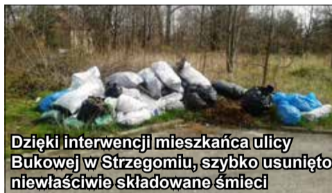
Dzięki interwencji mieszkańca ulicy Bukowej w Strzegomiu, szybko usunięto niewłaściwie składowane śmieci

Wiosna jest okresem sprzyjającym remontom i porządkom w domach, mieszkaniach oraz przydomowych ogródkach.