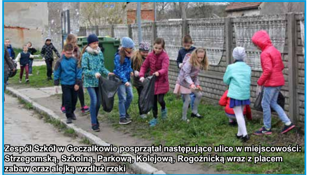
Zespół Szkół w Goczałkowie posprzątał następujące ulice w miejscowości: Strzegomską, Szkolną, Parkową, Kolejową, Rogoźnicką wraz z placem zabaw oraz alejką wzdłuż rzeki