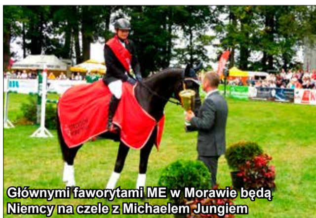
Głównymi faworytami ME w Morawie będą Niemcy na czele z Michaeliem Jungiem

Miasto Strzegom już od 14 lat organizuje zawody międzynarodowe – zawody z cyklu Pucharu Świata, Pucharu Narodów, Młodzieżowe Mistrzostwa Europy i Finał Pucharu Świata oraz wiele innych imprez międzynarodowych. Dzięki doskonałej renomie, po kilku latach intensywnej promocji, w czerwcu 2014 r. Międzynarodowa Federacja Jeździecka przyznała prawa do organizacji Mistrzostw Europy w WKKW Strzegomowi.