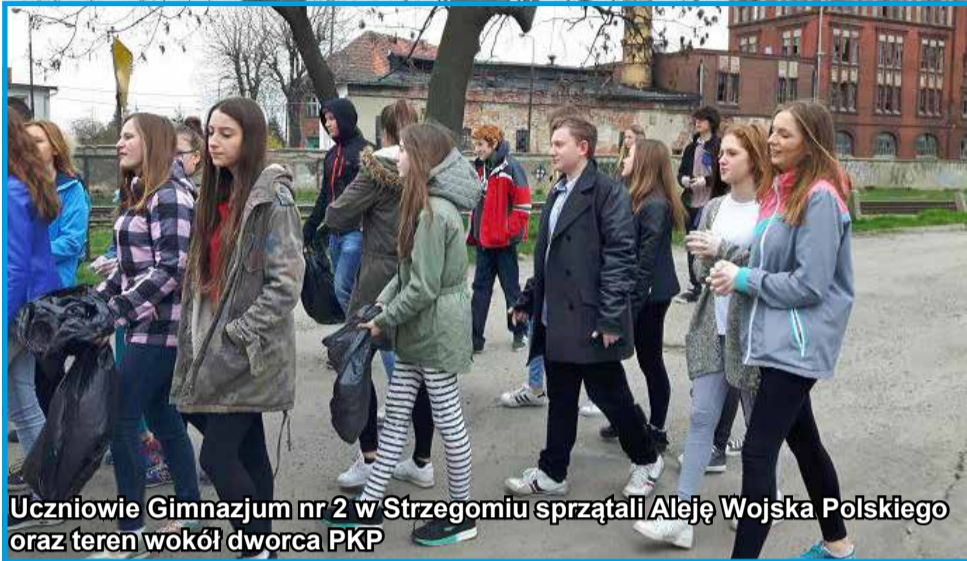
Uczniowie Gimnazjum nr 2 w Strzegomiu sprząkali Aleję Wojska Polskiego oraz teren wokół dworca PKP

Tradycją stało się, że w gminie Strzegom w okresie wiosennym prowadzone są porządki, w które angażują się mieszkańcy, uczniowie szkół i członkowie organizacji pozarządowych. Wszystko to w myśl zasady, że o miejsca, które są dla nas ważne, należy dbać. Zapraszamy do zapoznania się z fotorelacją z tegorocznej akcji.