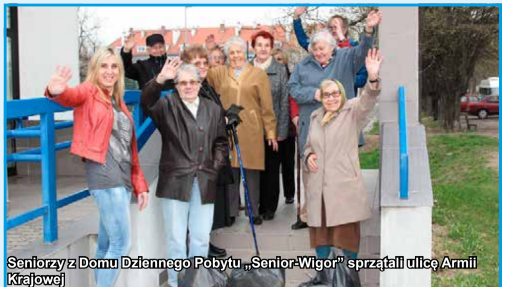
Seniorzy z Domu Dziennego Pobytu „Senior-Wigor” sprząkali ulicę Armii Krajowej