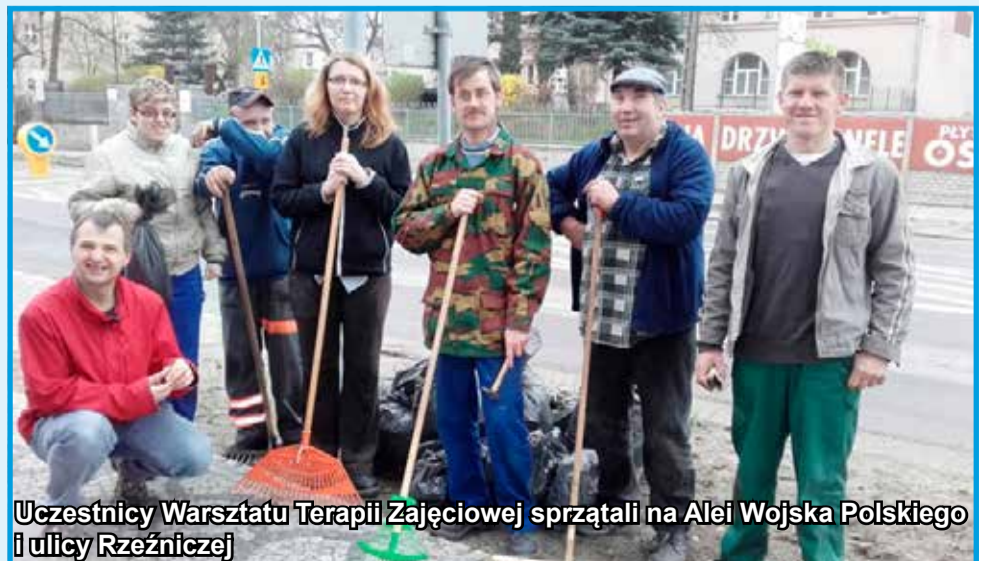
Uczestnicy Warsztatu Terapii Zajęciowej sprząkali na Alei Wojska Polskiego i ulicy Rzeźniczej