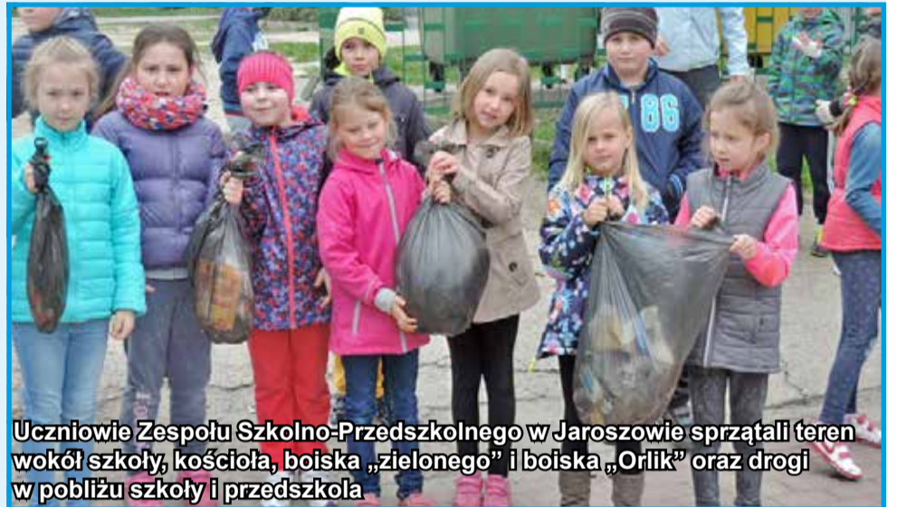
Uczniowie Zespołu Szkolno-Przedszkolnego w Jaroszowie sprząkali teren wokół szkoły, kościoła, boiska „zielonego” i boiska „Orlik” oraz drogi w pobliżu szkoły i przedszkola