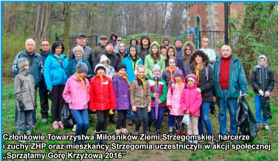
Członkowie Towarzystwa Miłośników Ziemi Strzegomskiej, harcerze i zuchy ZHP oraz mieszkańcy Strzegomia uczestniczyli w akcji społecznej „Sprzątamy Górę Krzyżową 2016”