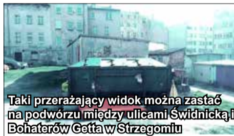
Taki przerażający widok można zastać na podwórzu między ulicami Świdnicką i Bohaterów Getta w Strzegomiu

zobowiązani są do zbierania i do umieszczania na własny koszt, szkła w ogólnodostępnych pojemnikach, wystawiania w czasie kwartalnego odbierania nieruchomości nie wcześniej niż 24 godziny przed terminem odbioru - dodaje Jolanta Dryja.