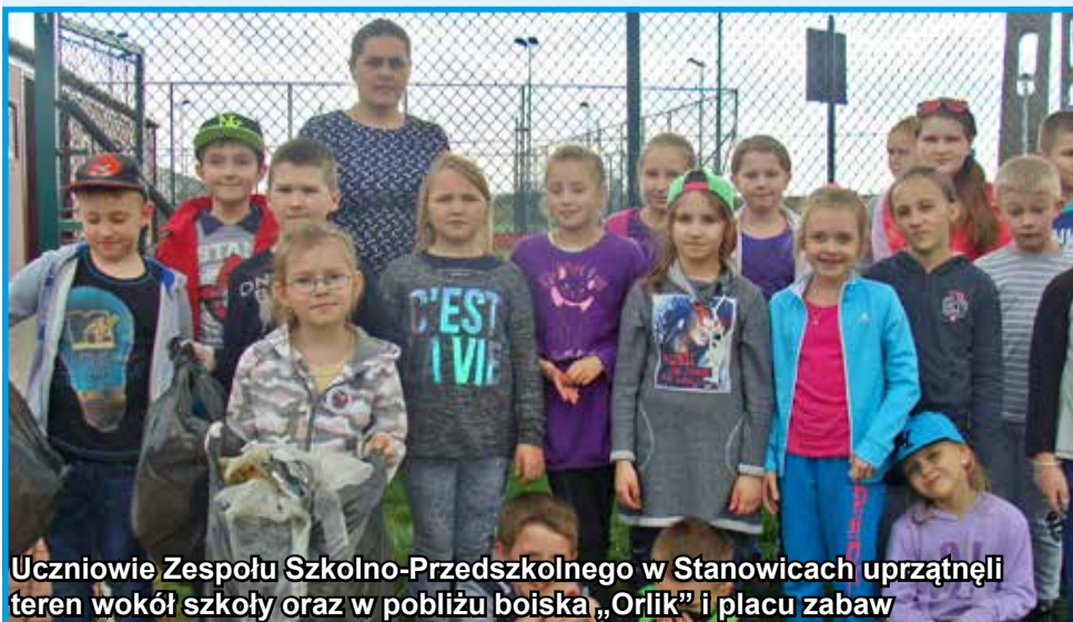
Uczniowie Zespołu Szkolno-Przedszkolnego w Stanowicach uprzątnęli teren wokół szkoły oraz w pobliżu boiska „Orlik” i placu zabaw