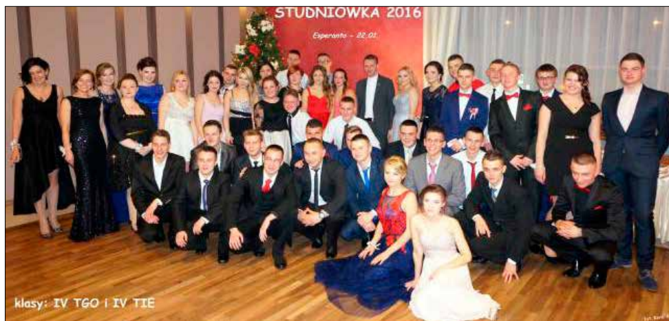
klasy: IV TGO i IV TIE

Dyrektorzy szkół oraz zaproszeni goście życzyli młodzieży pomyślnie zdanych egzaminów maturalnych,