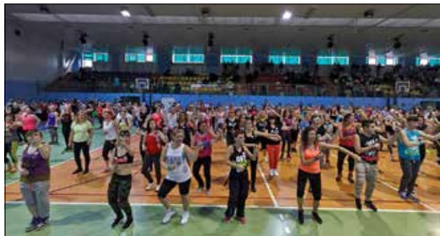
Organizatorzy III Strzegomskiego Maratonu Zumba Love serdecznie dziękują wszystkim uczestnikom i ludziom dobrej woli, którzy zaangażowali się w tę imprezę.