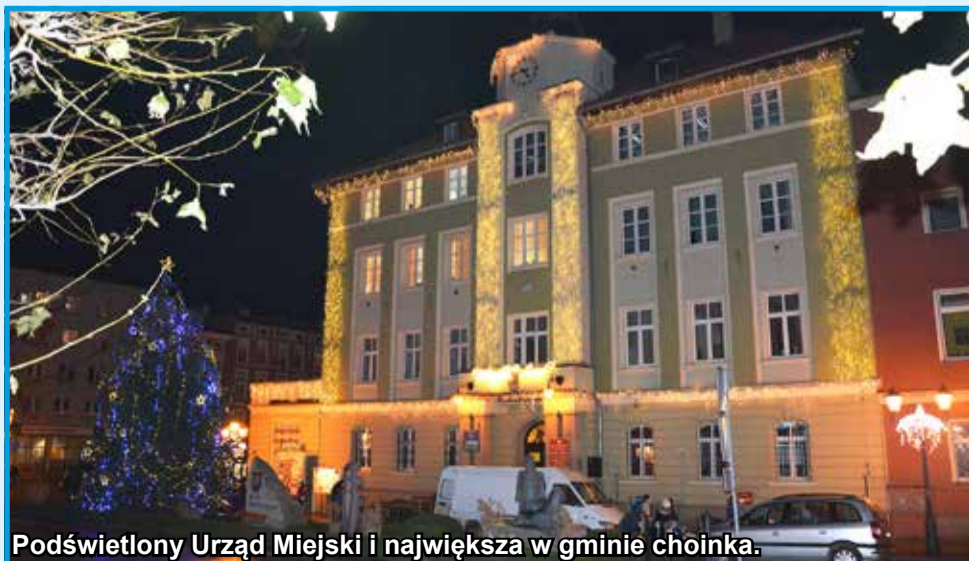
Podświetlony Urząd Miejski i największa w gminie choinka.