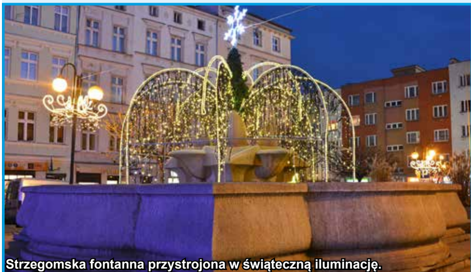
Strzegomska fontanna przystrojona w świąteczną iluminację.