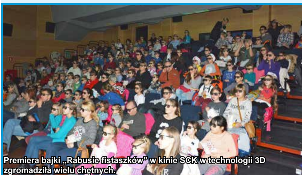
Premiera bajki „Rabusię fistaszków” w kinie SCK w technologii 3D zgromadziła wielu chętnych.