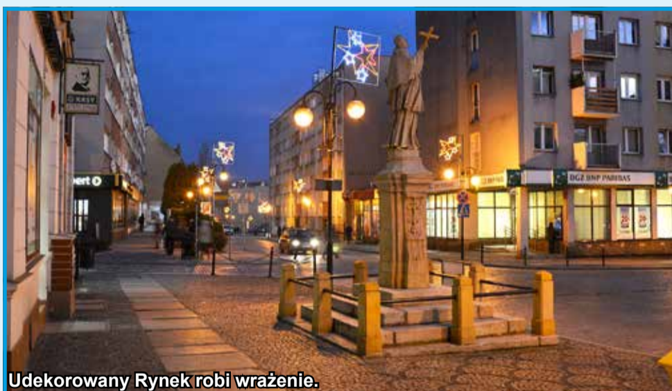
Udekorowany Rynek robi wrażenie.