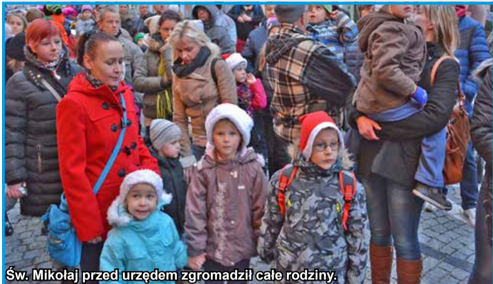
Św. Mikołaj przed urzędem zgromadził całe rodziny.

Święta Bożego Narodzenia to jeden z najbardziej radosnych okresów w ciągu roku. Od kilkunastu dni można już wyczuć świąteczną atmosferę. Św. Mikołaj wręcza wszystkim prezenty, miasto jest pięknie przystrojone, najmłodszy robią sobie zdjęcia przy śnieżnej karecie, która stoi na strzegomskim Rynku. Poniżej przedstawiamy zdjęcia ukazujące świąteczny klimat w Strzegomiu.