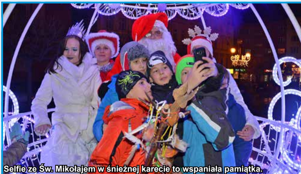
Selfie ze Św. Mikołajem w śnieżnej karecie to wspaniała pamiątka.