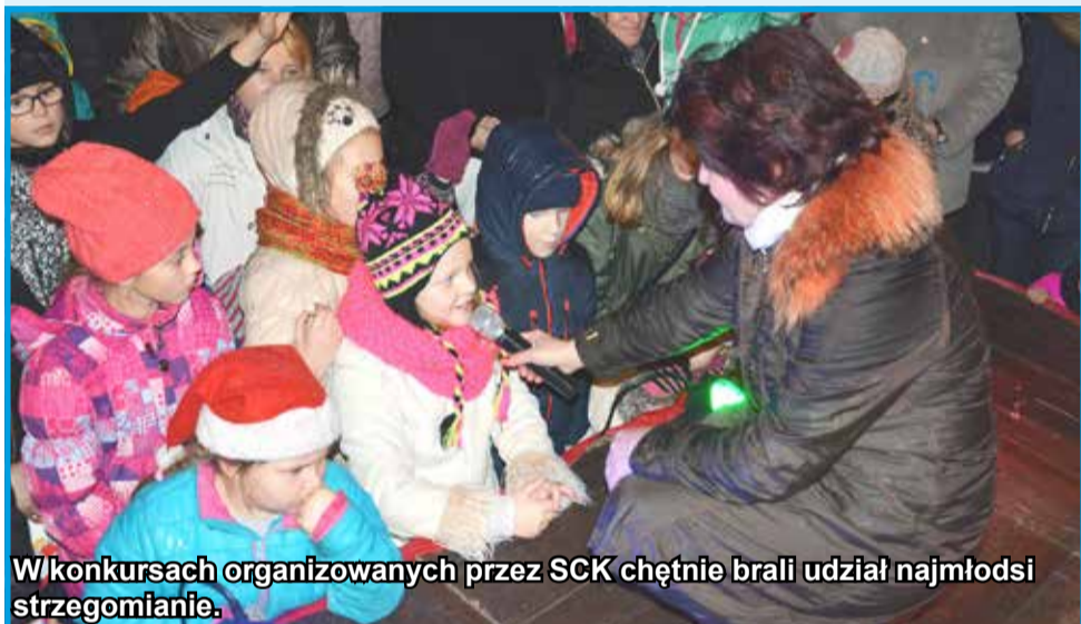
W konkursach organizowanych przez SCK chętnie brali udział najmłodszy strzegomianie.