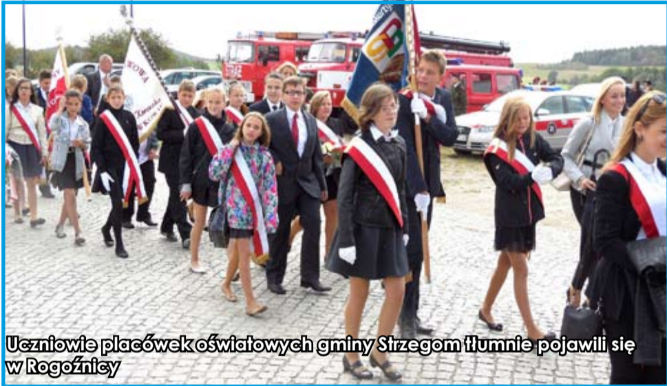
Uczniowie placówek oświatowych gminy Strzegom tłumnie pojawili się w Rogoźnicy

Obchody 76. rocznicy agresji Niemiec na Polskę już za nami. Wydarzenie, które tradycyjnie odbywa się w pierwszą niedzielę września, zgromadziło w Rogoźnicy przedstawicieli duchowieństwa, władzy państwowej i samorządowej, członków różnych organizacji i stowarzyszeń, delegacji placówek oświatowych i przede wszystkim żyjących jeszcze więźniów i ich najbliższe rodziny. Mimo niekorzystnej aury, mieszkańcy gminy Strzegom pamiętali o kolejnej rocznicy wybuchu II wojny światowej, zdając egzamin z patriotyzmu na szóstkę!