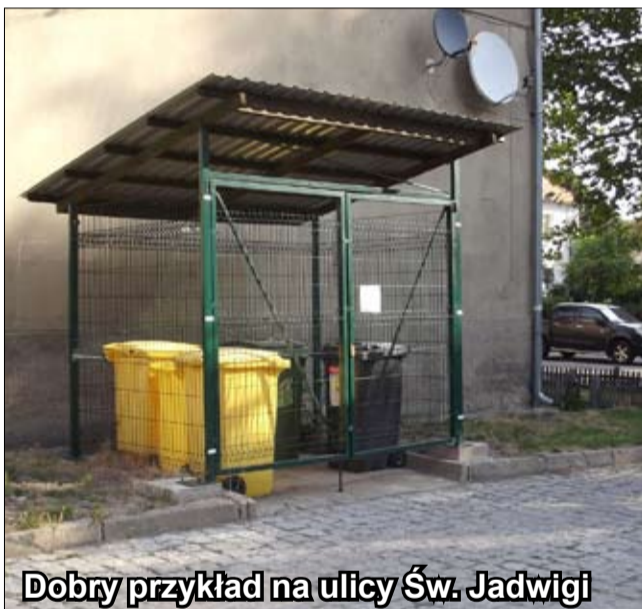
Dobry przykład na ulicy Św. Jadwigi