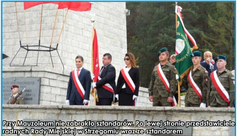
Przy Mauzoleum nie zabrakło sztandarów. Po lewej stronie przedstawiciele radnych Rady Miejskiej w Strzegomiu wraz ze sztandarem