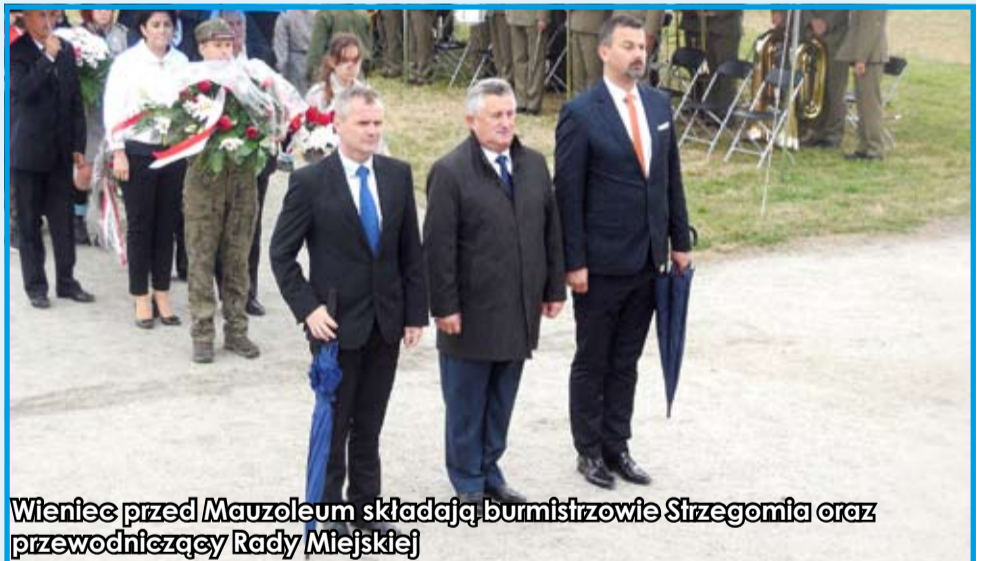
Wieniec przed Mauzoleum składają burmistrzowie Strzegomia oraz przewodniczący Rady Miejskiej