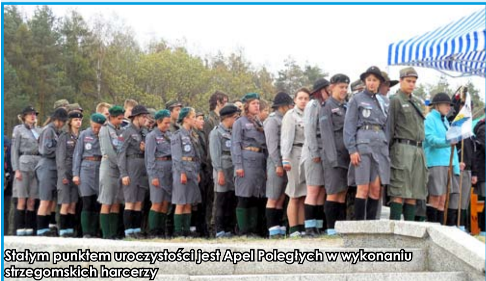
Stałym punktem uroczystości jest Apel Poległych w wykonaniu strzegomskich harcerzy