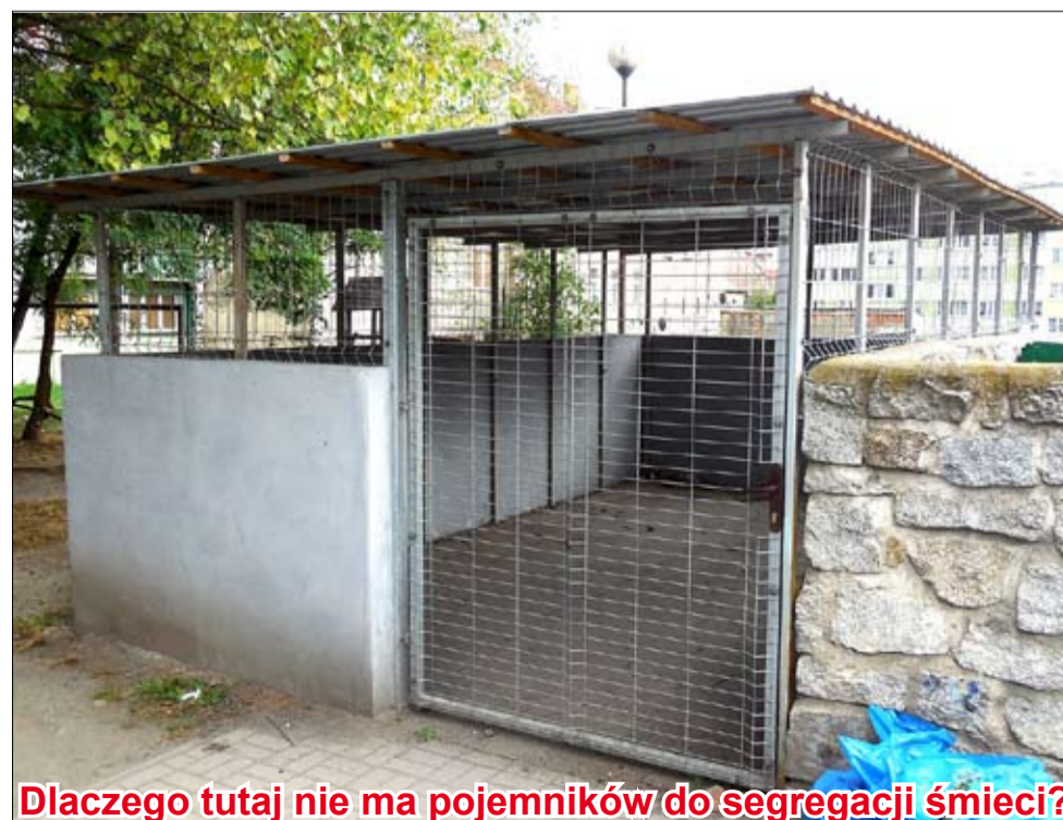
Dlaczego tutaj nie ma pojemników do segregacji śmieci?