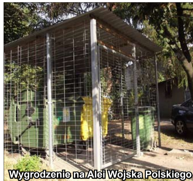
Wygrodzenie na Alei Wojska Polskiego