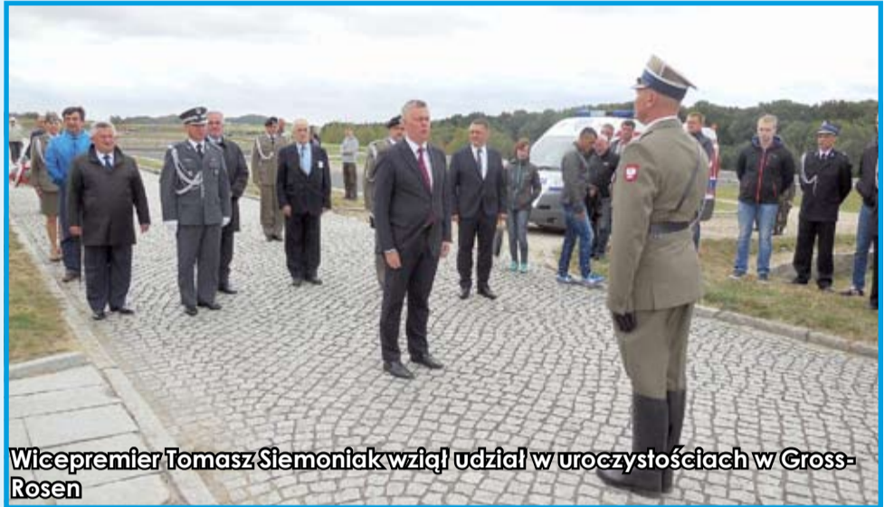
Wicepremier Tomasz Siemoniak wziął udział w uroczystościach w Cross-Rosen