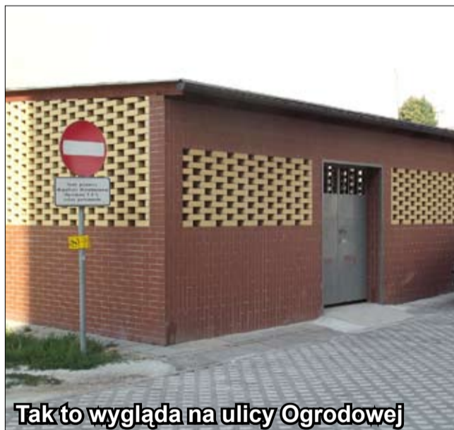
Tak to wygląda na ulicy Ogrodowej

z zachowaniem estetycznego wyglądu. Proponowany wygląd wiaty jest prezentowany na zdjęciach zamieszczonych poniżej. Przypomnijmy też, że budowa wiat podlega wymogowi zgłoszenia do Starostwa Powiatowego w Świdnicy.