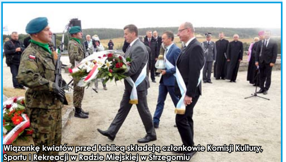
Wiązankę kwiatów przed tablicą składają członkowie Komisji Kultury, Sportu i Rekreacji w Radzie Miejskiej w Strzegomiu