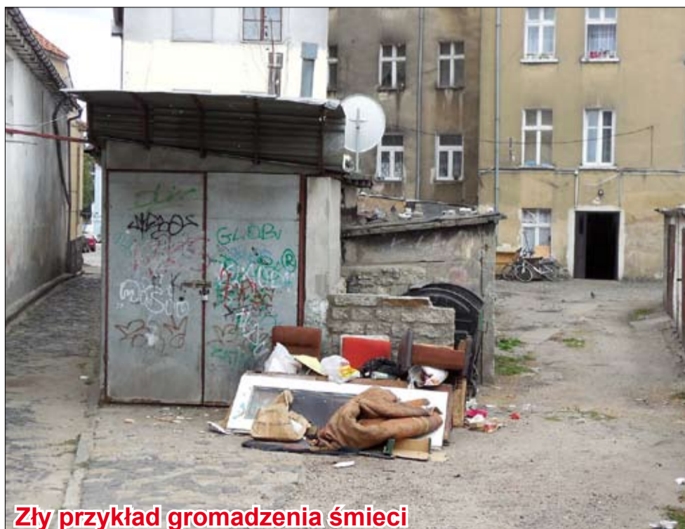
Zły przykład gromadzenia śmieci