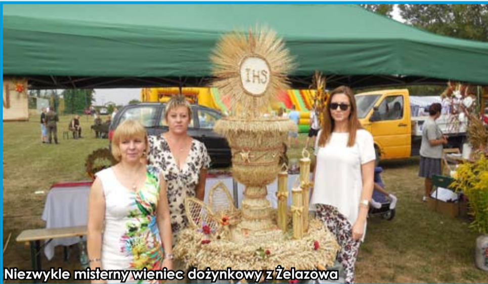
Niezwykle misterny wieniec dożynkowy z Żelazowa