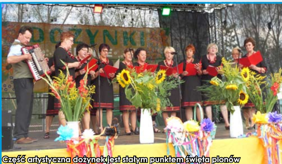
Część artystyczna dożynek jest stałym punktem święta plonów