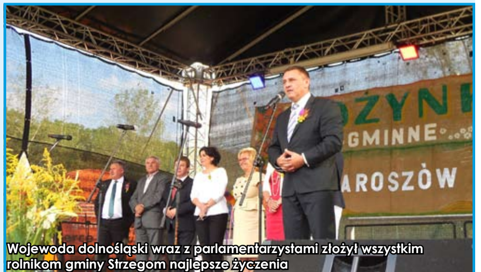
Wojewoda dolnośląski wraz z parlamentarzystami złożył wszystkim rolnikom gminy Strzegom najlepsze życzenia