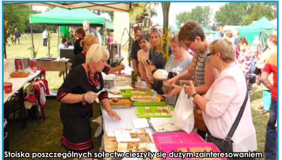
Stoiska poszczególnych sołectw cieszyły się dużym zainteresowaniem