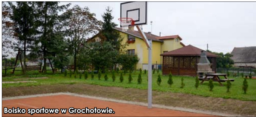
Boisko sportowe w Grochotowie.

Miasto może pochwalić się nowoczesnymi basenami kąpielowymi, lodowiskiem, halą oraz boiskami. Coraz lepiej jest również na wsiach. Sala sportowa w Goczałkowie, Orliki w Jarosowie i Stanowicach, boisko do koszykówki w Grochotowie oraz piękniejsze place zabaw – to wszystko sprawia, że również miesz-