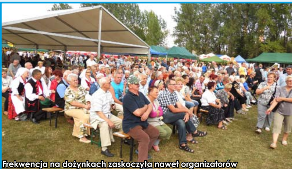
Frekwencja na dożynkach zaskoczyła nawet organizatorów