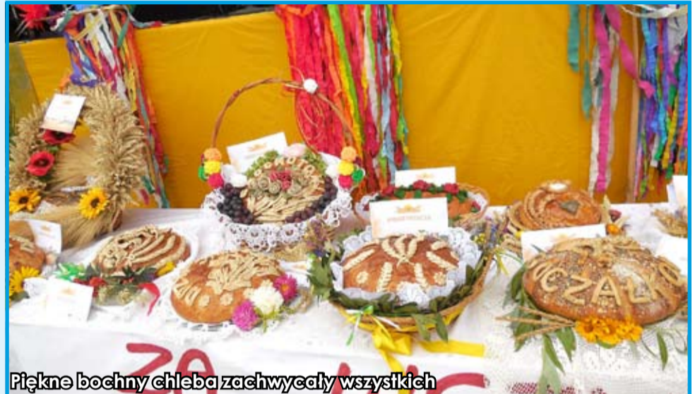
Piękne bochny chleba zachwycaly wszystkich