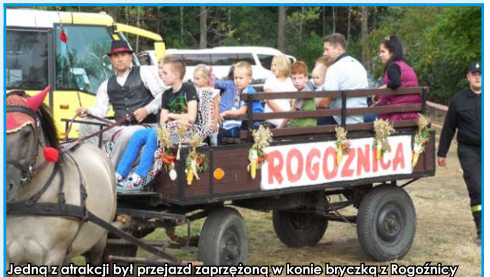
Jedną z atrakcji był przejazd zaprzężoną w konie bryczką z Rogożnicy