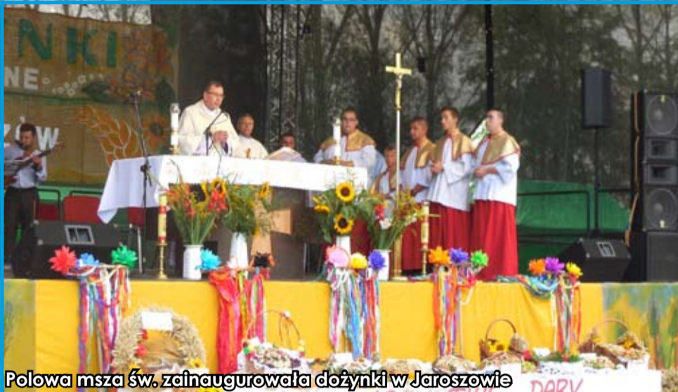
Polowa msza św. zainaugurowała dożynki w Jaroszowie

Przedostatnia niedziela sierpnia (23.08) stała w Jaroszowie pod znakiem Dożynek Gminnych. Trzeba obiektywnie przyznać, że organizatorzy tegorocznego święta plonów: sołectwo Jaroszków i Strzegomskie Centrum Kultury stanęli na wysokości zadania, bowiem dożynki były bardzo udane, o czym świadczą pozytywne opinie postronnych osób i zaproszonych gości. Było radośnie, kolorowo, dopisała publiczność i – co niezwykle ważne – pogoda. Poniżej przedstawiamy zdjęcia z jaroszkowskich dożynek. Przeżyjmy to jeszcze raz!