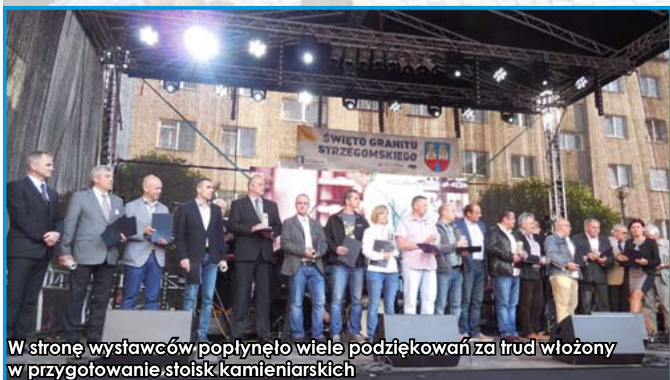
W stronę wystawców popłynęło wiele podziękowań za trud włożony w przygotowanie stoisk kamieniarskich