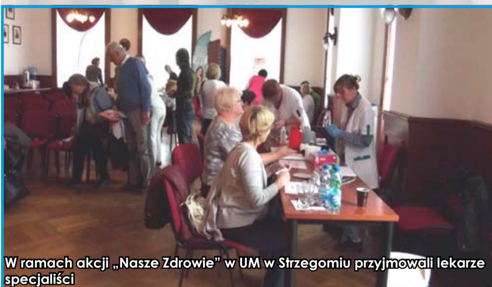
W ramach akcji „Nasze Zdrowie” w UM w Strzegomiu przyjmowali lekarze specjaliści