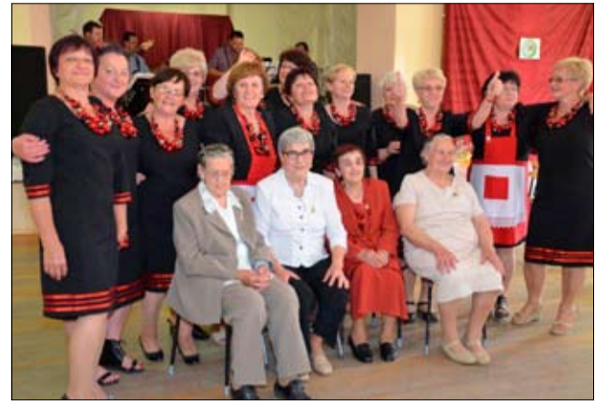
kalnych artystów, kwiaty, słodkie wypieki w formie serca, prezenty, gratulacje i dobre życzenia wypełniły program radosnego podziękowania „Matkom Wsi”.