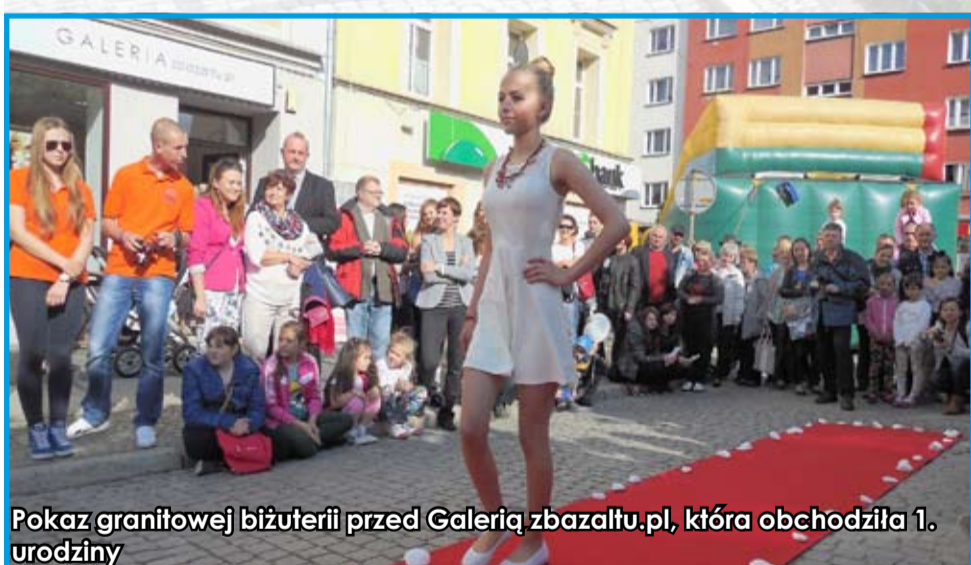
Pokaz granitowej biżuterii przed Galerią zbazaltu.pl, która obchodziła 1. urodziny