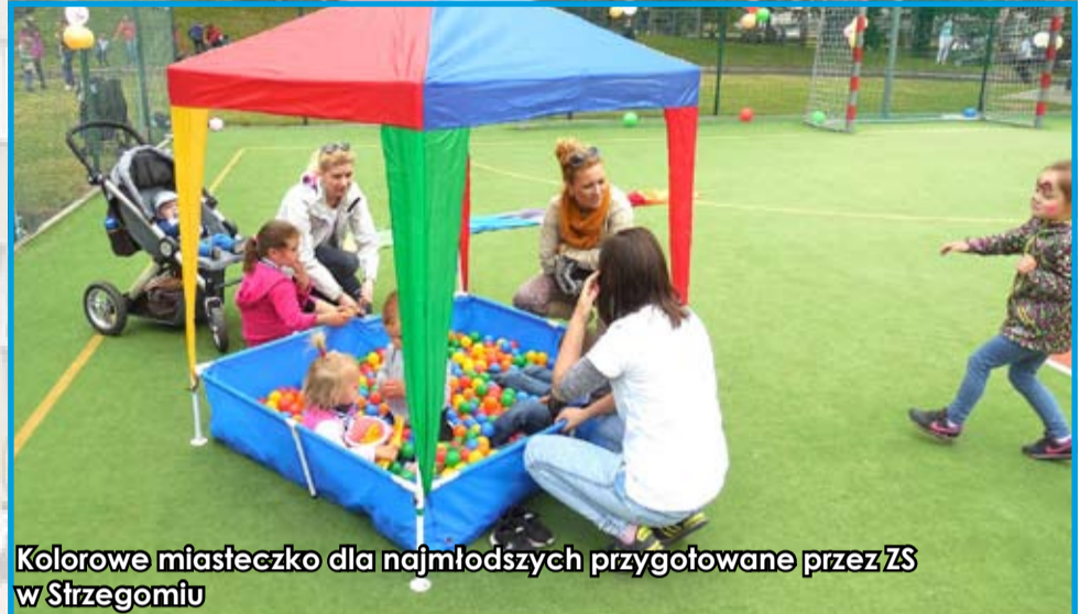
Kolorowe miasteczko dla najmłodszych przygotowane przez ZS w Strzegomiu