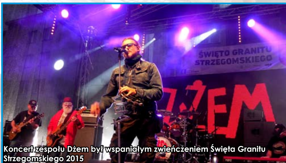
Koncert zespołu Dżem był wspaniałym zwieńczeniem Święta Granitu Strzegomskiego 2015