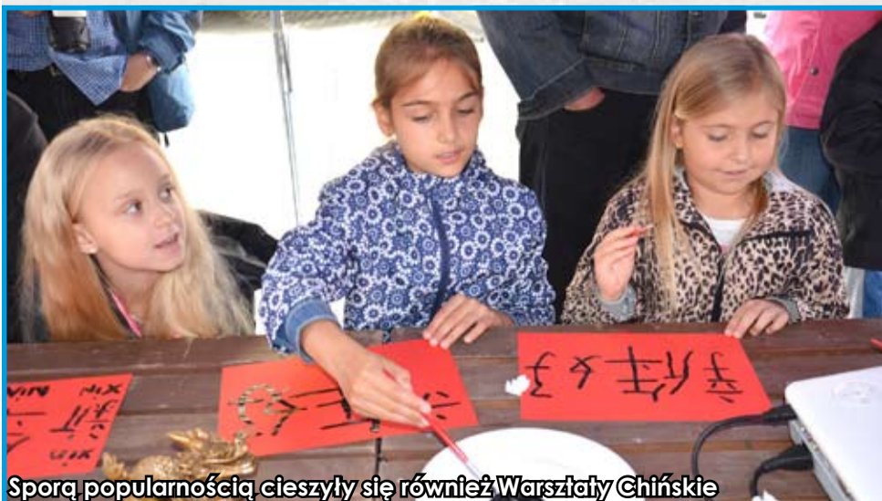
Sporą popularnością cieszyły się również Warsztaty Chińskie