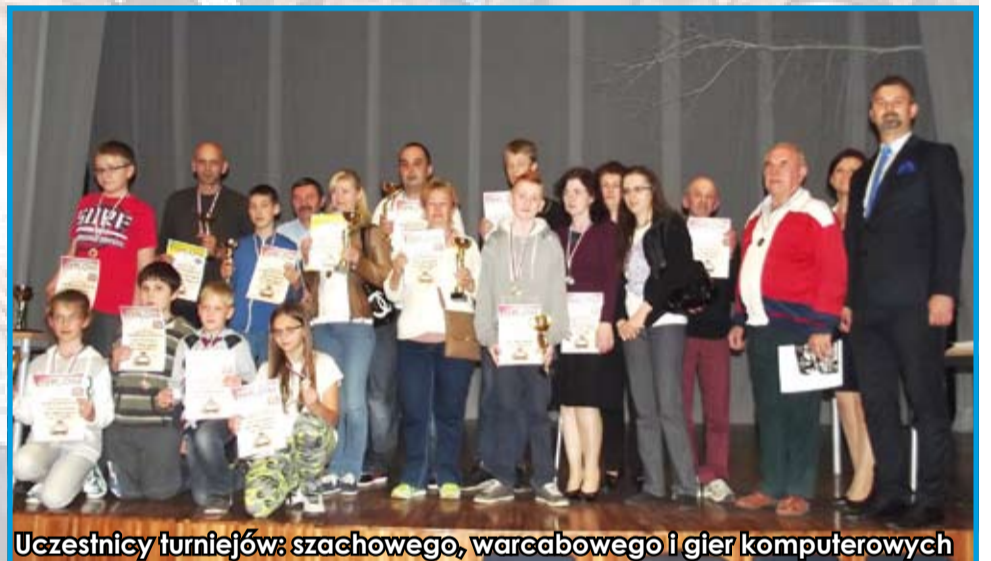
Uczestnicy turniejów: szachowego, warszawowego i gier komputerowych