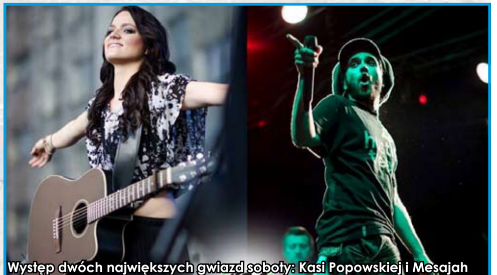
Występ dwóch największych gwiazd soboty: Kasi Popowskiej i Mesajah