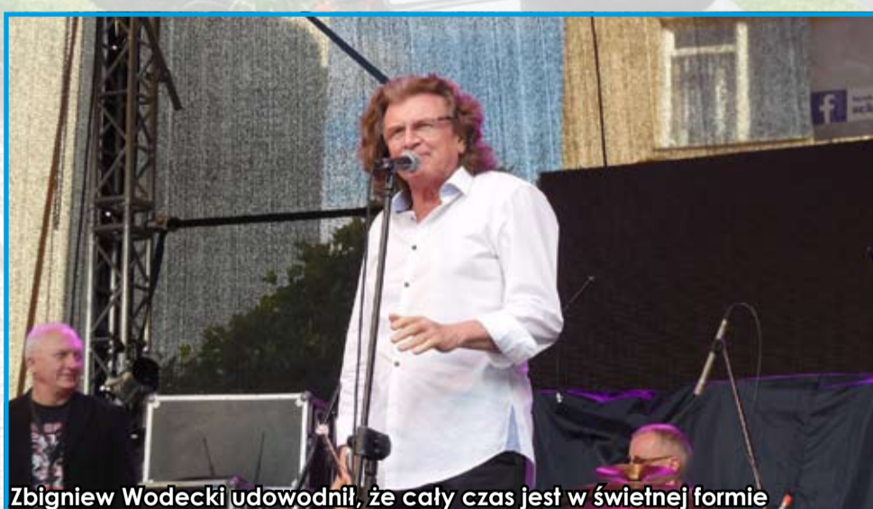
Zbigniew Wodecki udowodnił, że cały czas jest w świetnej formie