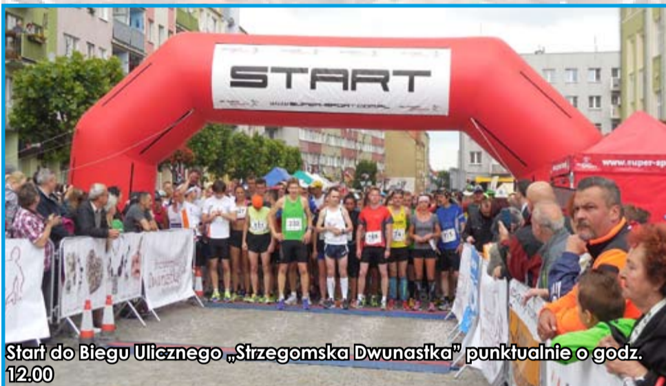
Start do Biegu Ulicznego „Strzegomska Dwunastka” punktualnie o godz. 12.00