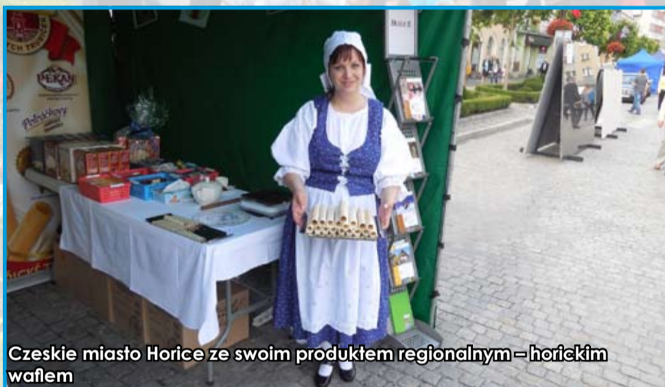
Czeskie miasto Horice ze swoim produktem regionalnym – horickým waflem