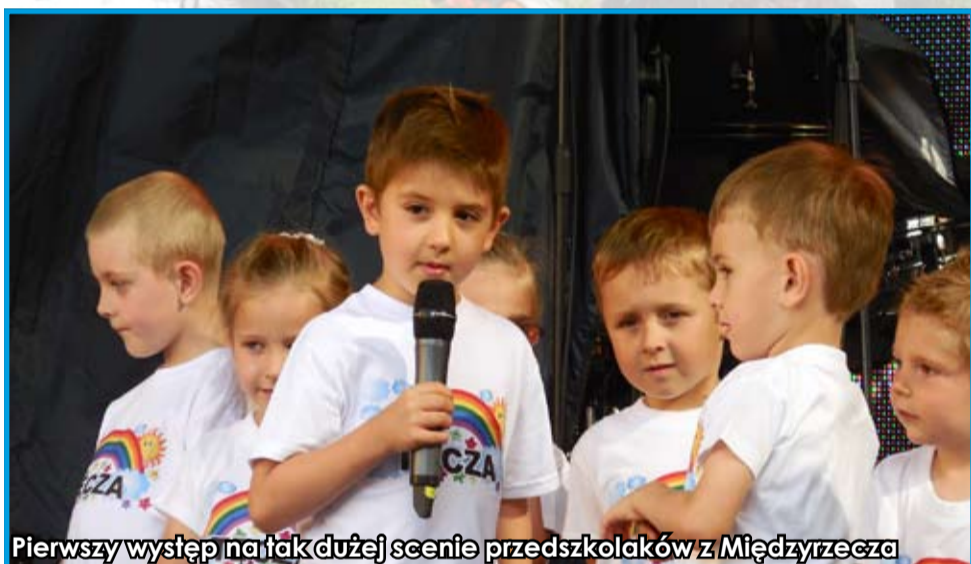
Pierwszy występ na tak dużej scenie przedszkolaków z Międzyrzecza