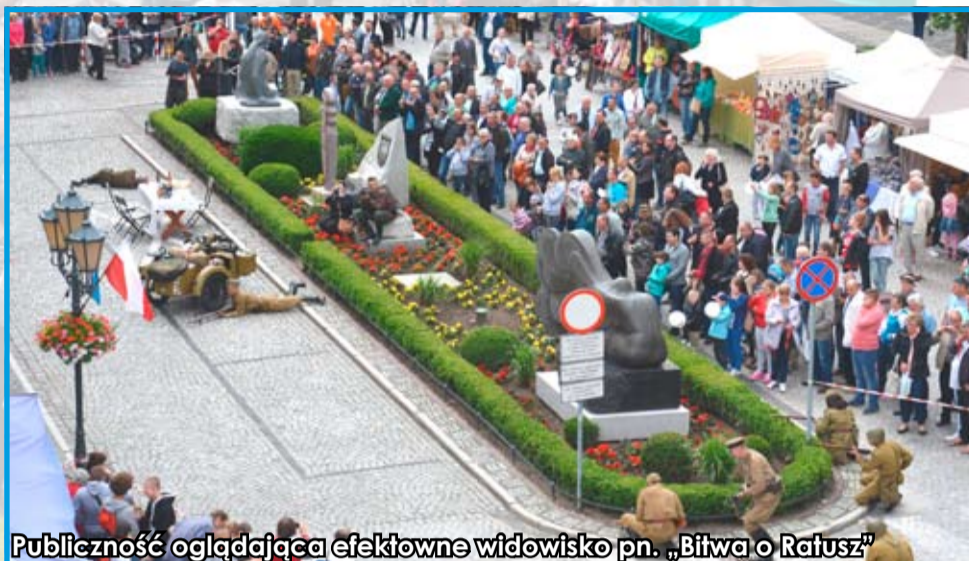
Publiczność oglądająca efektowne widowisko pn. „Bitwa o Ratusz”