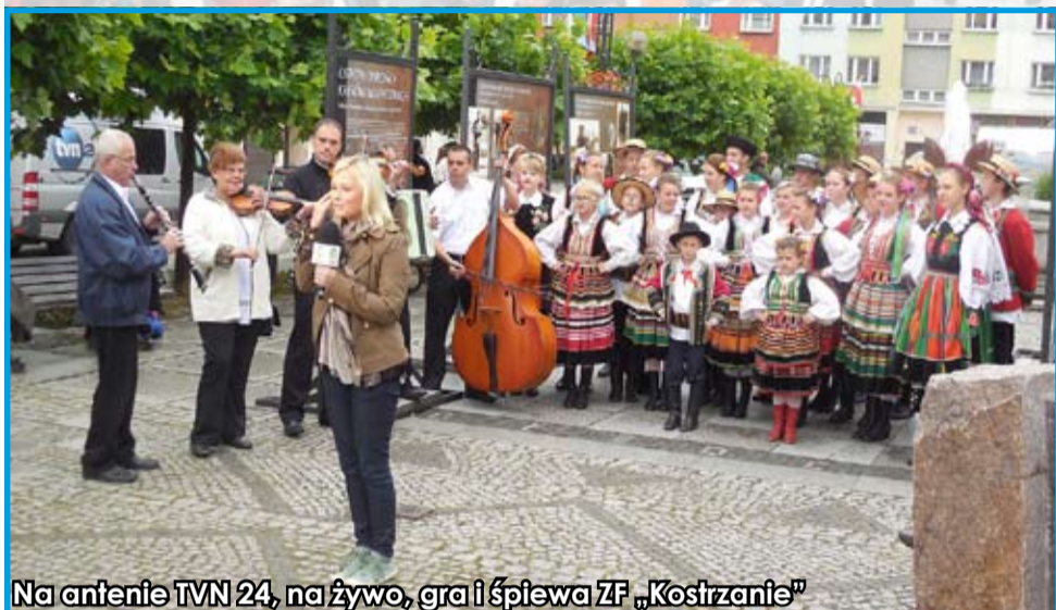
Na antenie TVN 24, na żywo, gra i śpiewa ZF „Kostrzanie”

W niedzielę aura – zwłaszcza od godzin południowych – dopisywała, więc nie było żadnych przeszkód, by cały program przeznaczony na ten dzień zrealizować w 100 procentach. W naszej pamięci zostanie na pewno widowisko „Bitwa o Ratusz” przygotowane przez Grupę Artystyczną „Gorgona”, pokaz granitowej biżuterii oraz koncerty Zbigniewa Wodeckiego i legendarnego zespołu Dżem.