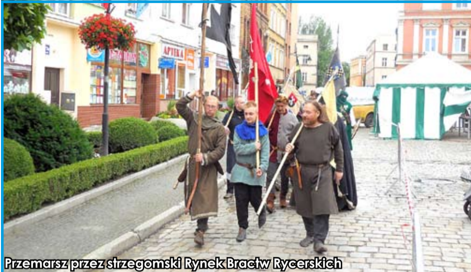
Przemarsz przez strzegomski Rynek Bractw Rycerskich