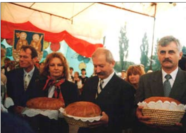
Przekazanie bochnów chleba podczas Dożynek Krajowych, które odbyły się w 1998 roku w Strzegomiu.

Migawki z kadencji • Migawki z kadencji • Migawki z kadencji • Migawki z kadencji