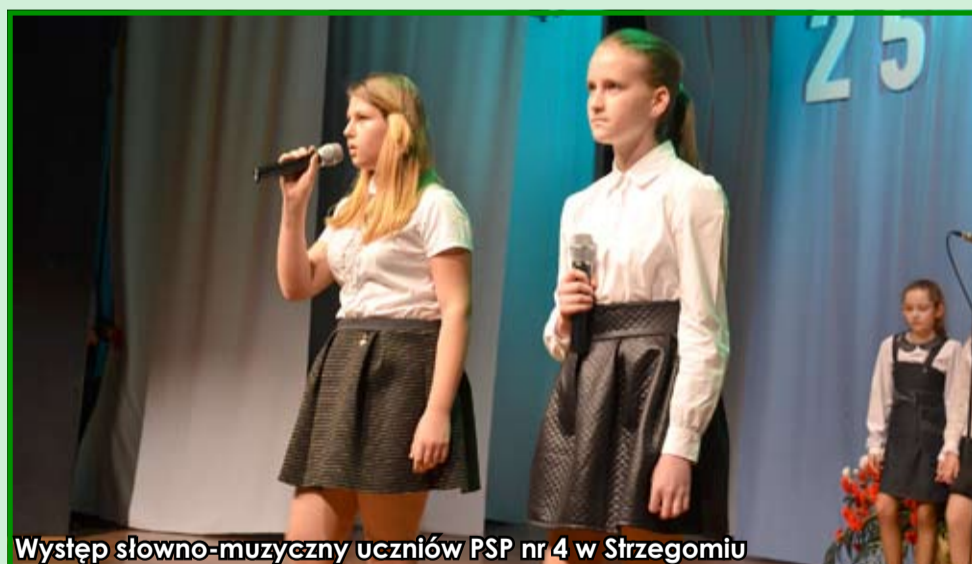
Występ słowno-muzyczny uczniów PSP nr 4 w Strzegomiu