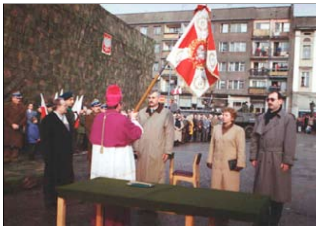
Uroczyste przekazanie sztandaru jednostce wojskowej w Strzegomiu.