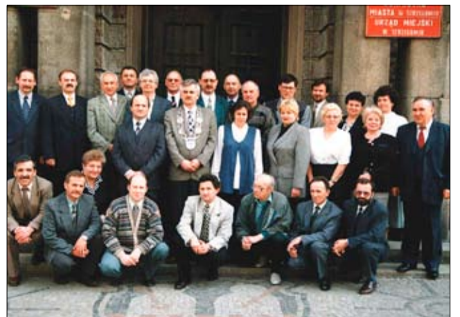
Radni i członkowie Komisji spoza Rady kadencji 1994 - 1998.