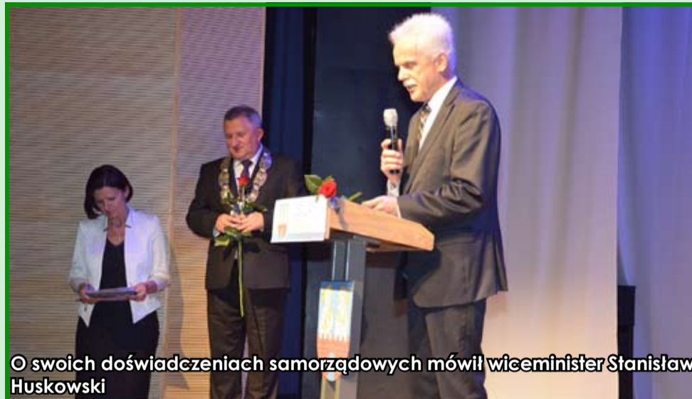
O swoich doświadczeniach samorządowych mówił wiceminister Stanisław Huskowski