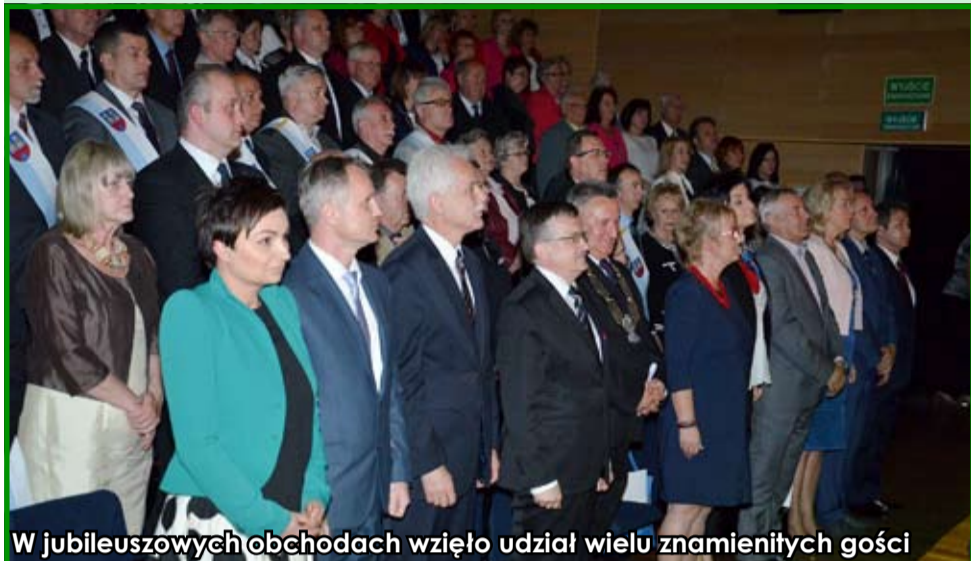
W jubileuszowych obchodach wzięło udział wielu znamienitych gości

25 lat minęło bardzo szybko. Funkcjonowanie samorządu terytorialnego to dobry okres dla rozwoju gminy Strzegom. Nasz lokalny samorząd wybrał właściwe kierunki działań, które służą wszystkim. Decyzje były podejmowane odpowiedzialnie i z myślą o mieszkańcach. Z okazji jubileuszu życzymy strzegomskiemu samorządowi wielu sukcesów, pomysłów oraz owocnej współpracy z mieszkańcami. Zapraszamy do obejrzenia zdjęć z uroczystości 25-lecia samorządu terytorialnego.