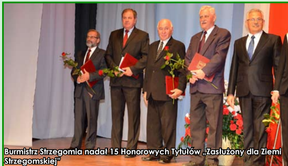
Burmistrz Strzegomia nadał 15 Honorowych Tytułów „Zasłużony dla Ziemi Strzegomskiej”