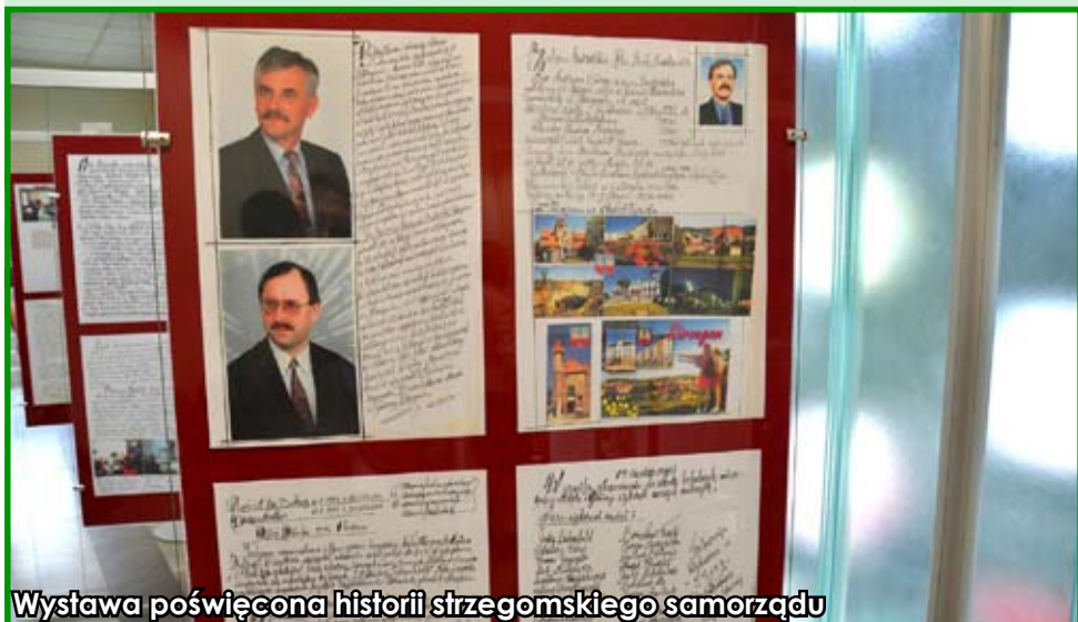
Wystawa poświęcona historii strzegomskiego samorządu