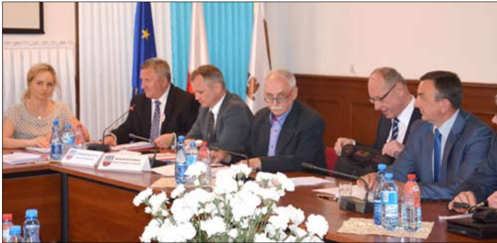
20 czerwca 2015 r. w Strzegomiu zostaną przeprowadzone bezpłatne badania densytometryczne w kierunku osteoporozy, badanie wzroku, słuchu, poziomu cukru we krwi, cholesterolu, wad postawy, analizy składu masy ciała.

Starosta świdnicki zwrócił się z prośbą o udzielenie pomocy finansowej w kwocie 3 tys. złotych Powiatowi Świdnickiemu z przeznaczeniem na wynajęcie osteobusu i wydrukowanie plakatów informujących o akcji bezpłatnych badań i konsultacji specjalistycznych pn. „Nasze Zdrowie”.