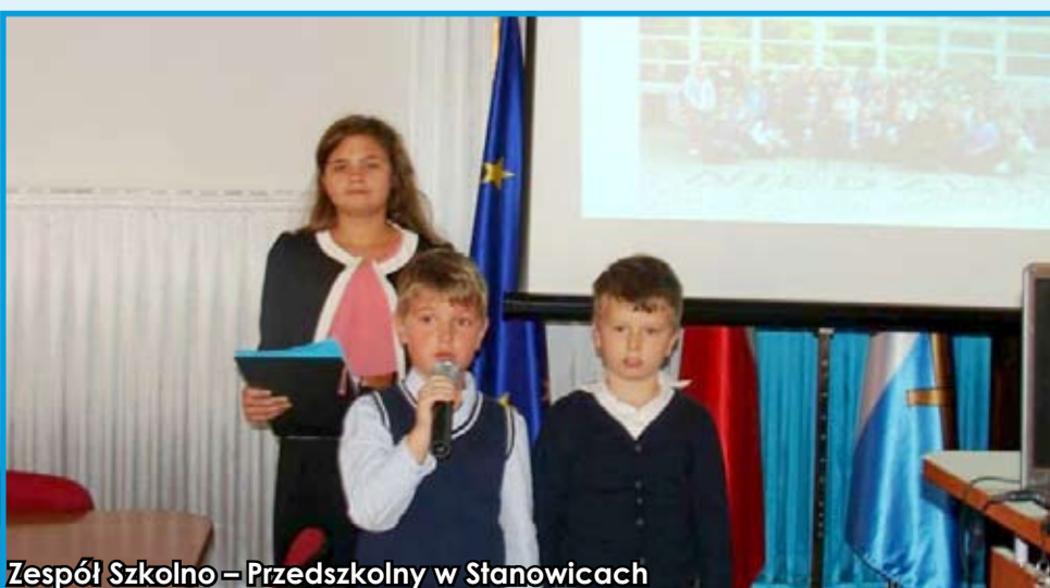
Zespół Szkolno - Przedszkolny w Stanowicach