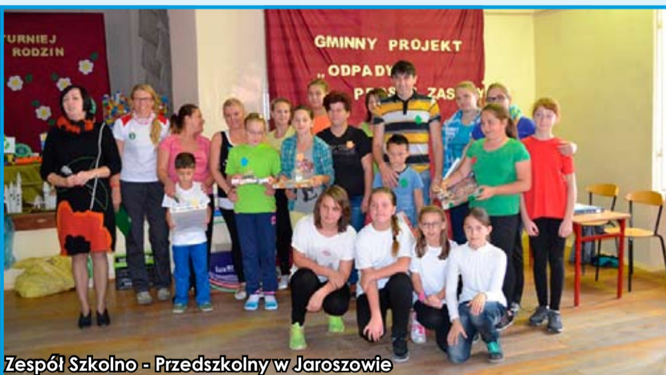
Zespół Szkolno - Przedszkolny w Jaroszowie