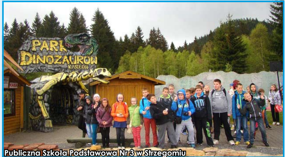
Publiczna Szkoła Podstawowa Nr 3 w Strzegomiu