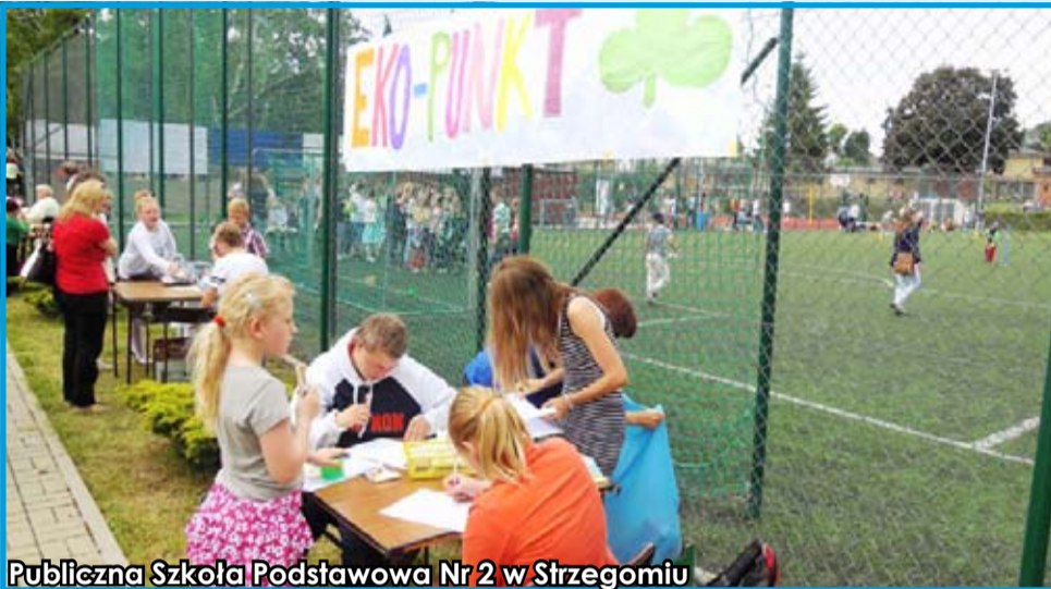
Publiczna Szkoła Podstawowa Nr 2 w Strzegomiu

Placówki oświatowe gminy Strzegom realizują wiele projektów ekologicznych. Jednym z najciekawszych i najważniejszych był projekt pn. „Odpady – proste zasady”, w którym uczestniczyło aż osiem szkół podstawowych. Projekt realizowano w 2014 r. Głównym celem projektu był rozwój świadomości ekologicznej i wykorzystanie bazy służącej powszechnej edukacji na terenie Dolnego Śląska określonej w Programie Edukacji Ekologicznej dla Dolnego Śląska. Celem projektu było również zwiększenie świadomości ekologicznej mieszkańców gminy Strzegom. Uczniowie i ich rodzice poznali zagadnienia związane z odpadami w skali lokalnej i ogólnokrajowej, zdobyli wiedzę na temat segregacji śmieci i ich recyklingu oraz wprowadzania jej w praktyczne działania w codziennym życiu. Wysokość środków poniesionych na realizację projektu to 154 tys. zł. Wysokość dotacji z WFOŚiGW we Wrocławiu wyniosła 76 tys. zł, a wysokość środków wniesionych przez gminę Strzegom – 78 tys. zł.