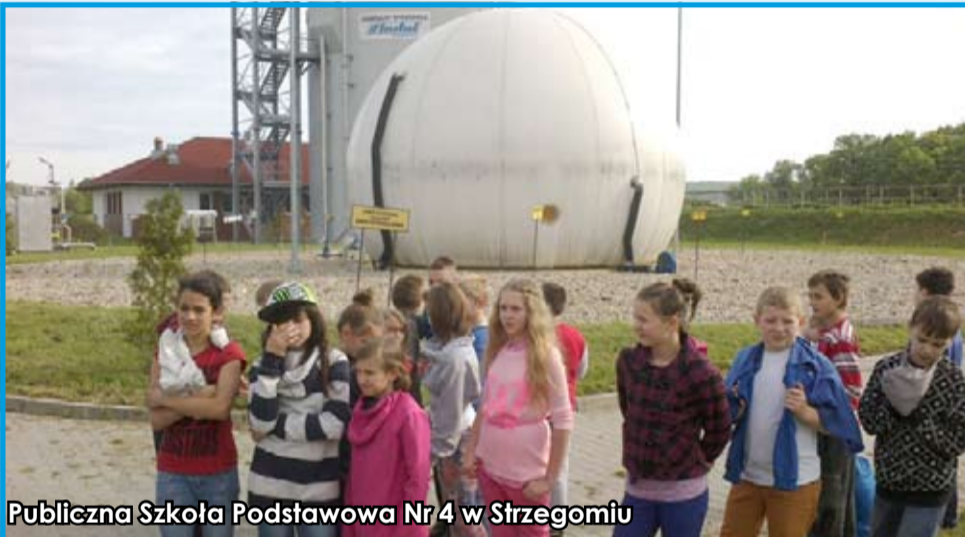
Publiczna Szkoła Podstawowa Nr 4 w Strzegomiu