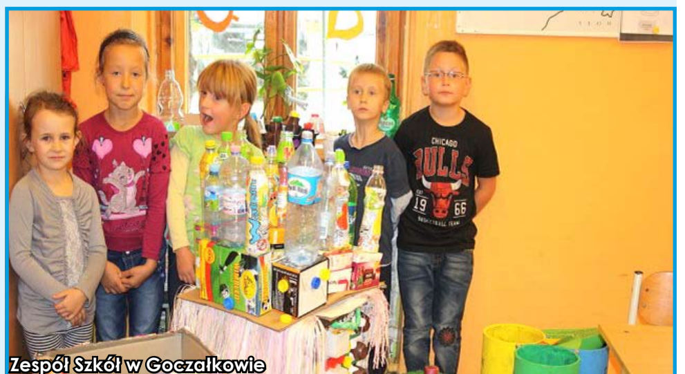
Zespół Szkół w Goczałkowie