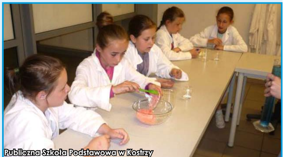
Publiczna Szkoła Podstawowa w Kostrzy