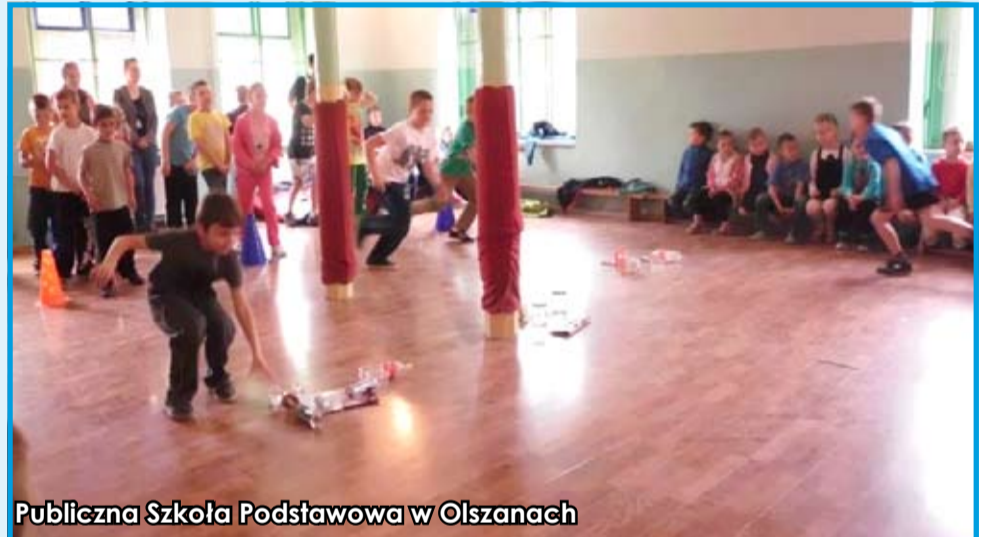
Publiczna Szkoła Podstawowa w Olszanach