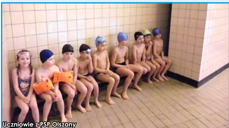
Uczniowie z PSP Olszany