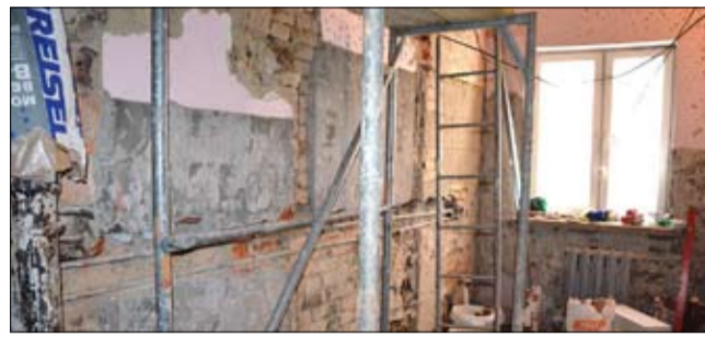
Remont wykonuje firma PPHU Portal K. Sobol. Koszt wszelkich prac wynosi ok. 52,5 tys. zł.

Kolejna, piąta zbiórka krwi już 21 maja br. - zapowiadają radni Młodzieżowej Rady Strzegomia