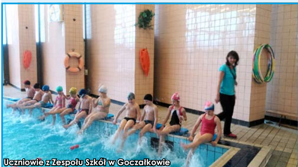
Uczniowie z Zespołu Szkół w Goczałkowie