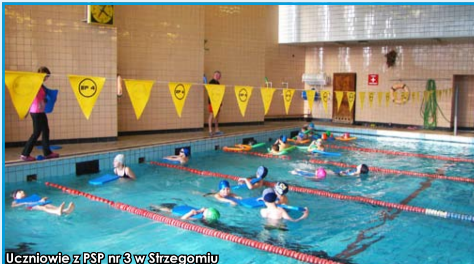
Uczniowie z PSP nr 3 w Strzegomiu