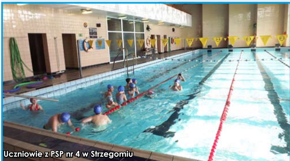
Uczniowie z PSP nr 4 w Strzegomiu