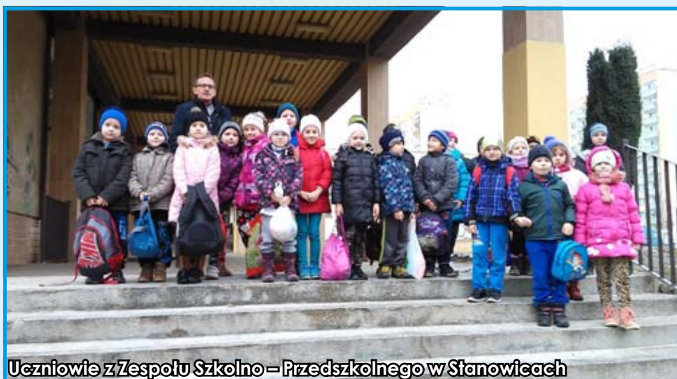
Uczniowie z Zespołu Szkolno-Przedszkolnego w Stanowicach