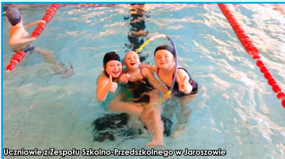
Uczniowie z Zespołu Szkolno-Przedszkolnego w Jaroszowie