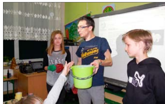
Pomoc przy organizacji przedsięwzięcia oraz opiekę nad uczniami w tym czasie sprawowali wychowawcy klas 6 wraz z rodzicami uczniów kl.6 a oraz kl.6 b.

Po zakończeniu warsztatów uczniowie brali udział w dysko-tece. Następnie spędzili nocleg w salach lekcyjnych, co było dla nich ciekawym przeżyciem.