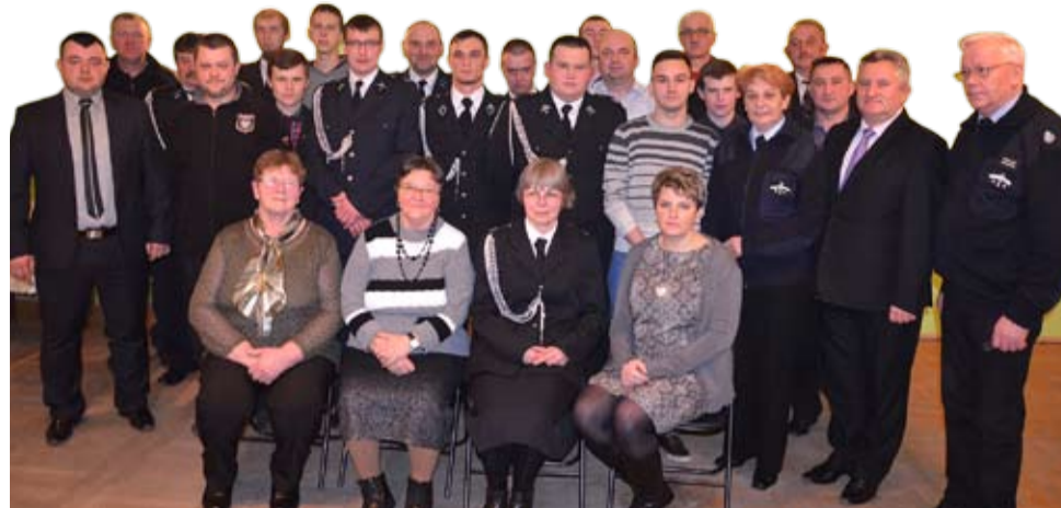
W 2014 r. OSP Rogoźnica wyjeżdżała w sumie do 34 zdarzeń, z czego 22 to pożary, 9 to miejscowe zagrożenia, czyli m. in. wypadki drogowe i wynikające z sił natury, 3 alarmy były fałszywe.