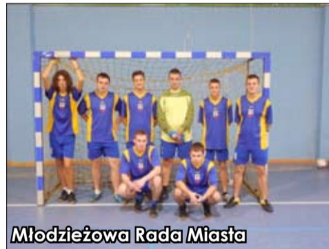
Młodzieżowa Rada Miasta