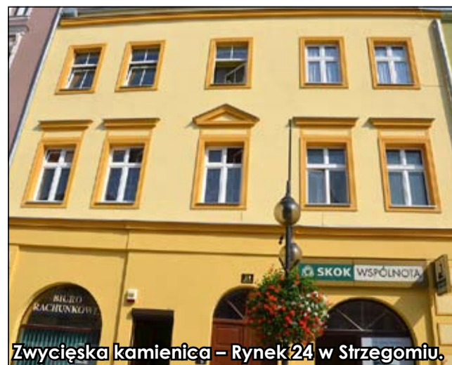
Zwycięska kamienica – Rynek 24 w Strzegomiu.

Pełną listę laureatów zamieścimy w kolejnym numerze „Gminnych Wiadomości Strzegom” (24 lutego br.).