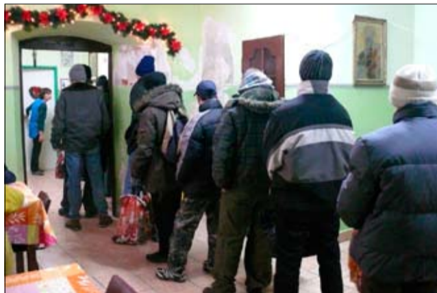
Na 2015 r. UM w Strzegomiu przyznał stołówce charytatywnej dotację w wysokości 140 tys. zł.

W 2014 r. stołówce została przyznana z Urzędu Miejskiego w Strzegomiu dotacja w wysokości 135 tys. zł na realizację zadania publicznego pod nazwą „Przygotowanie i wydawanie gorących posiłków dla rodzin i osób znajdujących się w trudnej sytuacji materialnej”. Otrzy-