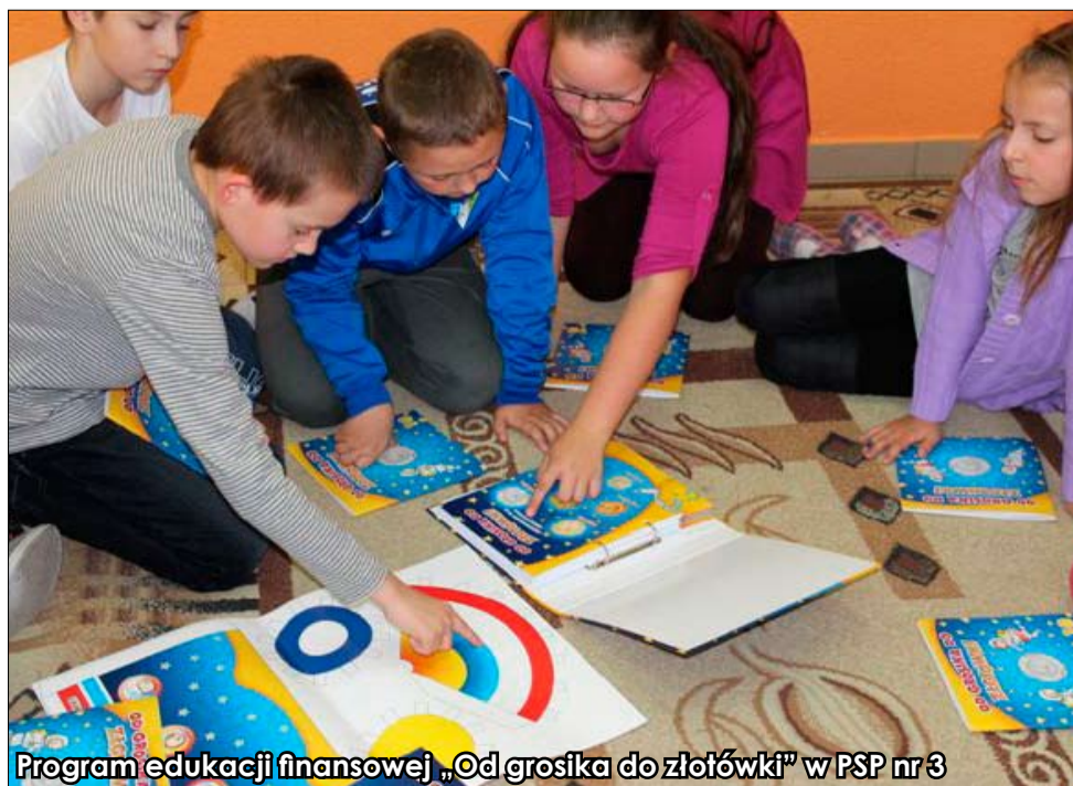
Program edukacji finansowej „Od grosika do złotówki” w PSP nr 3