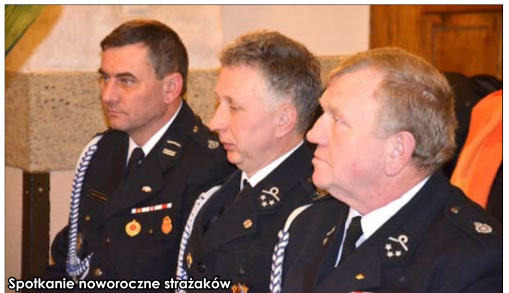
Spotkanie noworoczne strażaków