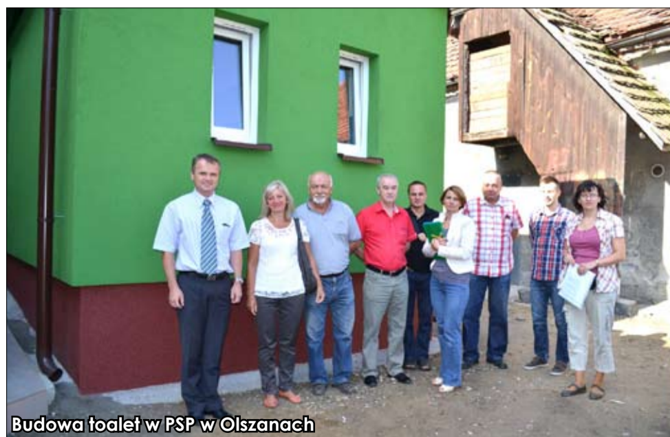
Budowa toalet w PSP w Olszanach