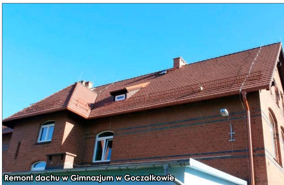
Remont dachu w Gimnazjum w Goczałkowie