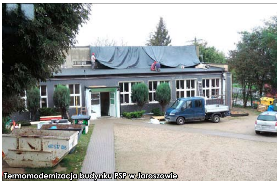
Termomodernizacja budynku PSP w Jaroszowie