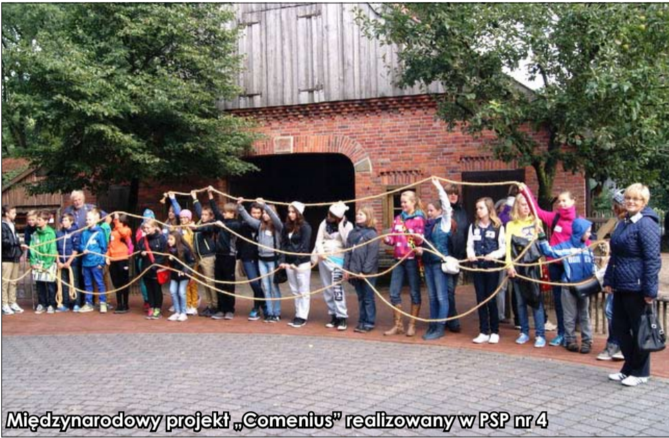
Międzynarodowy projekt „Comenius” realizowany w PSP nr 4