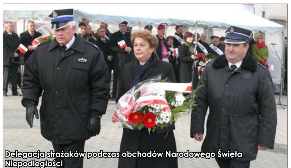
Delegacja strażaków podczas obchodów Narodowego Święta Niepodległości