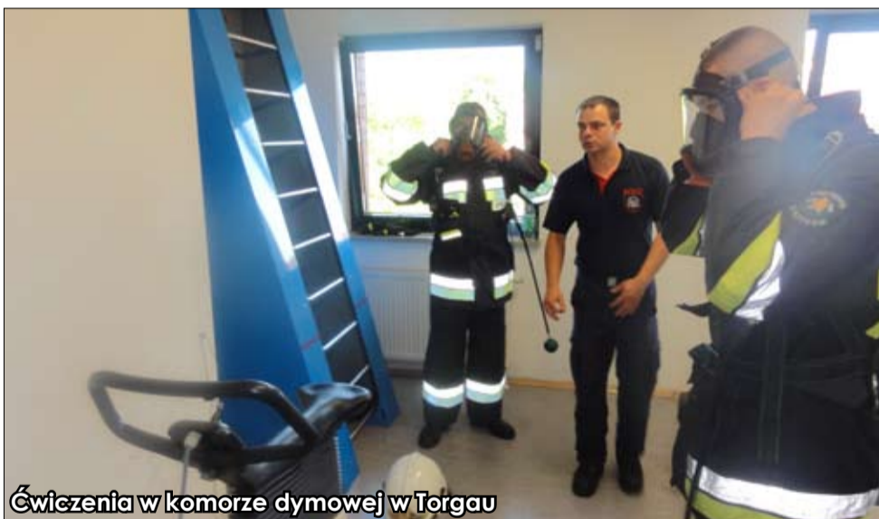
Ćwiczenia w komorze dymowej w Torgau