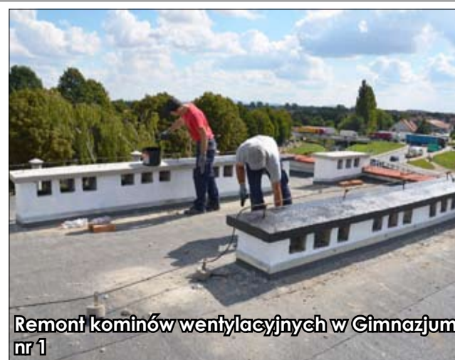
Remont kominów wentylacyjnych w Gimnazjum nr 1