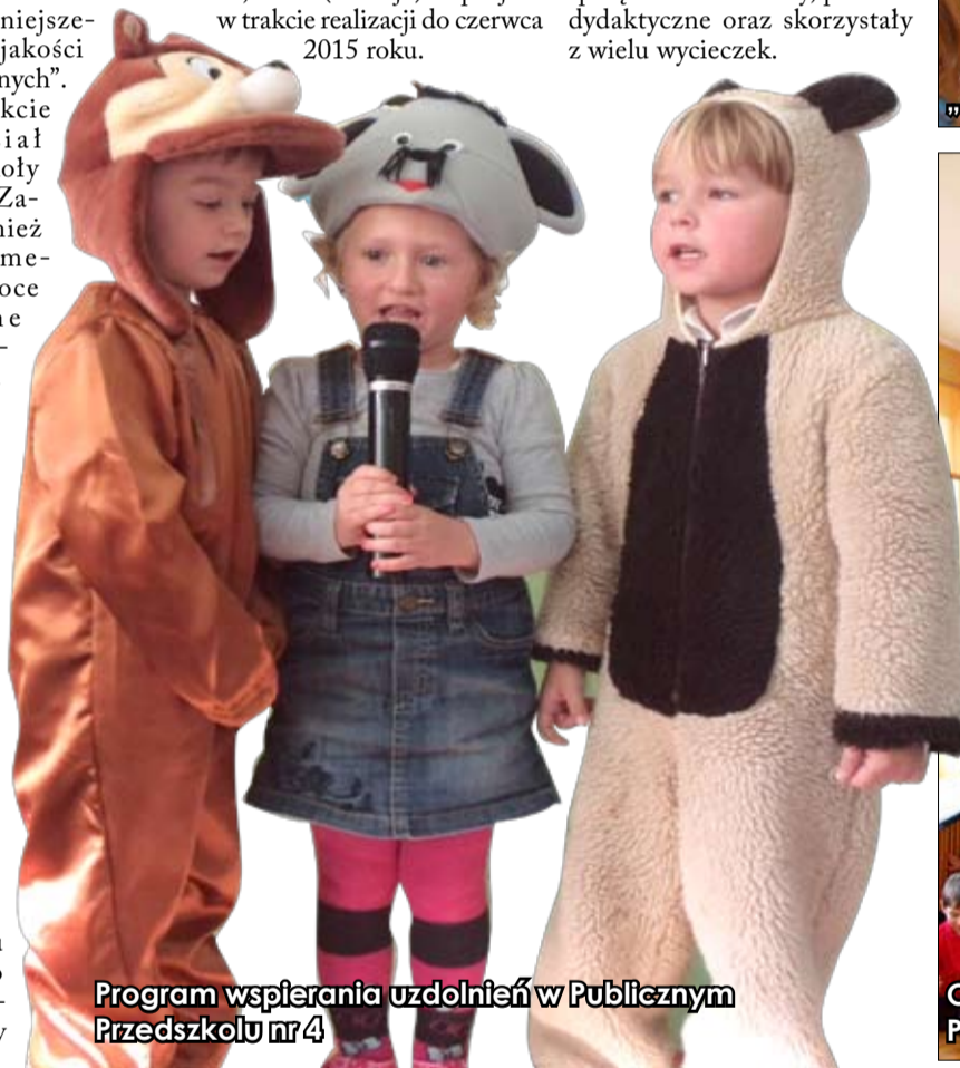
Program wspierania uzdolnień w Publicznym Przedszkolu nr 4

Szkoły realizowały również m. in. projekt ekologiczny „Odpady – proste zasady” na łączną kwotę 478 685 zł, z czego 234 000 to dotacja z Wojewódzkiego Funduszu Ochrony Środowiska i Gospodarki Wodnej. W ramach realizacji zajęć z zakresu edukacji ekologicznej szkoły zostały wyposażone w nowoczesny sprzęt multimedialny, pomoce dydaktyczne oraz skorzystały z wielu wycieczek.