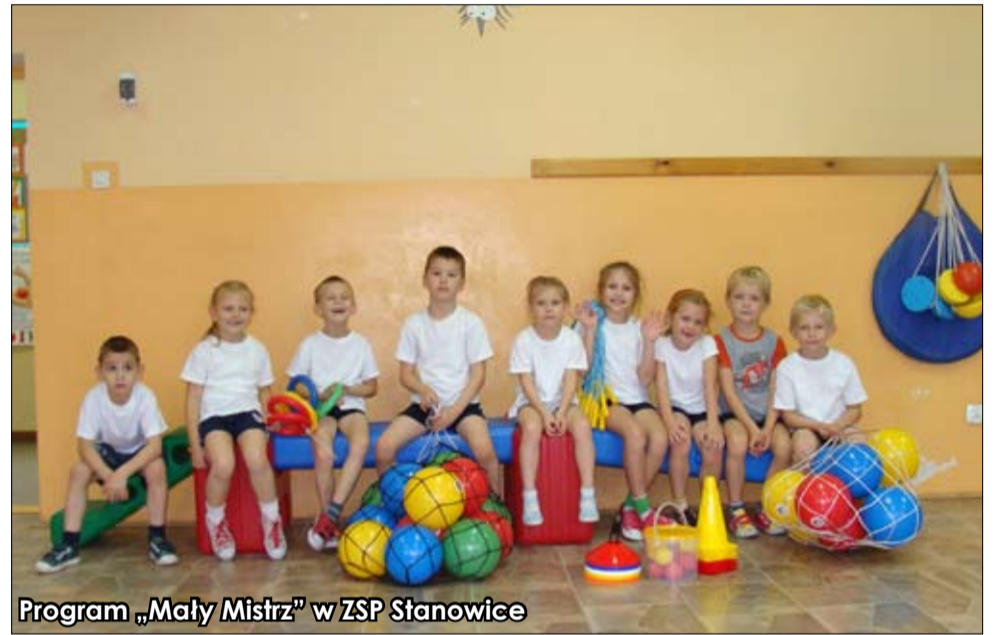
Program „Mały Misz” w ZSP Stanowice