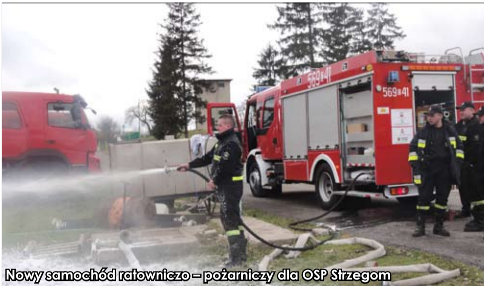
Nowy samochód ratowniczo – pożarniczy dla OSP Strzegom