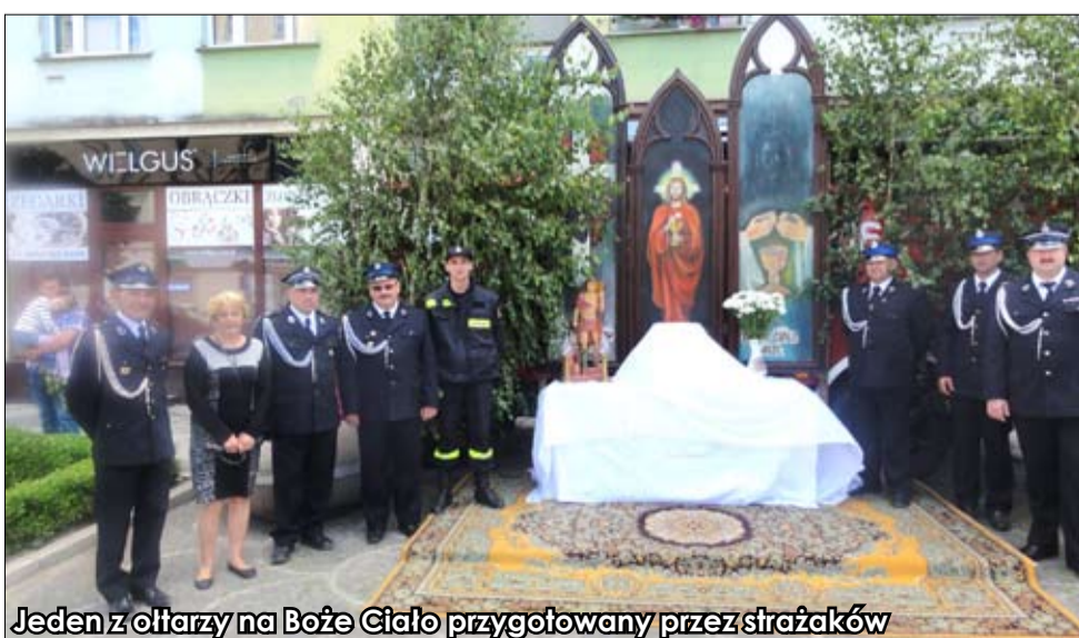
Jeden z ołtarzy na Boże Ciało przygotowany przez strażaków