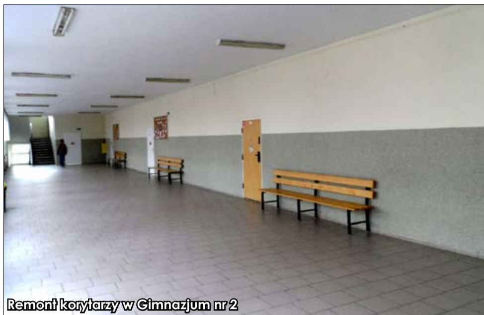
Remont korytarzy w Gimnazjum nr 2