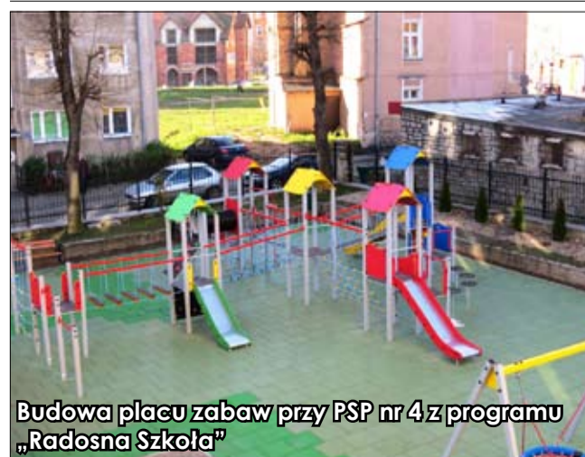
Budowa placu zabaw przy PSP nr 4 z programu „Radosna Szkoła”