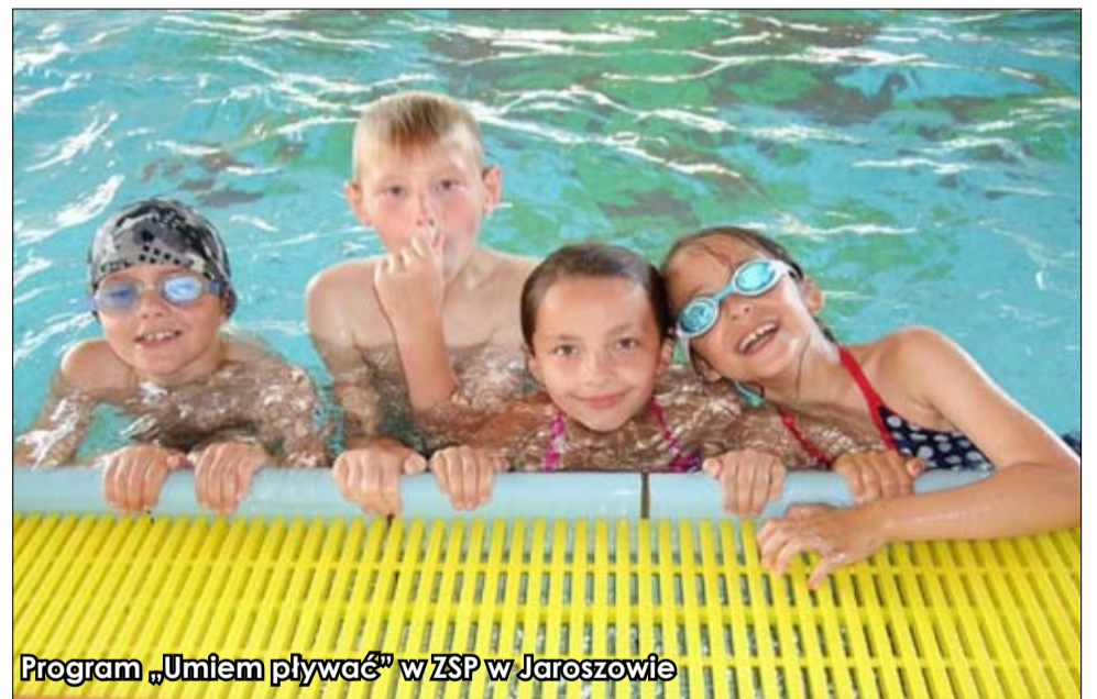
Program „Umiem pływać” w ZSP w Jarosławie