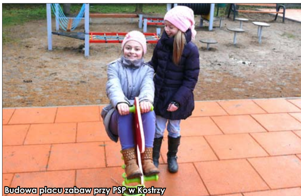
Budowa placu zabaw przy PSP w Kostrzy