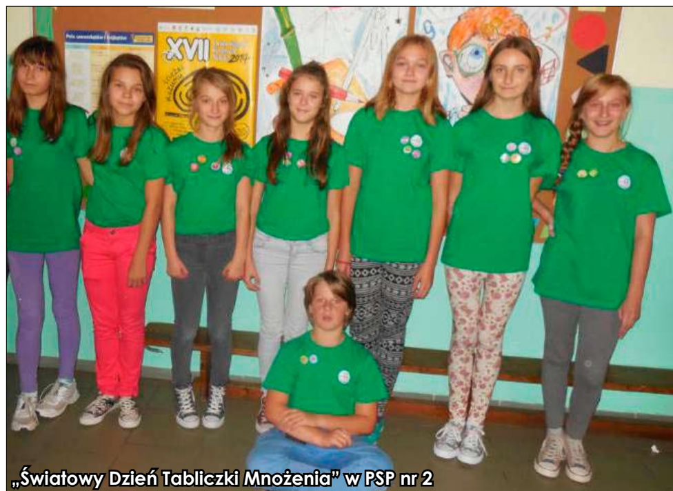
„Świątowy Dzień Tabliczki Mnożenia” w PSP nr 2