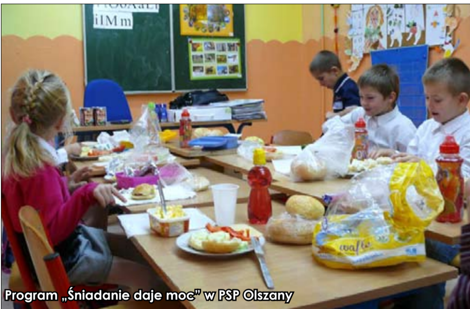
Program „Śniadanie daje moc” w PSP Olszany