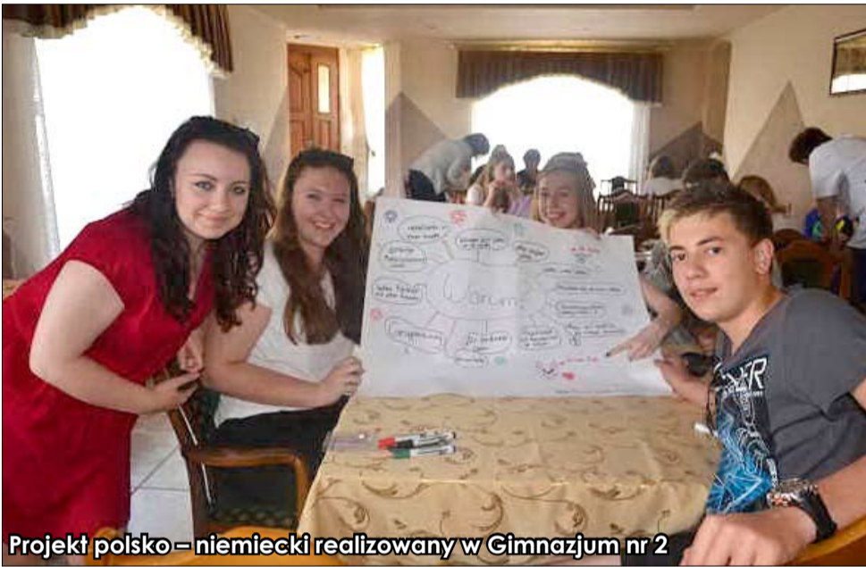
Projekt polsko – niemiecki realizowany w Gimnazjum nr 2