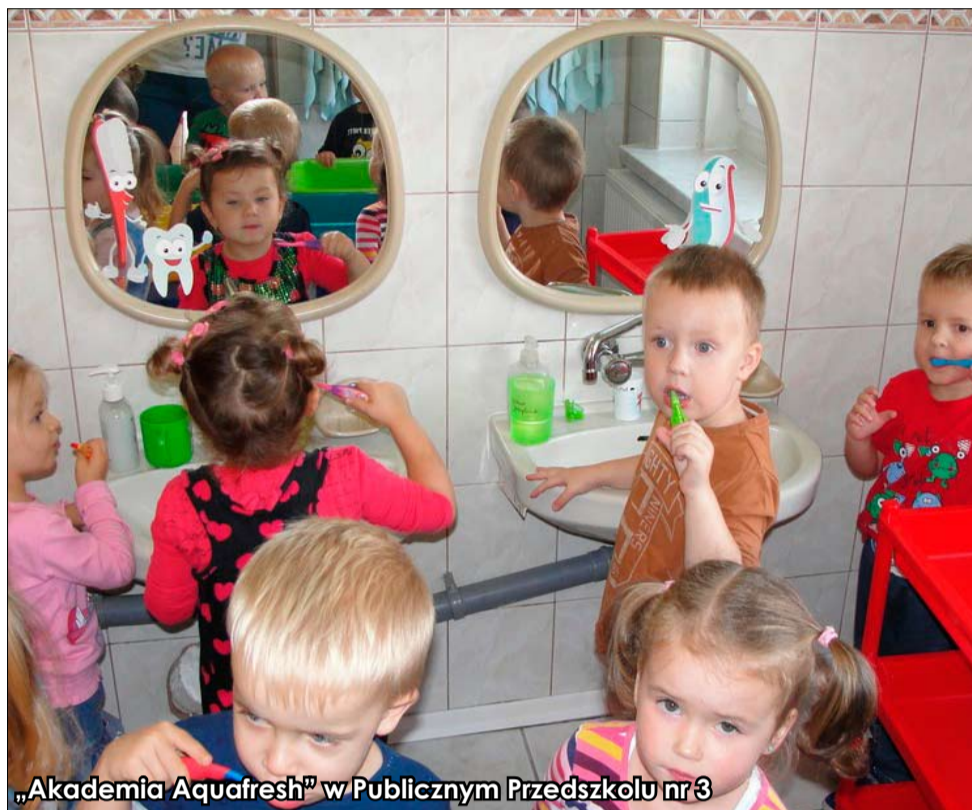
„Akademia Aquafresh” w Publicznym Przedszkolu nr 3