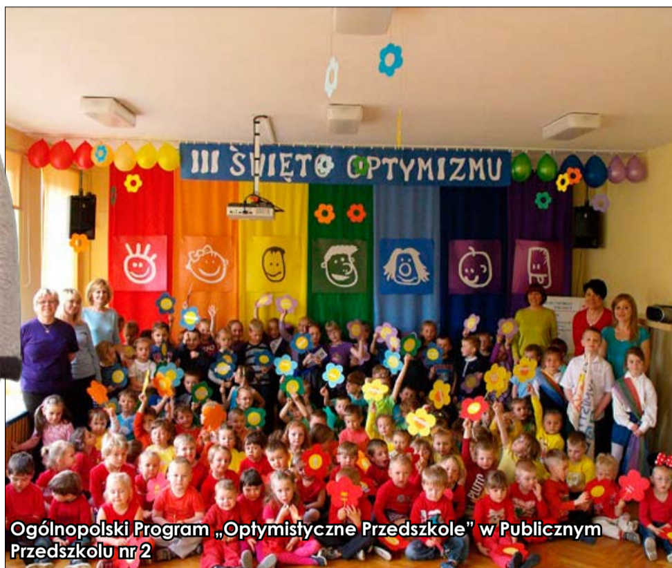
Ogólnopolski Program „Optymistyczne Przedszkole” w Publicznym Przedszkolu nr 2