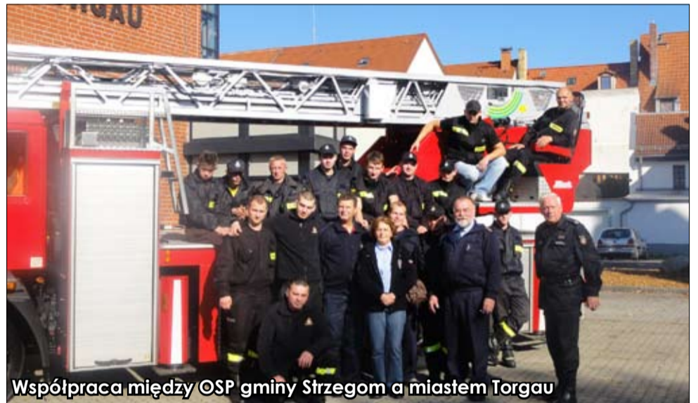
Współpraca między OSP gminy Strzegom a miastem Torgau