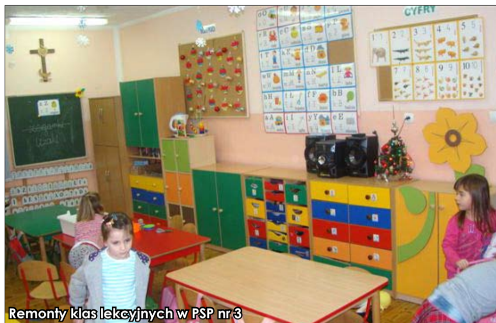
Remonty klas lekcyjnych w PSP nr 3