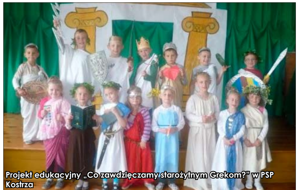
Projekt edukacyjny „Co zawdzięczamy starożytnym Grekom?” w PSP Kostrza