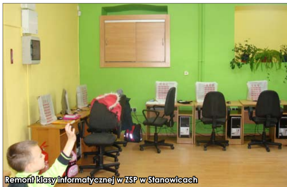
Remont klasy informatycznej w ZSP w Stanowicach