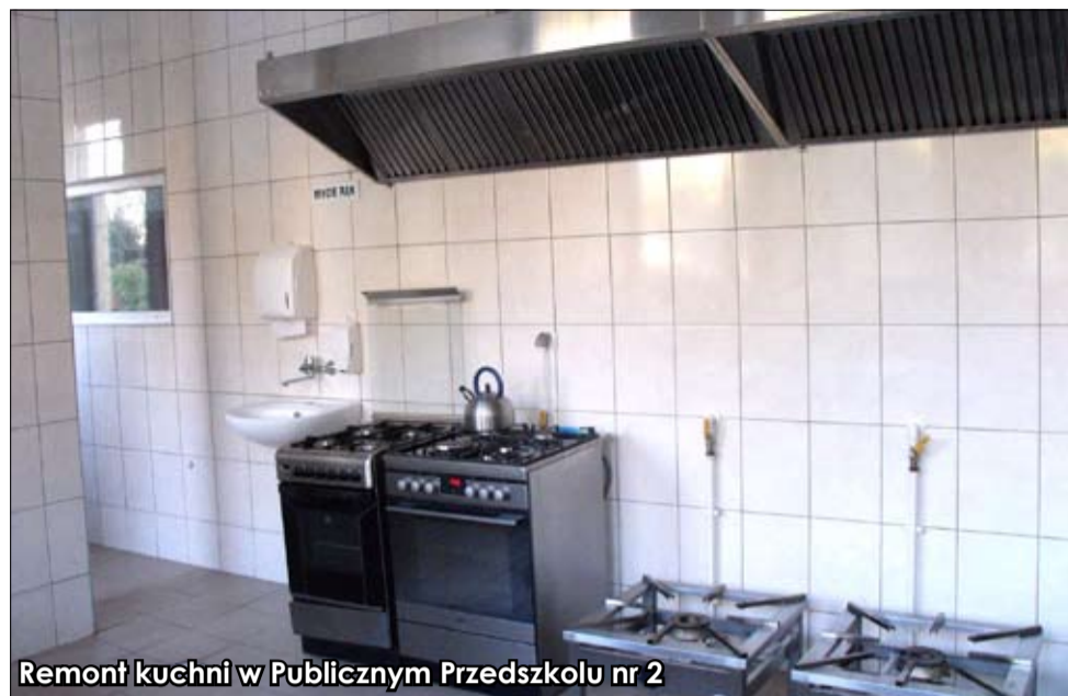
Remont kuchni w Publicznym Przedszkolu nr 2