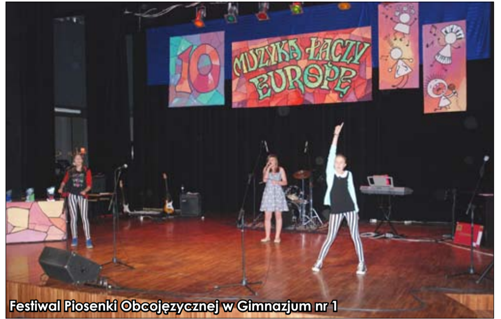
Festiwal Piosenki Obcojęzycznej w Gimnazjum nr 1