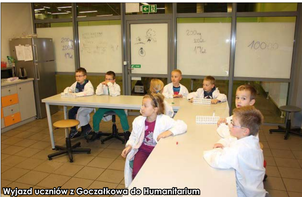
Wyjazd uczniów z Goczałkowa do Humanitarium