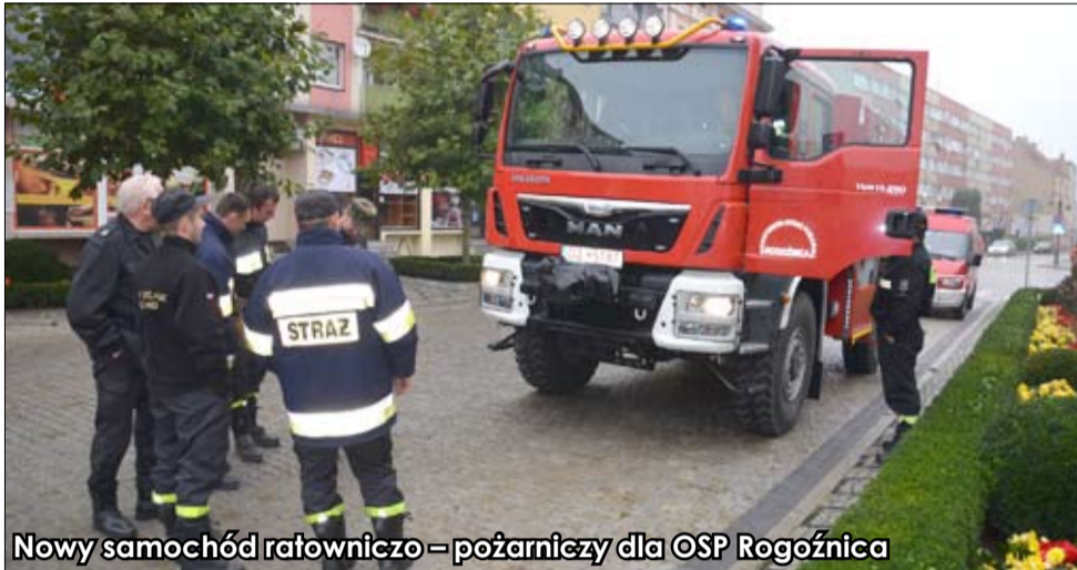
Nowy samochód ratowniczo – pożarniczy dla OSP Rogoźnica

Wielokrotnie już podkreślaliśmy, że strażaków z Ochotniczych Straży Pożarnych w gminie Strzegom można stawiać za wzór profesjonalizmu, fachowości i niezwyklej pracowitości. Dzięki nim mieszkańcy całej gminy – i nie tylko – mogą się czuć całkowicie bezpiecznie. Warto dodać, że nasi strażacy oprócz uczestnictwa w różnych akcjach ratowniczych, zabezpieczają imprezy masowe, uczestniczą we wszystkich uroczystościach i świętach różnej rangi. Na podkreślenie i ciepłe słowa zasługuje ich ścisła, obustronna, współpraca z Ochotniczymi Strażami Pożarnymi z Torgau, dzięki której korzystają mieszkańcy obu miast partnerskich.