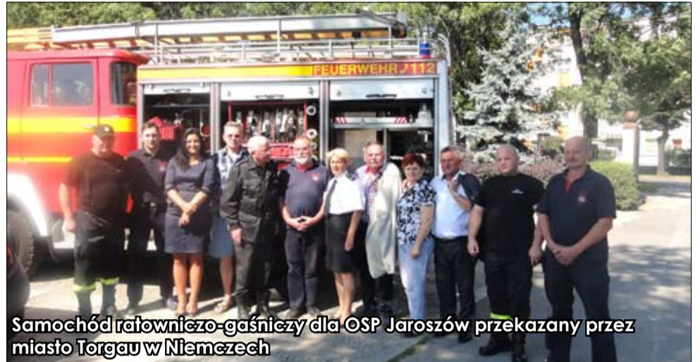
Samochód ratowniczo-gaśniczy dla OSP Jaroszków przekazany przez miasto Torgau w Niemczech