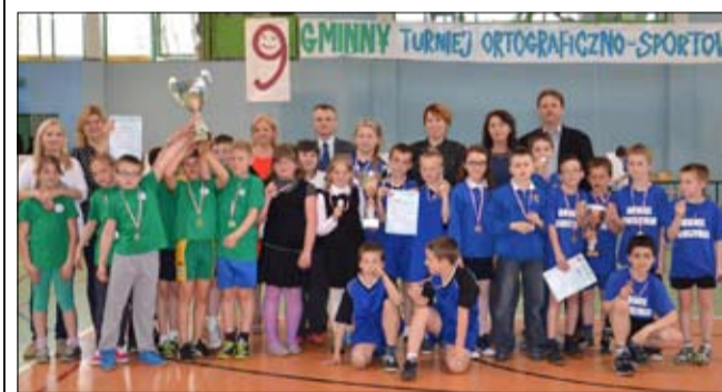
W tym roku, podobnie jak w poprzednim zwyciężyli uczniowie z Publicznej Szkoły Podstawowej nr 2 w Strzegomiu. II miejsce zajął ZSP z Jaroszowa, natomiast III - PSP nr 4 ze Strzegomia.

Uroczystość dostarczyła niezapomnianych wrażeń i przeżyć zarówno dla gości, jak i organizatorów. Dzieci zaprezentowały się zarówno w tańcu i śpiewie