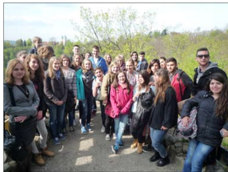
Kolejne spotkanie młodzieży odbędzie się już za dwa miesiące w Izraelu, gdzie licealiści poznają historię Jerozolimy, Betlejem i innych zakątków tego niezwykłego regionu.

atmosfera – mówią licealiści. Opiekunowie niemieccy i izraelscy udali się również na liturgię Wielkiej Soboty do Bazyliki Mniejszej. - Polacy potrafią wspaniale celebrować takie święta – dodali tuż po wyjściu z kościoła. Polska część projektu jest bardzo zróżnicowana. Młodzież poznała historię Strzegomia, Książa, Wrocławia, ale także turystyczne uroki Szklarskiej Poręby i górskich wycieczek. Najtrudniejszą częścią projektu była realizowana w Międzynarodowym Domu Spotkań Młodzieży w Oświęcimiu. Europejska część projektu zakończyła się w piątek (25.04.) w Strzegomiu.