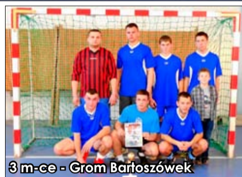
3 m-ce - Grom Bartoszówek