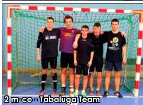
2 m-ce - Tabaluga Team