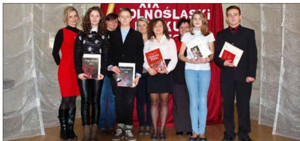
Wszyscy uczestnicy otrzymali od organizatorów pamiątkowe podziękowania i upominek, natomiast laureatom oraz wyróżnionym recytatorom wręczono nagrody książkowe ufundowane przez Urząd Miejski w Strzegomiu.