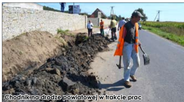
Chodnik na drodze powiatowej w trakcie prac

W 2011 roku natomiast wykonano remonty kanalizacji burzowych na terenie sołectwa Żelazów, w tym: dwa przepusty pod drogami gminnymi – jeden pod drogą wewnętrzną w Żelazowie, a drugi na terenie sołectwa przy drodze Żelazów – Kostrza.