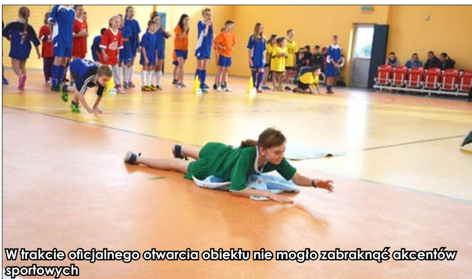
W trakcie oficjalnego otwarcia obiektu nie mogło zabraknąć akcentów sportowych