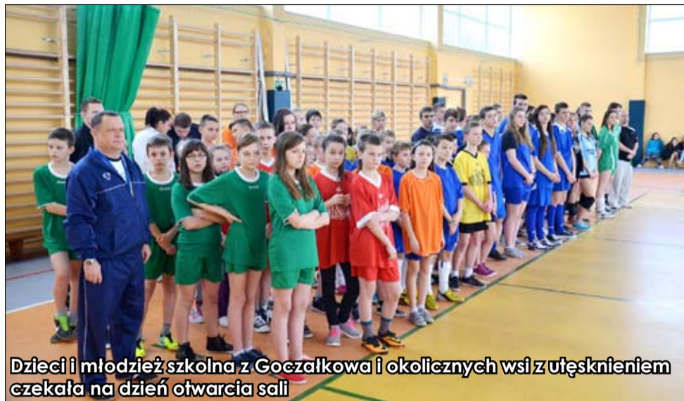
Dzieci i młodzież szkolna z Goczałkowa i okolicznych wsi z utęsknieniem czekała na dzień otwarcia sali