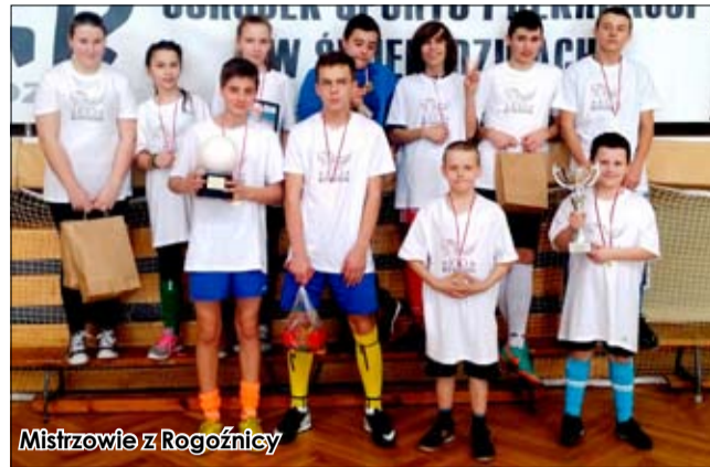
Mistrzowie z Rogoźnicy

Na zaproszenie Ośrodka Pomocy Społecznej w Świebodzicach dwie drużyny ze świetlic opiekuńczo-wychowawczych Stowarzyszenia „Akcja” wzięły udział w I Haliowym Turnieju Piłki Nożnej Świetlic Środowiskowych, który odbył się w dniu 1 lutego 2014 r. w Hali Sportowej Świebodzickiego Ośrodka Sportu i Rekreacji