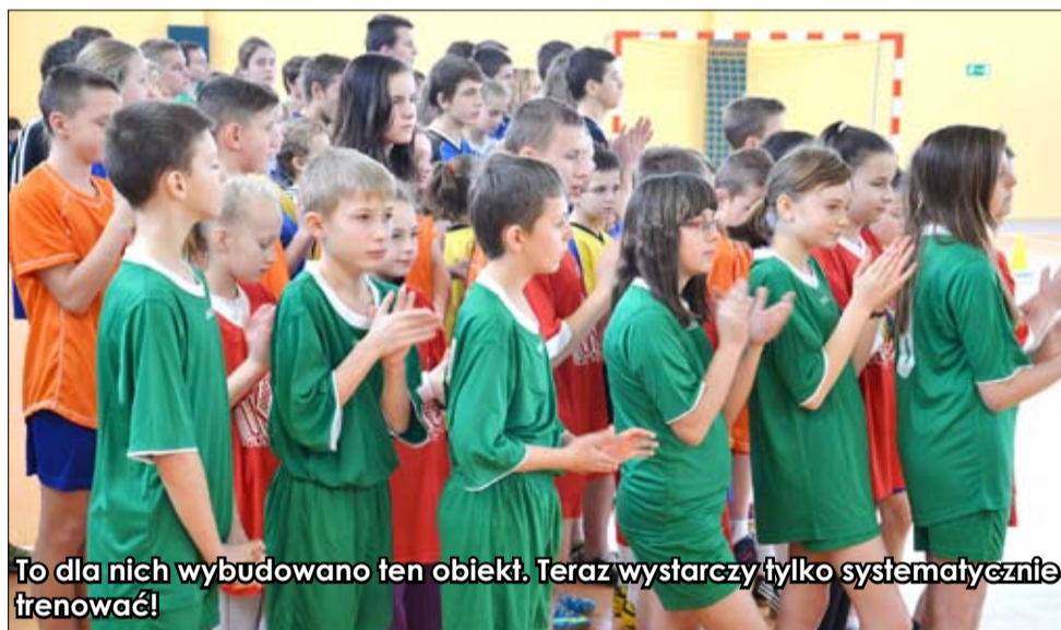
To dla nich wybudowano ten obiekt. Teraz wystarczy tylko systematycznie trenować!