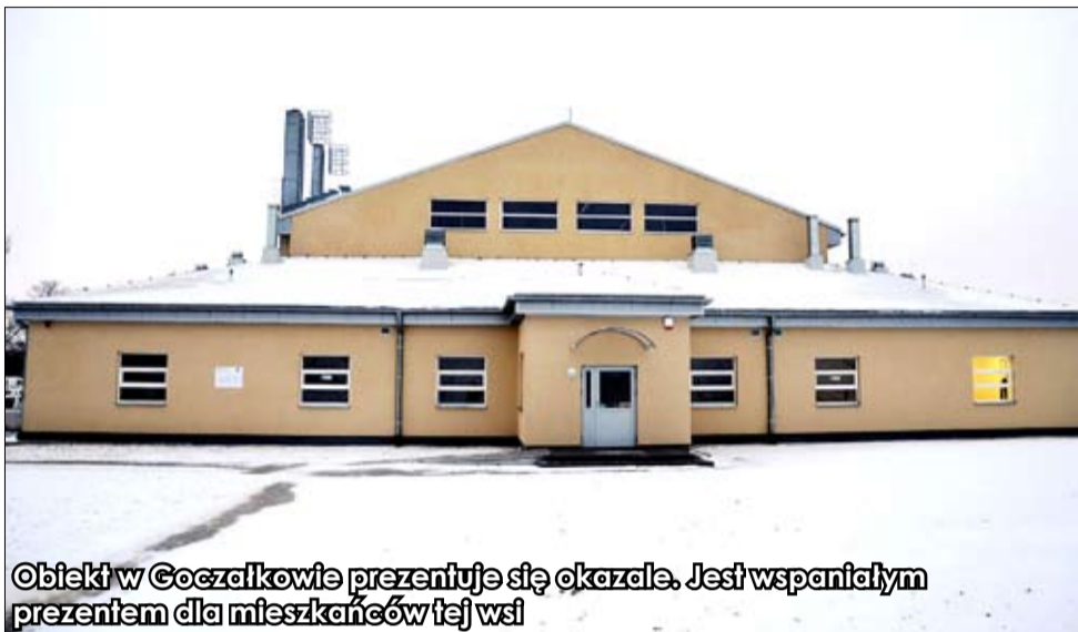
Obiekt w Goczałkowie prezentuje się okazale. Jest wspaniałym prezentem dla mieszkańców tej wsi

Za nami uroczyste otwarcie sali gimnastycznej w Goczałkowie, które odbyło się w dniu 31 stycznia br. Mieszkańcy tego sołectwa już od 3 lutego korzystają z pięknego obiektu, który jest prawdziwą dumą i wizytówką wsi. Jak sami goczałkowieanie podkreślają, właśnie spełniły się ich marzenia. Nam nie pozostaje nic innego, jak tylko życzyć wszystkim dużej aktywności fizycznej, systematycznego treningu i spędzania swojego wolnego czasu „na sportowo”. Korzystać z sali będą wszystkie szkoły wiejskie i mieszkańcy gminy.