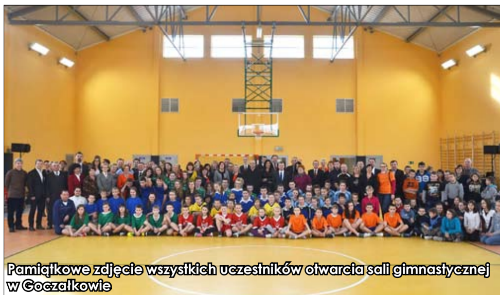
Pamiątkowe zdjęcie wszystkich uczestników otwarcia sali gimnastycznej w Goczałkowie