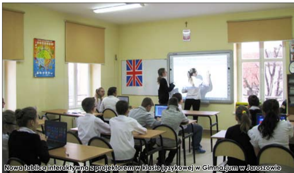
Nowa tablica interaktywna z projekтором w klasie językowej w Gimnazjum w Jarosławie