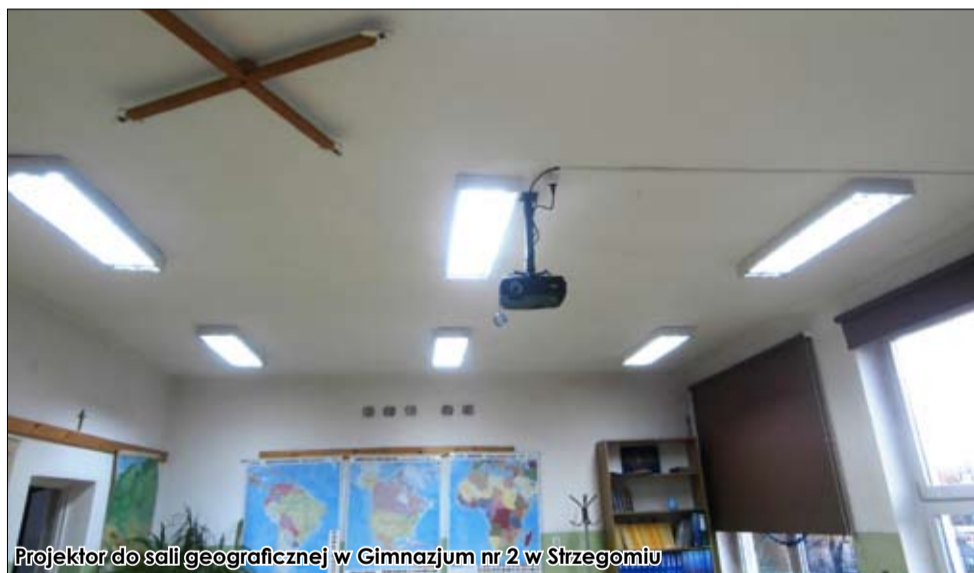
Projektor do sali geograficznej w Gimnazjum nr 2 w Strzegomiu