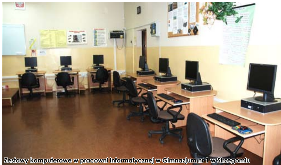
Zestawy komputerowe w pracowni informatycznej w Gimnazjum nr 1 w Strzegomiu

W tym numerze „Gminnych Wiadomości Strzegom” przedstawiamy galerię fotografii, które ukazują to, co udało się wykonać w placówkach oświatowych gminy Strzegom z oszczędności na koniec ubiegłego roku. Trzeba przyznać, że skala działań szkół jest bardzo duża, a poniższe zdjęcia – tak naprawdę – w niewielkim stopniu obrazują dokonania na tym polu.