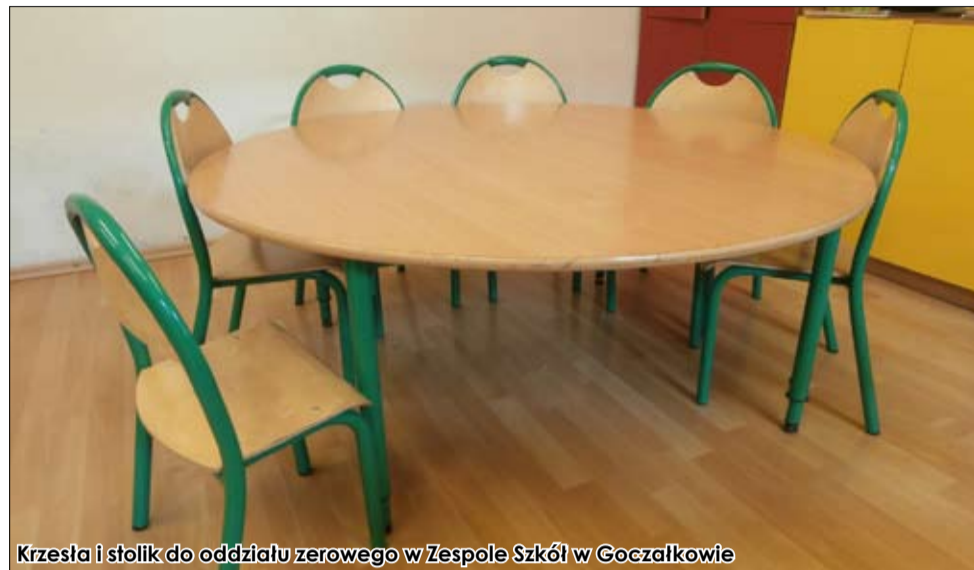
Krzesła i stół do oddziału zerowego w Zespole Szkół w Goczałkowie