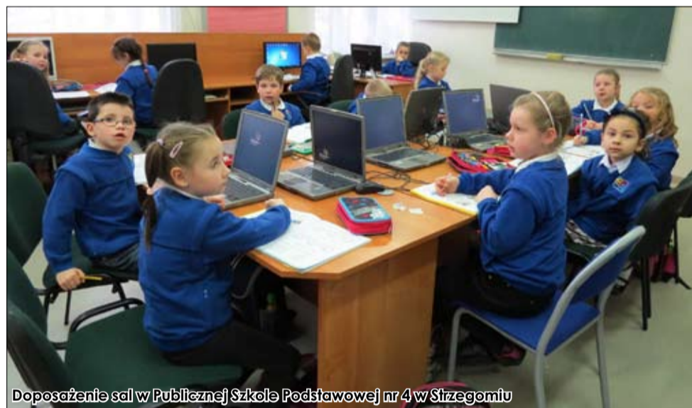
Doposażenie sal w Publicznej Szkole Podstawowej nr 4 w Strzegomiu