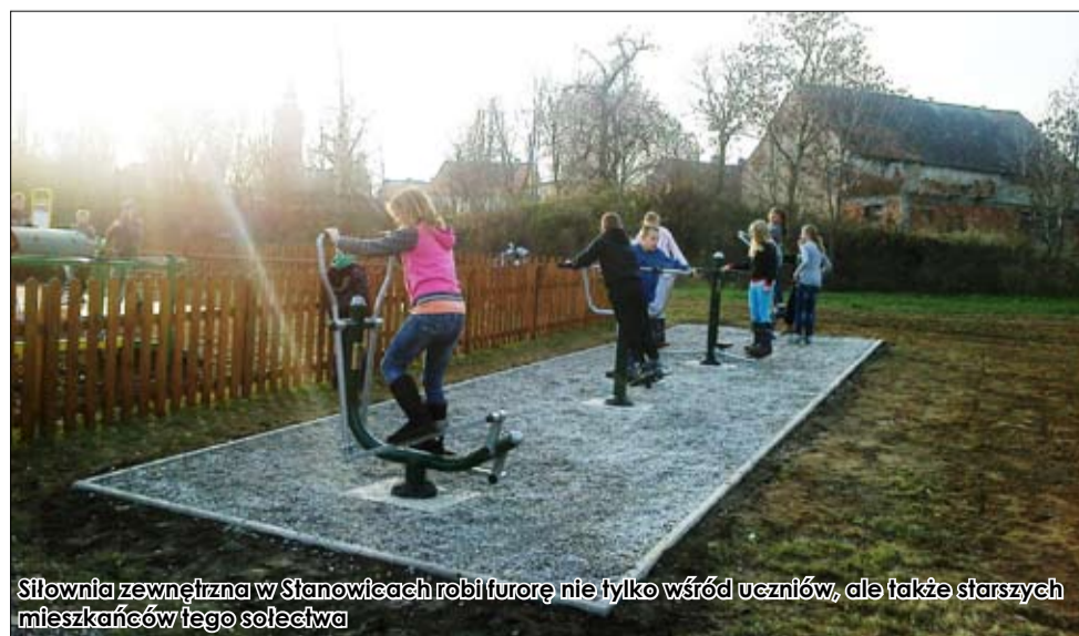
Siłownia zewnętrzna w Stanowicach robi furorę nie tylko wśród uczniów, ale także starszych mieszkańców tego sołectwa