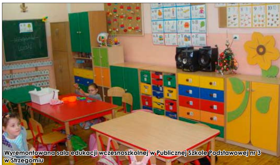
Wyremontowana sala edukacji wczesnoszkolnej w Publicznej Szkole Podstawowej nr 3 w Strzegomiu