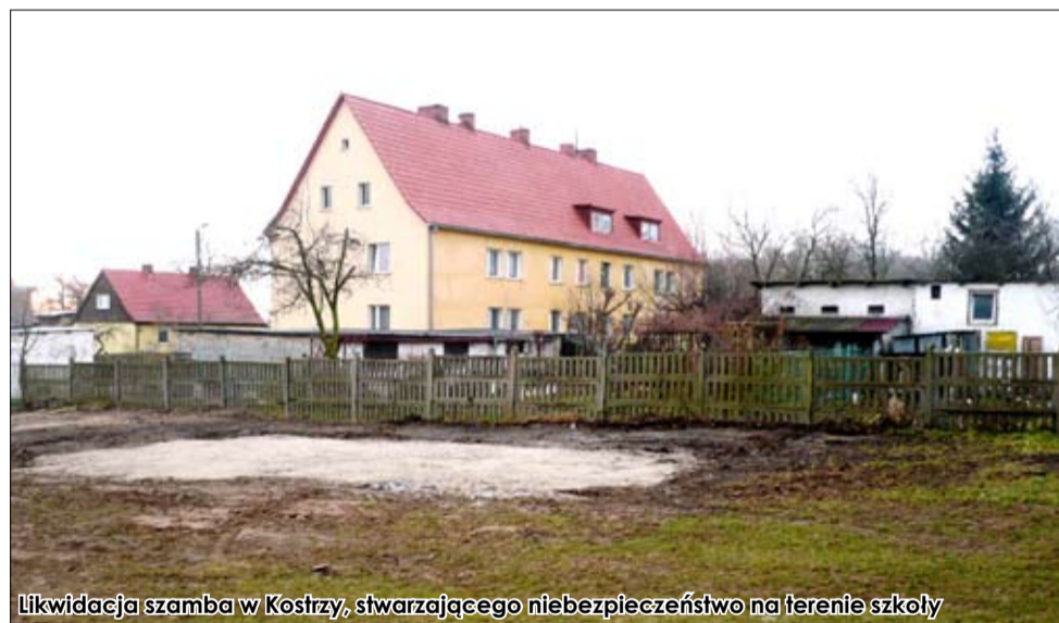
Likwidacja szamba w Koszry, stwarzającego niebezpieczeństwo na terenie szkoły