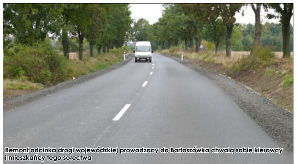
Remont odcinka drogi wojewódzkiej prowadzący do Bartoszewka chwalą sobie kierowcy i mieszkańcy tego sołectwa