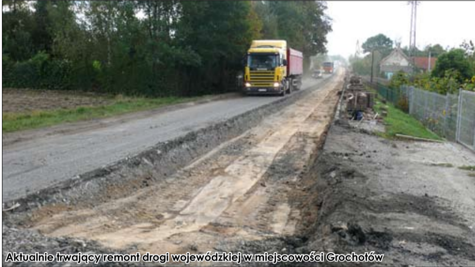
Aktualnie trwający remont drogi wojewódzkiej w miejscowości Grochotów

Oto inwestycje drogowe w gminie Strzegom realizowane w 2013 r. przez Dolnośląską Służbę Dróg i Kolei we Wrocławiu. Zadania były i są finansowane przez DSDiK. Remont chodników finansowany był w 50 % przez gminę Strzegom.