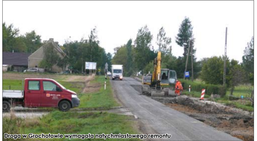
Droga w Grochotowie wymagała natychmiastowego remontu