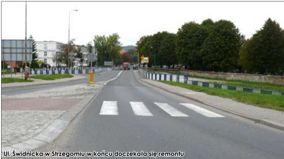
Ul. Świdnicka w Strzegomiu w końcu doczekała się remontu