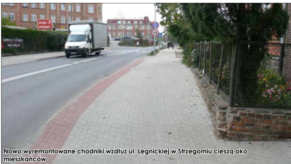
Nowo wyremontowane chodniki wzdłuż ul. Legnickiej w Strzegomiu cieszą oko mieszkańców