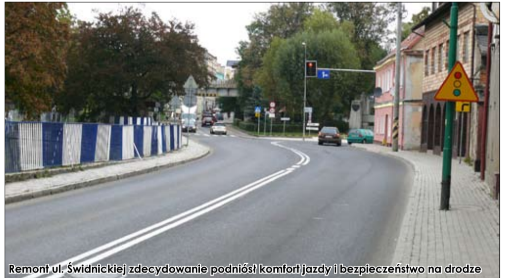
Remont ul. Świdnickiej zdecydowanie podniósł komfort jazdy i bezpieczeństwo na drodze