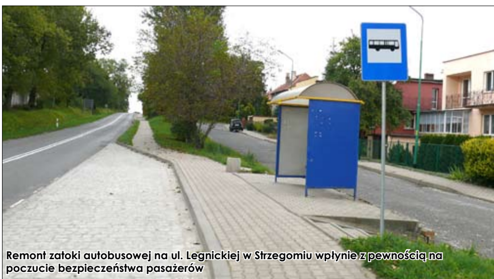
Remont zatoki autobusowej na ul. Legnickiej w Strzegomiu wpłynie z pewnością na poczucie bezpieczeństwa pasażerów