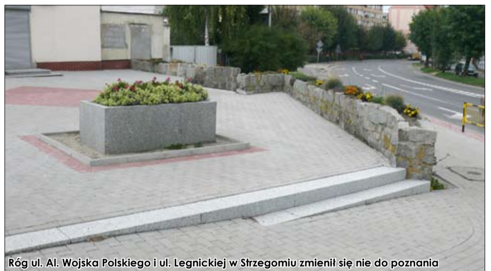
Róg ul. Al. Wojska Polskiego i ul. Legnickiej w Strzegomiu zmienił się nie do poznania