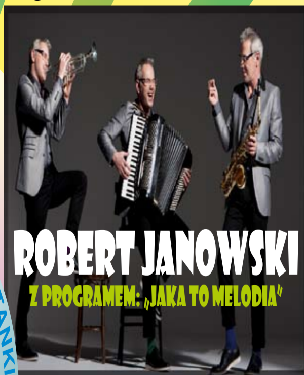
ROBERT JANOWSKI Z PROGRAMEM: „JAKA TO MELODIA”