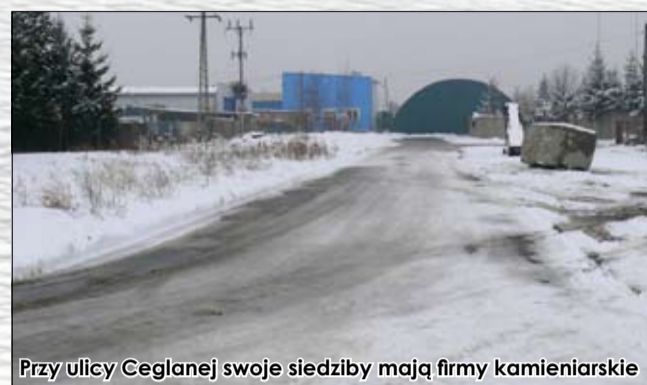
Przy ulicy Ceglanej swoje siedziby mają firmy kamieniarskie

nawierzchni szutrowej z mieszanki granitowej. Długość remontowego odcinka wyniosła 530 m, zaś jego szerokość ok. 6 m. Na tym odcinku zostały wykonane dwie zatoki postojowe. Wartość wykonywanych robót wyniosła ok. 56 tys. zł. Wykonawcą zadania był Arkadiusz Ratkowski, firma PPHU Drog Art w Strzegomiu. Duży wkład pracy w początkowym etapie robót włożyli pracownicy zakładu parkingowa przy ul. Promenady w Strzegomiu oraz przebudowana została ul. Pułaskiego w Strzegomiu. Ponadto zagospodarowano teren parku przy ul. Krótkiej w zakresie robót budowlanych