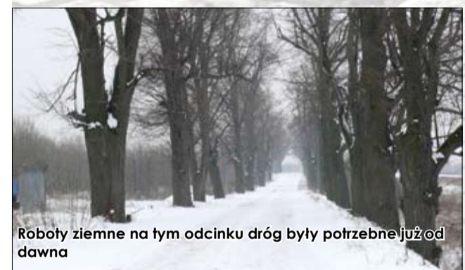
Roboty ziemne na tym odcinku dróg były potrzebne już od dawna

Łączna długość dróg przebiegających przez gminę Strzegom wynosi 218 km. Z tego, drogi gminne mają długość 93 km. Długość dróg