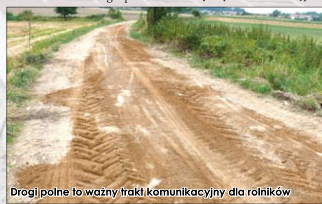
Drogi polne to ważny trakt komunikacyjny dla rolników

gospodarcze i wykorzystywane są najczęściej do dojazdu do pól uprawnych, co jednak nie zmienia faktu, że są równie ważne jak główne arterie. W zeszłym roku remontom poddano drogi polne w Goczałkowie Górnym, w Olszanych oraz w Żółkiewcu. Prace polegały na mechanicznym profilowaniu i wyrównywaniu nawierzchni dróg, wykonaniu niezbędnych dosypek odpowiednich kruszyw oraz obkoszeniu poboczy. Roboty wykonała firma „Zemar” ze Stanowic. Koszt tego przed-