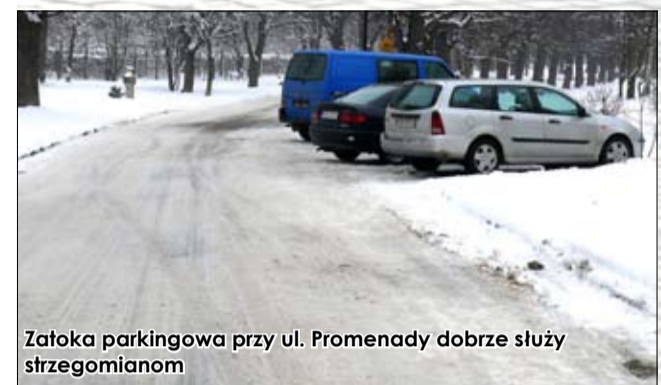
Zatoka parkingowa przy ul. Promenady dobrze służy strzegomianom

Ostatnie dwa lata to czas, kiedy w gminie Strzegom zrobiono naprawdę dużo w kwestii remontów dróg i chodników.