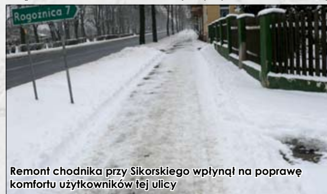
Remont chodnika przy Sikorskiego wpłynął na poprawę komfortu użytkowników tej ulicy

Długo oczekiwany łącznik na osiedlu Kamionka między ulicami Dębowa i Bukowa wykonało Przedsiębiorstwo Wielobranżowe „Stańczyk” ze Świebodzic. Prace rozpoczęły się 8 czerwca, a zakończyły 9 lipca 2012 r. Przebiegały bardzo sprawnie i zakończyły się przed terminem. Wartość