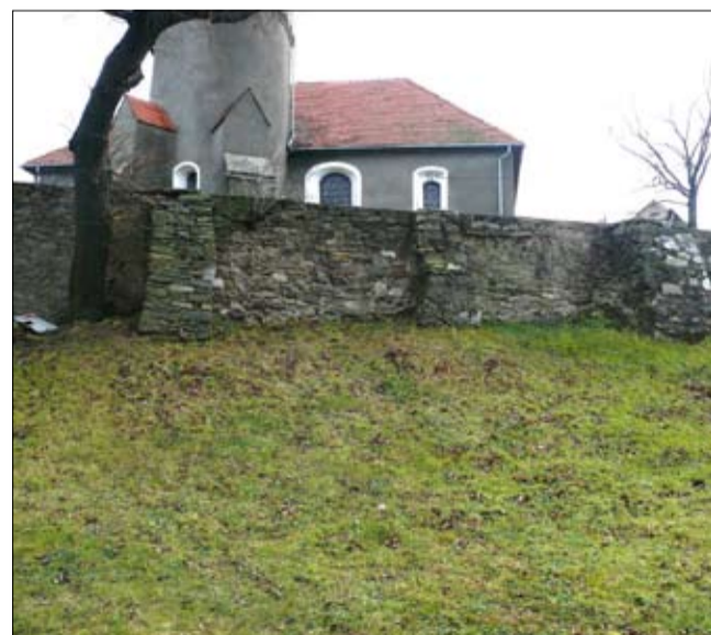
Zdjęcie przedstawiające miejsce, gdzie stanie tablica pamiątkowa w Rusku