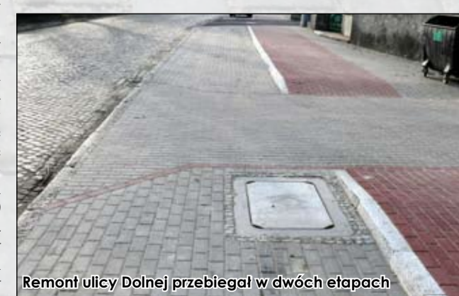
Remont ulicy Dolnej przebiegał w dwóch etapach