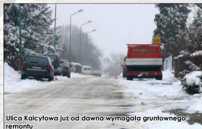
Ulica Kalcytowa już od dawna wymagała gruntownego remontu

nawierzchni szutrowej z mieszanki granitowej. Długość remontowego odcinka wyniosła 530 m, zaś jego szerokość ok. 6 m. Na tym odcinku zostały wykonane dwie zatoki postojowe. Wartość wykonywanych robót wyniosła ok. 56 tys. zł. Wykonawcą zadania był Arkadiusz Ratkowski, firma PPHU Drog Art w Strzegomiu. Duży wkład pracy w początkowym etapie robót włożyli pracownicy zakładu parkingowa przy ul. Promenady w Strzegomiu oraz przebudowana została ul. Pułaskiego w Strzegomiu. Ponadto zagospodarowano teren parku przy ul. Krótkiej w zakresie robót budowlanych