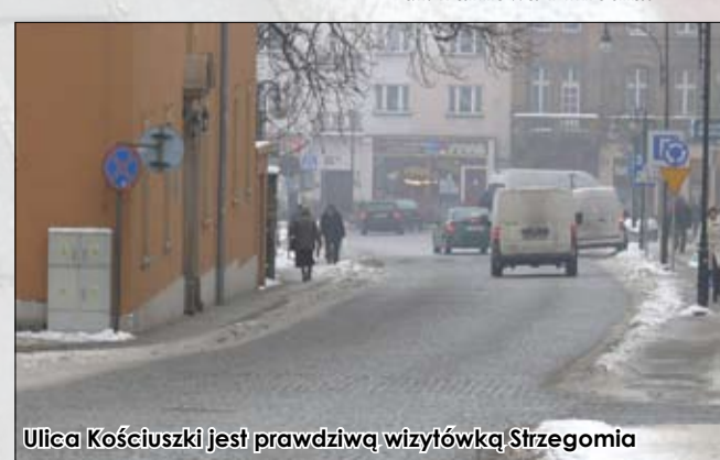
Ulica Kościuski jest prawdziwą wizytówką Strzegomia

Dobiegła końca realizacja zadania pod nazwą „Przebudowa odcinka nawierzchni ul. Kościuski w Strzegomiu wraz z budową ciągu pieszo-jednego ul. Czerwonego