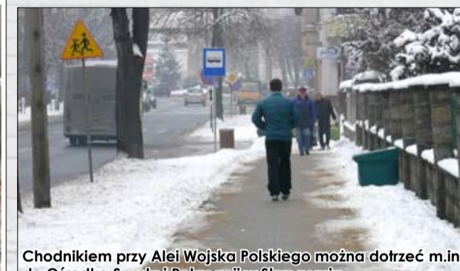
Chodnikiem przy Alei Wojska Polskiego można dotrzeć m.in. do Ośrodka Sportu i Rekreacji w Strzegomiu

dzielnicy Strzegomia. Na razie poprzez ładniejsze chodniki i zjazdy na poseje ale także poprzez nowe nasadzenia zieleni na skwerze wokół pomnika mieszkańców osiedla Graby, poległych podczas I Wojny Światowej. Wszystkie te działania sprawiają, że mieszkańcom będzie żyło się lepiej i ładniej,