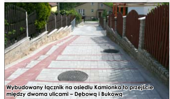
Wybudowany łącznik na osiedlu Kamionka to przejście między dwoma ulicami – Dębowa i Bukowa