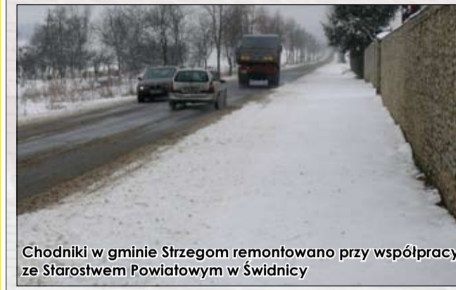
Chodniki w gminie Strzegom remontowano przy współpracy ze Starostwem Powiatowym w Świdnicy

W listopadzie 2012 r. zakończył się remont chodnika przy Alei Wojska Polskiego w Strzegomiu. Chodnik jest ważnym ciągiem komunikacyjnym prowadzącym w m.in. kierunku strzegomskiego Ośrodka Sportu i Rekreacji, który podczas licznych imprez odwiedzają nie tylko