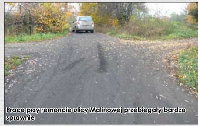
Drogi polne to ważny trakt komunikacyjny dla rolników

gospodarcze i wykorzystywane są najczęściej do dojazdu do pól uprawnych, co jednak nie zmienia faktu, że są równie ważne jak główne arterie. W zeszłym roku remontom poddano drogi polne w Goczałkowie Górnym, w Olszanych oraz w Żółkiewcu. Prace polegały na mechanicznym profilowaniu i wyrównywaniu nawierzchni dróg, wykonaniu niezbędnych dosypek odpowiednich kruszyw oraz obkoszeniu poboczy. Roboty wykonała firma „Zemar” ze Stanowic. Koszt tego przed-